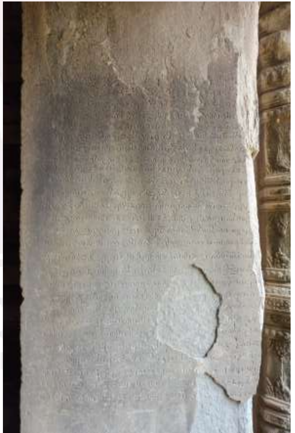
សិលាចារឹកមេទ្វារខាងត្បូងនិងខាងជើង