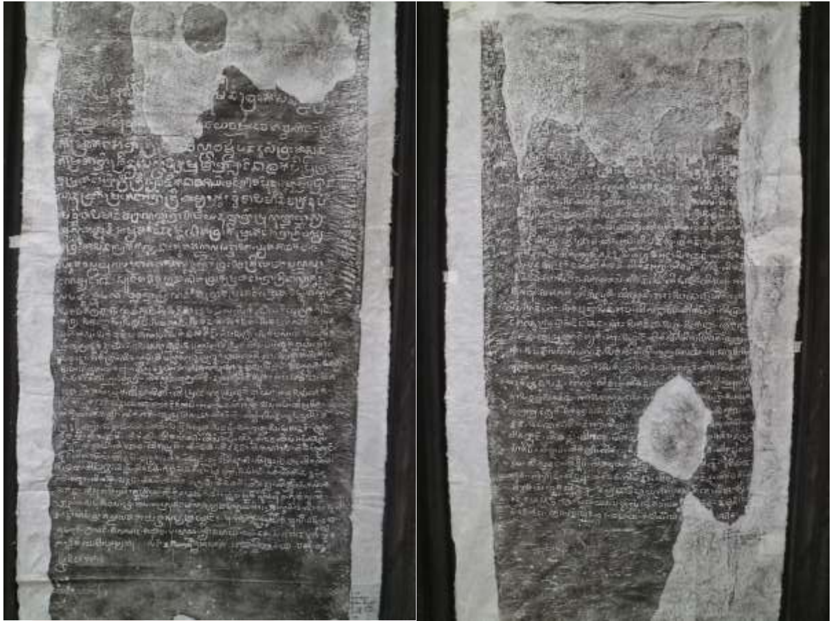
សំណៅផ្ចិតសិលាចារឹកមេទ្វារខាងត្បូងនិងខាងជើងរបស់ក្រុមការងារសារមន្ទីរជាតិ (រូបថត៖ ហ៊ិន ឈុនតេង)