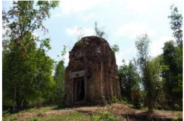
ប្រាសាទជើងអង្គ