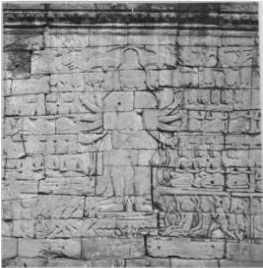
រូបលេខ១១៖ ចម្លាក់អវលោកិតេស្វរៈនៅបន្ទាយធ្មារ