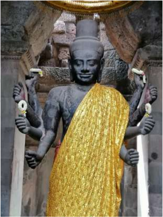
រូបលេខ៤៖ លោកតារាជ្យក្រោយជួសជុលឆ្នាំ២០០៤