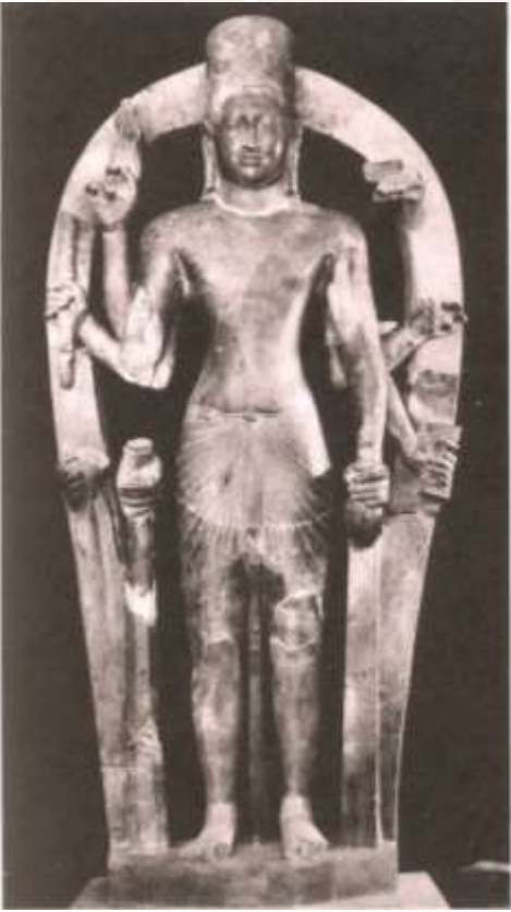
រូបលេខ៣៖ ព្រះវិស្ណុនៅប្រាសាទភ្នំដា