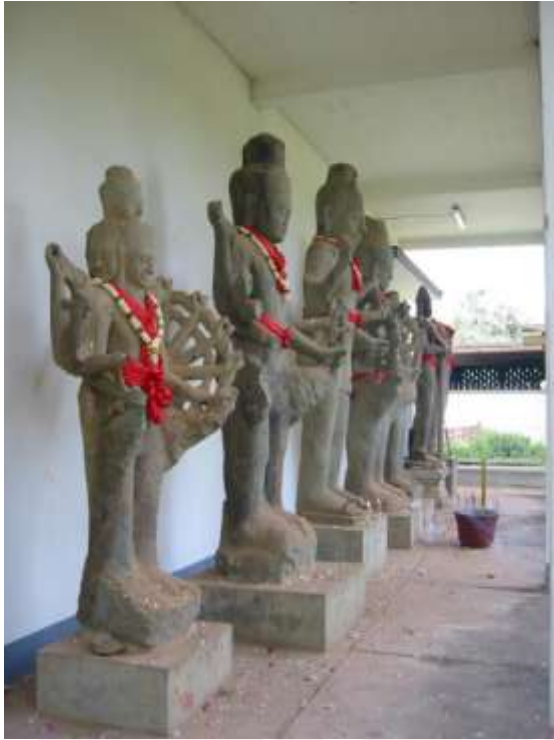
រូបលេខ៩៖ បដិមាអវលោកិតេស្វរៈដែលនៅភ្នំដី