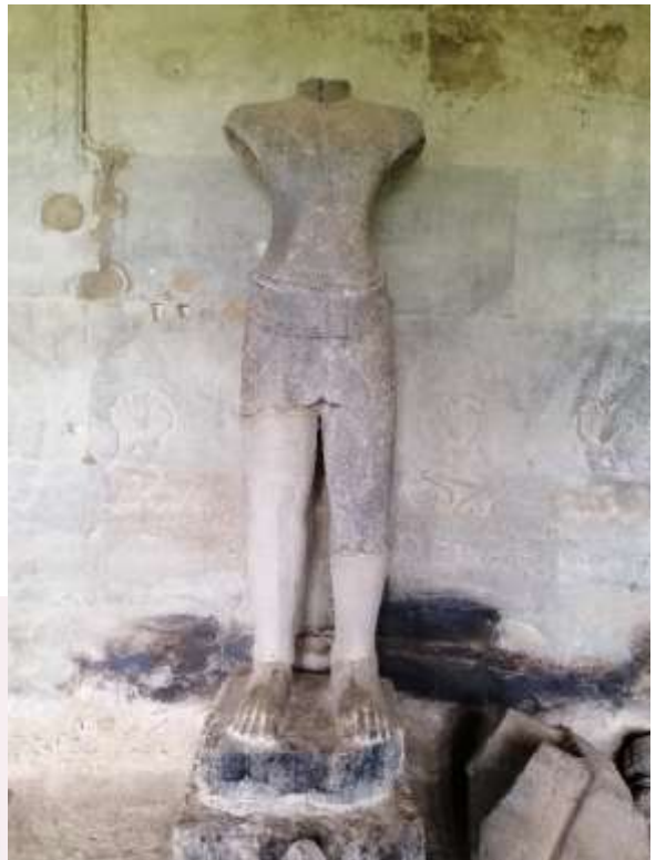
រូបលេខ៦៖ បដិមាលោកេស្វរៈ