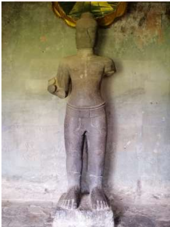
រូបលេខ៧៖ បដិមាអវលោកិតេស្វរៈ២៨