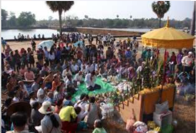
រូបលេខ១២៖ ពិធីឡើងមាយនៅមុខលោកតារាជ្យ