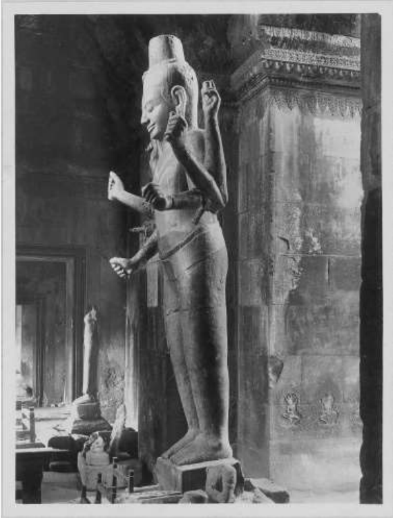
រូបលេខ១៖ ចម្លាក់លោកតារាជ្យមុនឆ្នាំ១៩៤៩