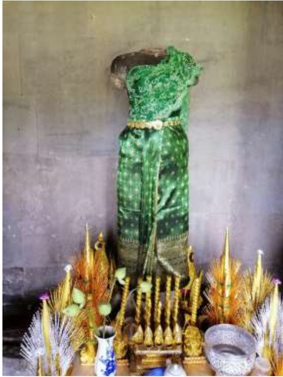
រូបលេខ៥៖ បដិមាលោកេស្វរៈខាងត្បូងលោកតារាជ្យ