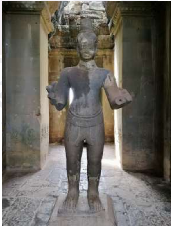
រូបលេខ៨៖ បដិមាអវលោកិតេស្វរៈ២១០