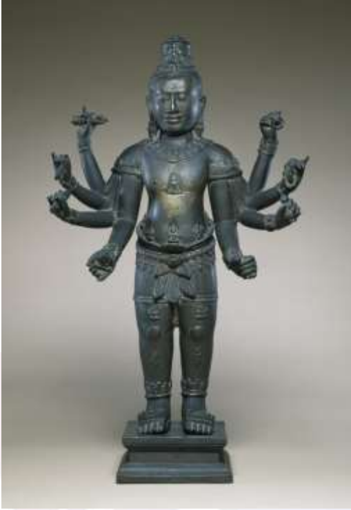
រូបលេខ១០៖ បដិមាអវលោកិតេស្វរៈដែល