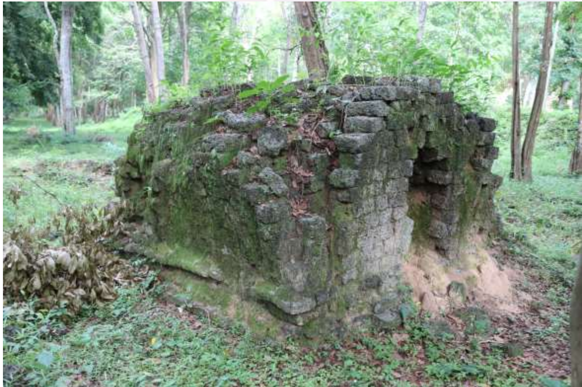
រូបលេខ៤៖ ប្រាសាទយាយព័ន្ធ ភ្នំប៉ែន S17-6 សាងពីថ្មបាយក្រៀម (មើលពីទិសពាយព្យ)