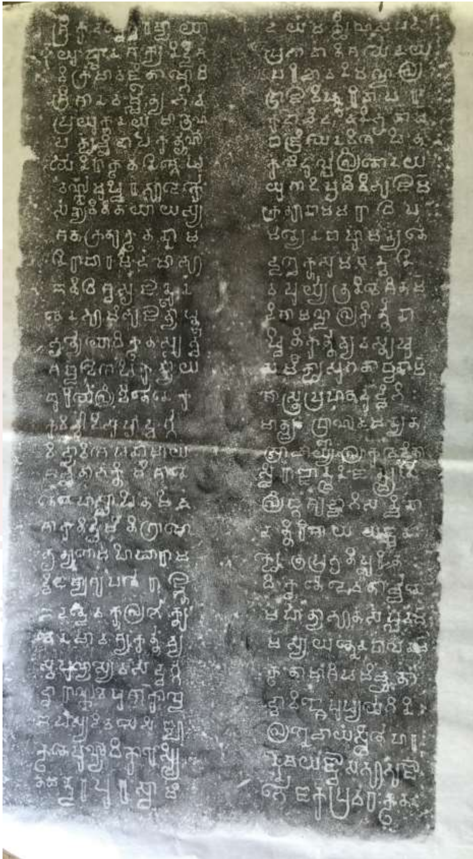
រូបលេខ៧៖ ក្រដាសផ្កិតសិលាចារឹក K.606 (ផ្កិតដោយ៖ កំ វណ្ណារ៉ា)