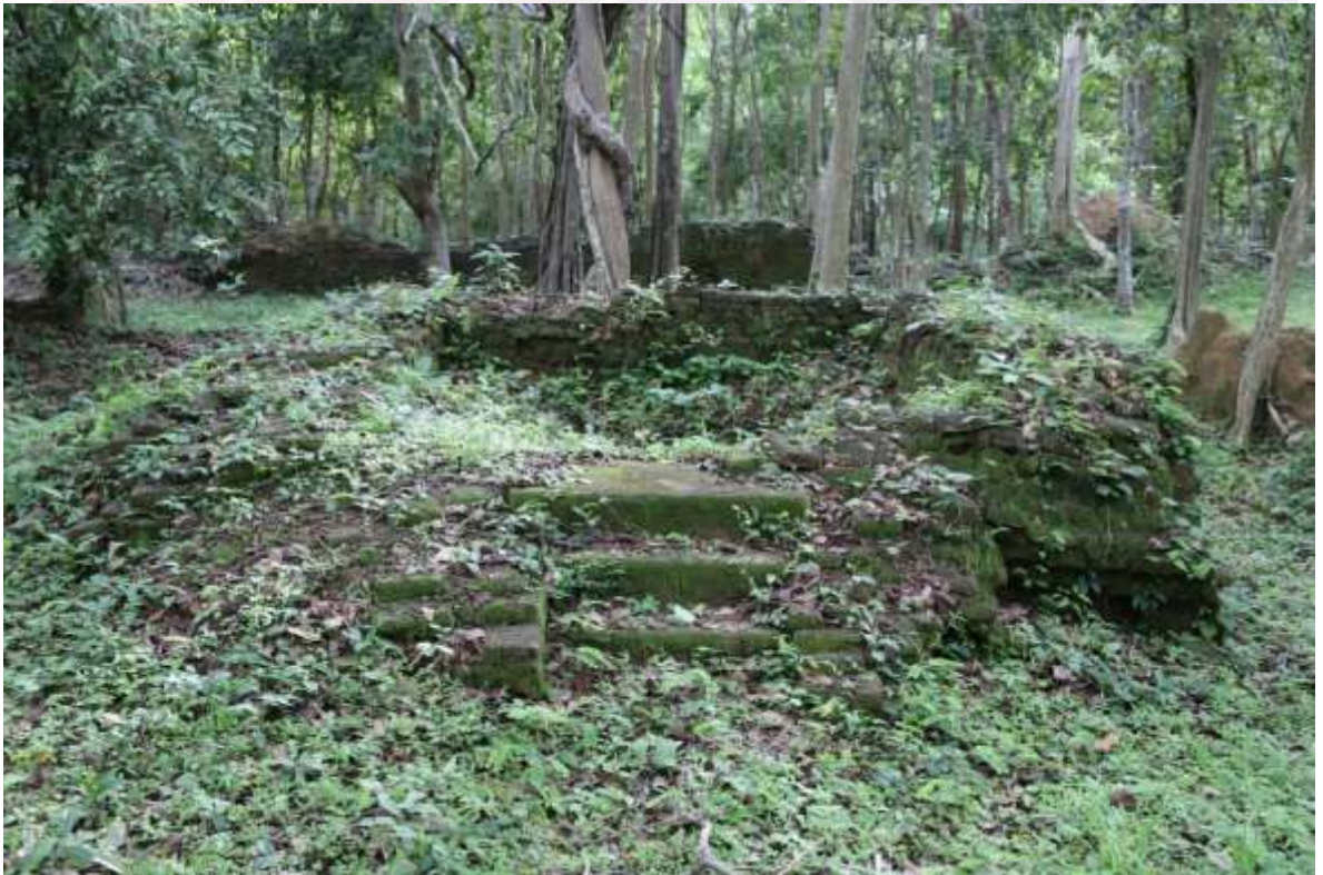
រូបលេខ២៖ ប្រាសាទយាយព័ន្ធ ភ្នំប៉ែន S17-5 សាងពីថ្មបាយក្រៀម (មើលពីខាងកើត)