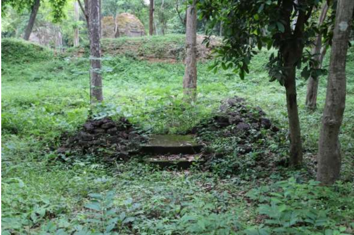
រូបលេខ១៖ ប្រាសាទយាយព័ន្ធ ភ្នំប៉ែន S17-4 សាងពីថ្មបាយក្រៀម (មើលពីខាងកើត)