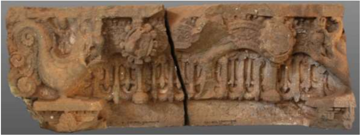
រូបលេខ៥៖ ផ្តែរទ្វារ ប្រាសាទយាយព័ន្ធ ភ្នំប៉ម S17-6