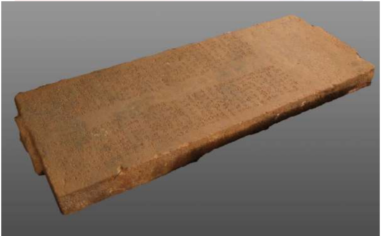
រូបលេខ៦៖ សិលាចារឹក K.៦០៤ រកឃើញនៅប្រាសាទយាយព័ន្ធ ភ្នំប៉ម S17-6