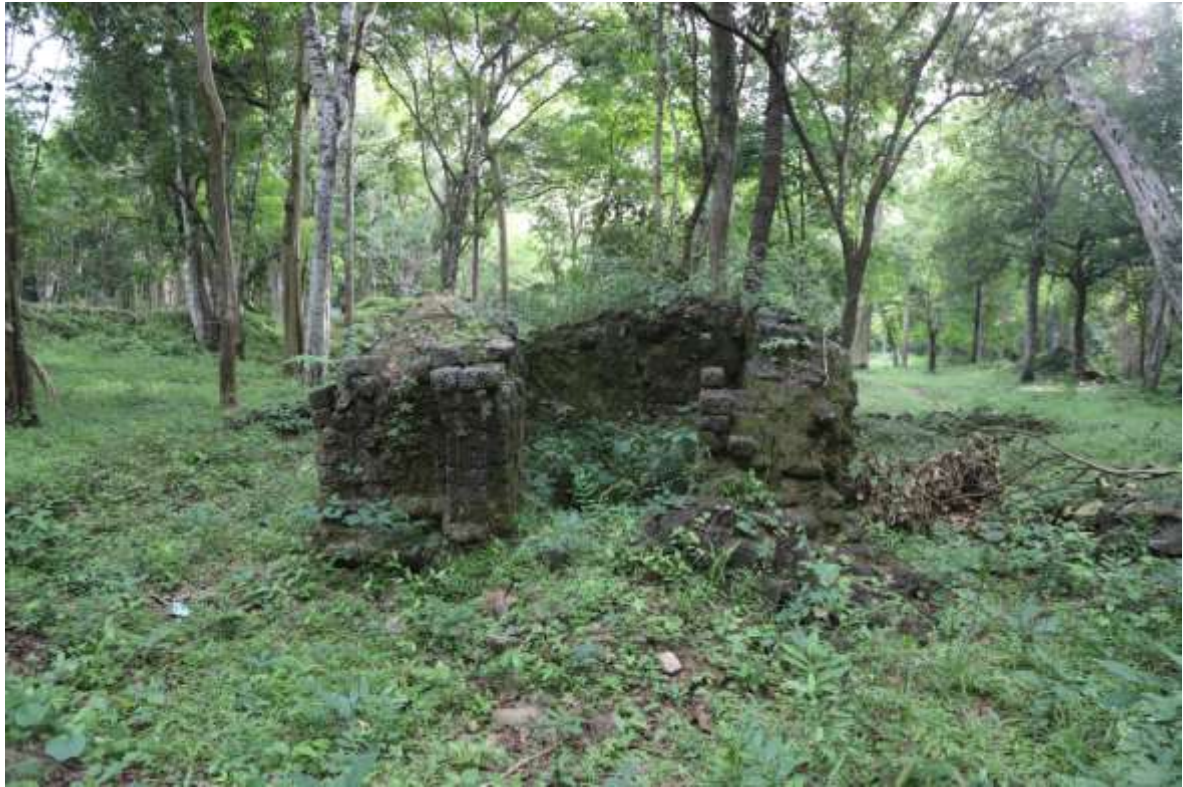
រូបលេខ៣៖ ប្រាសាទយាយព័ន្ធ ភ្នំប៉ែន S17-6 សាងពីថ្មបាយក្រៀម (មើលពីខាងកើត)