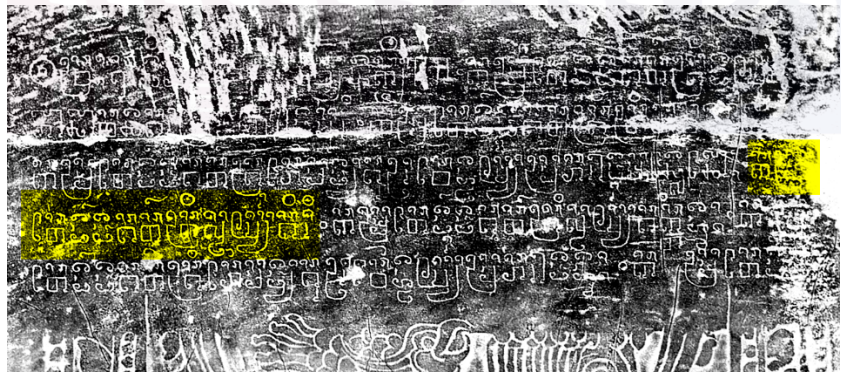
សិលាចារឹកប្រាសាទបាយ័ន K.293-3