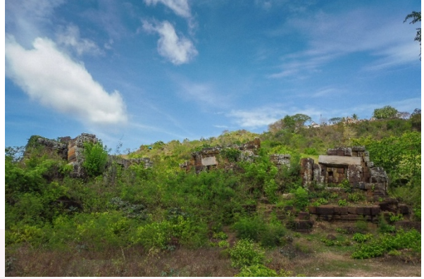
ប្រាសាទភ្នំជីសូរមើលពីចម្ងាយនិងពីប្រាសាទសែនគ្គុល