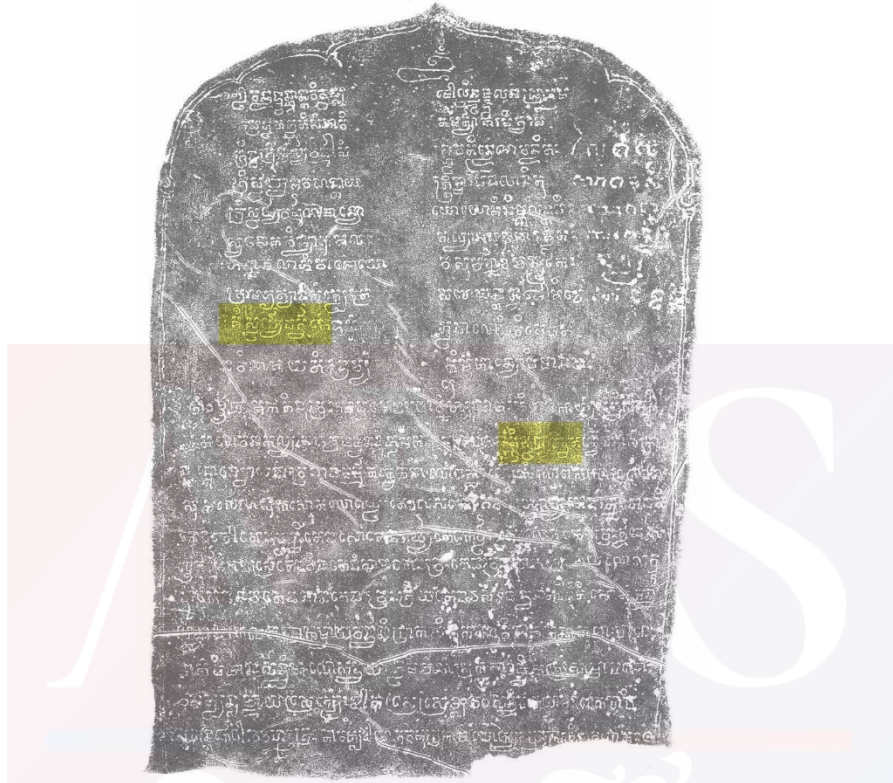
សិលាចារឹកប្រាសាទភ្នំជីសូរ K.32