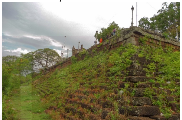
ប្រាសាទភ្នំជីសូរមើលពីខាងមុខនិងជ្រុងភ្នំសាន