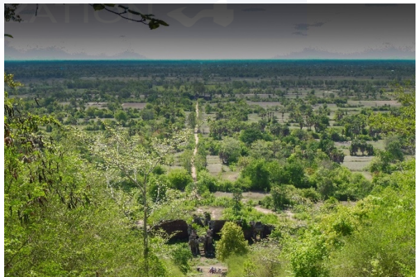
ជណ្តើរ បុរាណនិងផ្លូវបុរាណពីប្រាសាទសែនគ្គុលទៅទន្លេអុំ