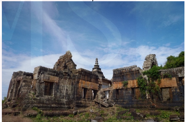
ប្រាសាទសែនគ្គុលនិងប្រាសាទសែនរាំង