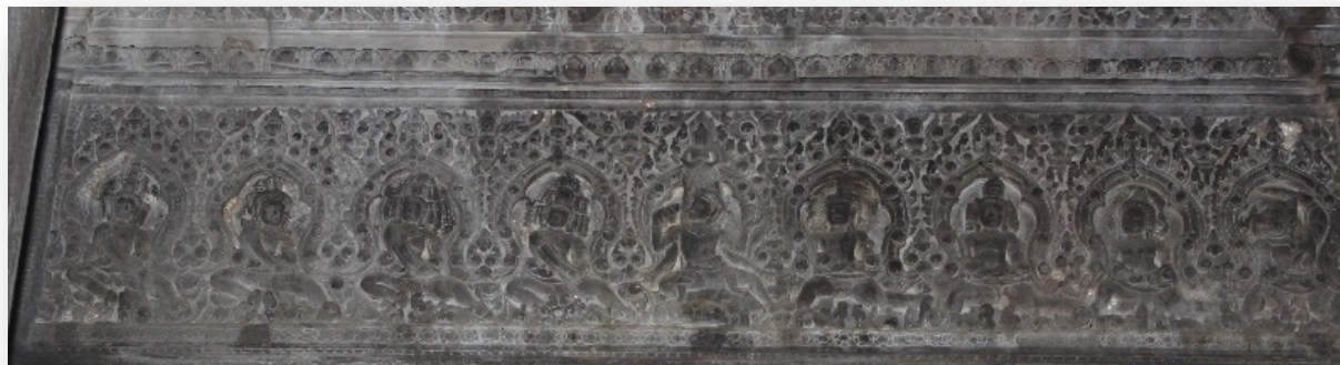
រូបទី៣ ផ្តែរទ្វារខាងជើងរបស់ប្រាង្គកណ្តាល