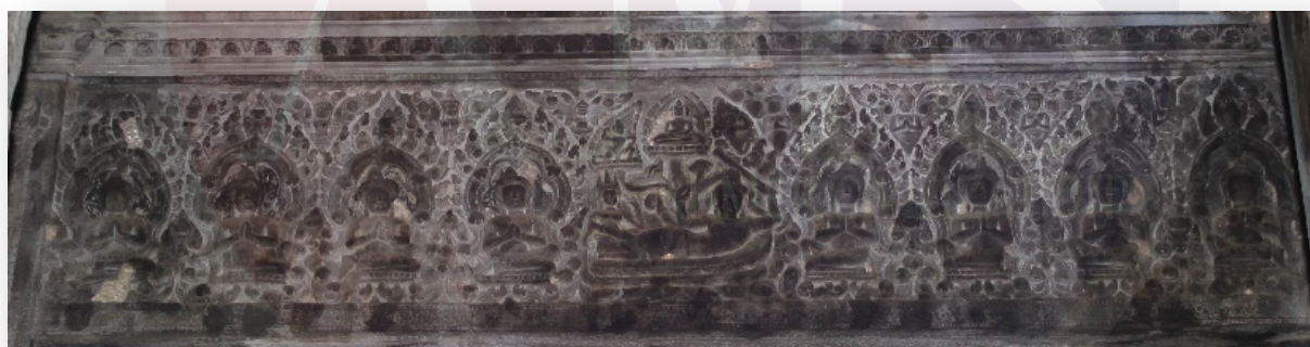
រូបទី៥ ផ្តែរទ្វារខាងត្បូងរបស់ប្រាង្គកណ្តាល