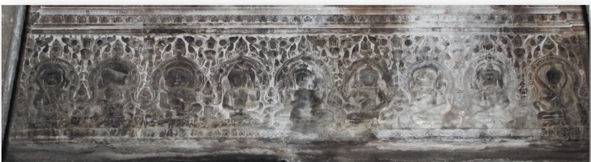
រូបទី២ ផ្តែរទ្វារខាងលិចរបស់ប្រាង្គកណ្តាល