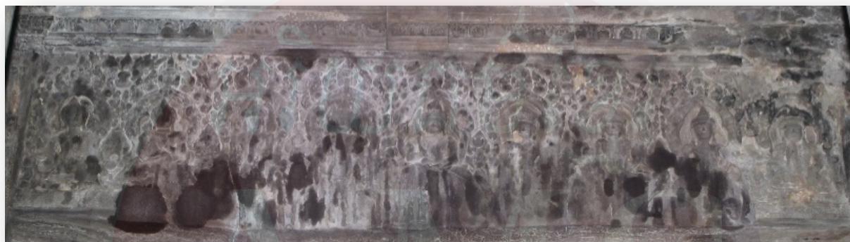
រូបទី៤ ផ្តែរទ្វារខាងកើតរបស់ប្រាង្គកណ្តាល