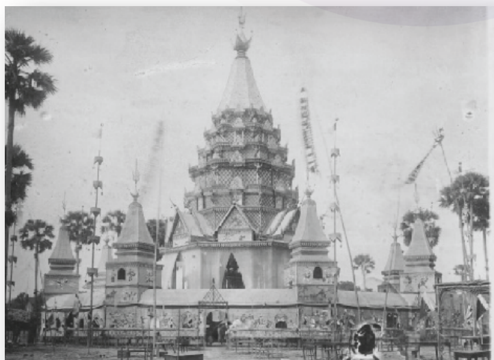
រូបទី៦ មេនបូជាសពតំបន់អង្គរ (រូបថត)