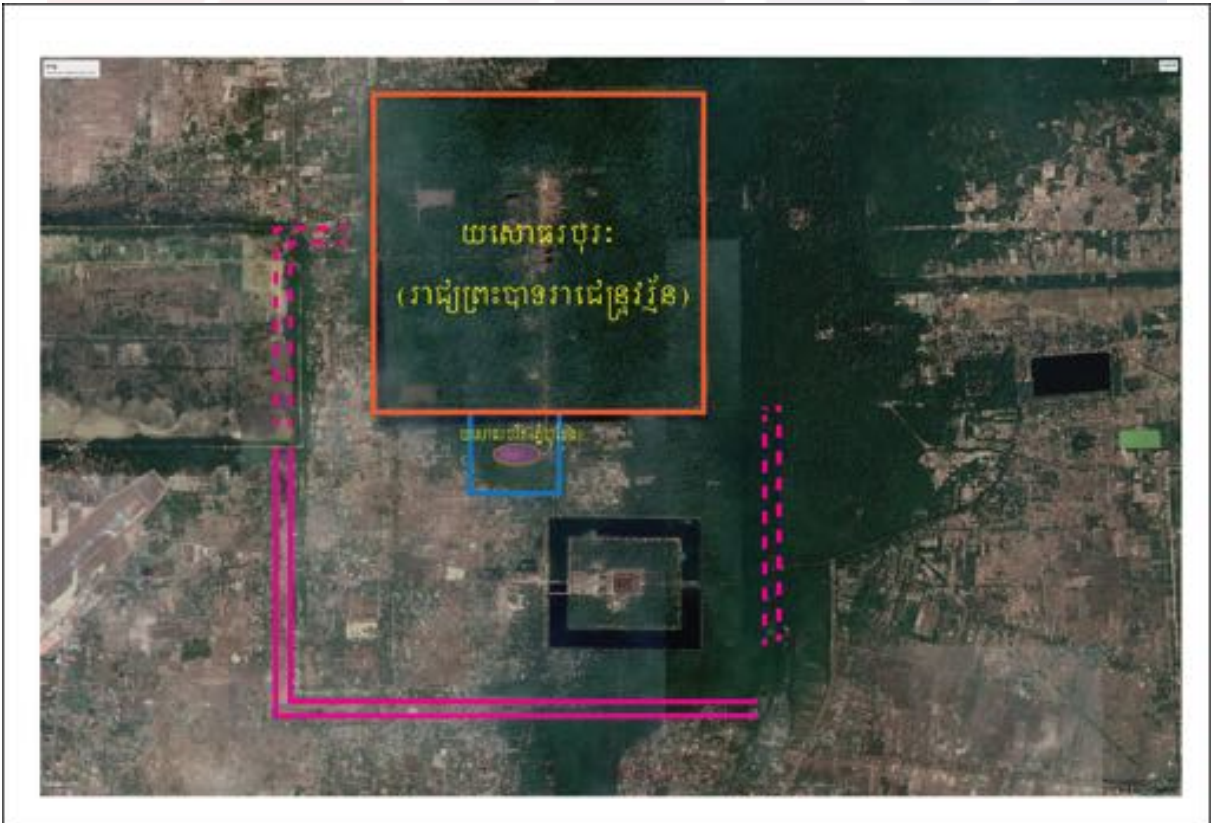
រូបលេខ៣ ការសន្និដ្ឋានលើទីតាំងរាជធានីយសោធរបុរៈកែប្រែដោយព្រះបាទរាជេន្ទ្រវរ្ម័នទី២