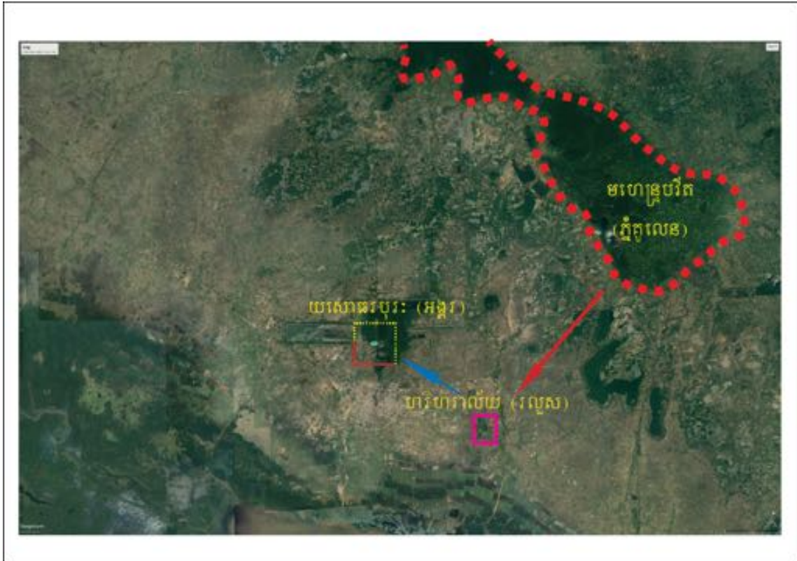
រូបលេខ២ ការប្តូររាជធានីពីហរិហរាល័យទៅយសោធរបុរៈ ដោយព្រះបាទយសោវរ្ម័នទី១