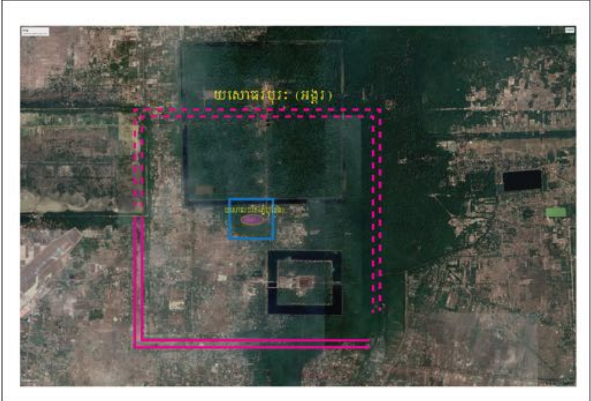
រូបលេខ២ ការសន្និដ្ឋានលើទីតាំងរាជធានីយសោធរបុរៈដំបូងកសាងដោយព្រះបាទយសោវរ្ម័នទី១