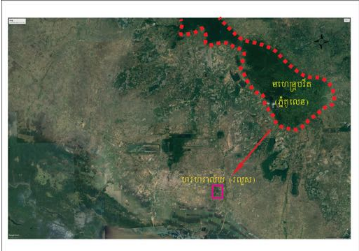
រូបលេខ១ ការតាំងរាជធានីនៅមហេន្ទ្របវ័ត និងប្តូរមកហរិហរាល័យ ដោយព្រះបាទជ័យវរ្ម័នទី២

អត្ថបទនេះ គ្រាន់តែជាសេចក្តីសង្ខេបអំពីការកកើតទីក្រុងឬរាជធានីដំបូងនាដើមសម័យអង្គរ និងការផ្លាស់ប្តូរទីតាំងរាជធានីថ្មីៗ ក្នុងសម័យអាណាចក្រអង្គរ។ អត្ថបទក្រោយនឹងលើកយកបង្ហាញលម្អិតអំពីទីក្រុង និងហេដ្ឋារចនាសម្ព័ន្ធក្នុងនីមួយៗ។