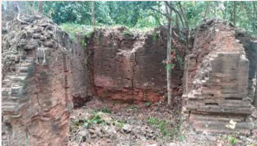
ប្រាសាទល្លើកអំពិល