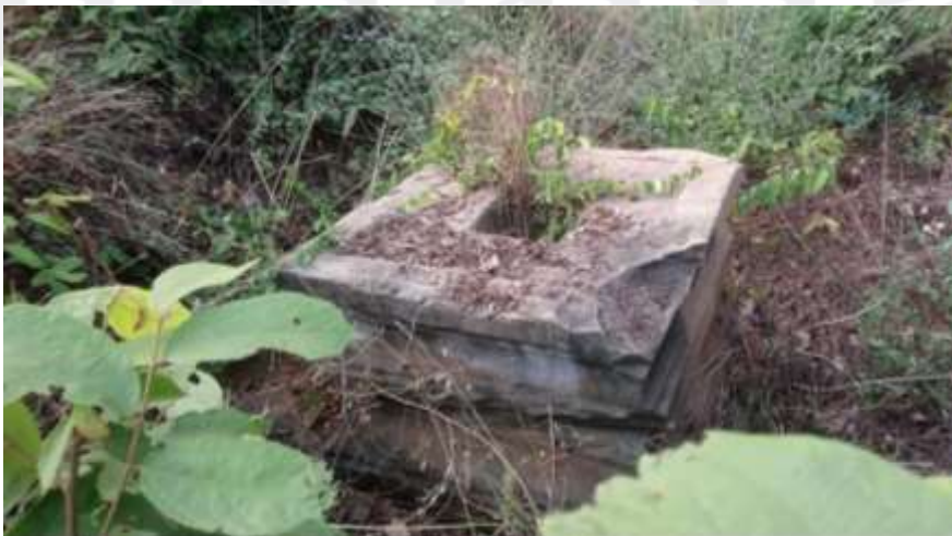
បង្គំផ្តិតនៅប្រាសាទល្លើកស្វាយ