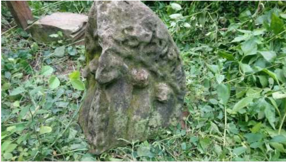
នាងចែងប្រាសាទល្បើកស្វាយ (រូបថត៖ ចាន់ អឿន)