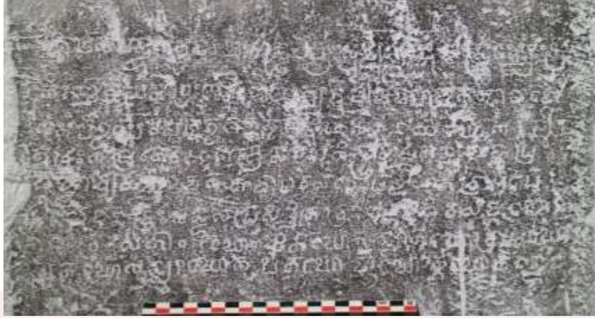
សំណៅផ្តិតសិលាចារឹកបន្ទាយព្រាវ (ដោយ៖ ហ៊ិន ឈុនតេង)