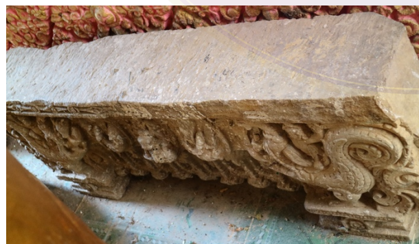
ផ្ទៃរចនាបថសំបូរព្រៃគុក រក្សាទុកក្នុងព្រះវិហារ (ខែមករា ឆ្នាំ២០១៨)

ច- ព្រះអង្គប្រកបដោយសិរីសួស្តីនិងវីរភាពនៃស្តេចចក្រពត្តិ ជាឯកនៅលើផ្ទៃដីនៅ ក្នុងដែន)សុវណ្ណកូមិ ទៅទល់នឹងសមុទ្រ។