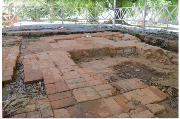
ខឿនប្រាសាទ ធ្វើកំណាយដោយក្រសួងវប្បធម៌ និងវិចិត្រសិល្បៈ (ខែកក្កដា ឆ្នាំ២០២០)