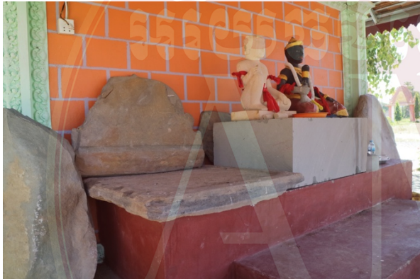
សំណល់សម្ភារៈសំណង់ប្រាសាទនិងសិលា ចារឹក (ខែកក្កដា ឆ្នាំ២០២០)