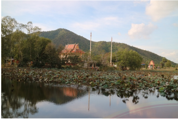
គូទឹកប្រាសាទដែលដឹកស្កានិងពង្រីក (ខែមករា ឆ្នាំ២០១៨)