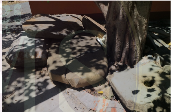
សំណល់សម្ភារៈសំណង់ប្រាសាទនិងសិលា ចារឹក (ខែកក្កដា ឆ្នាំ២០២០)