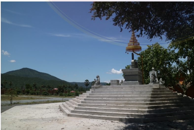
ទីតម្កល់សិលាចារឹកចម្លងថ្មី នៅ ខាងជើងព្រះវិហារ (ខែកក្កដា ឆ្នាំ២០២០)