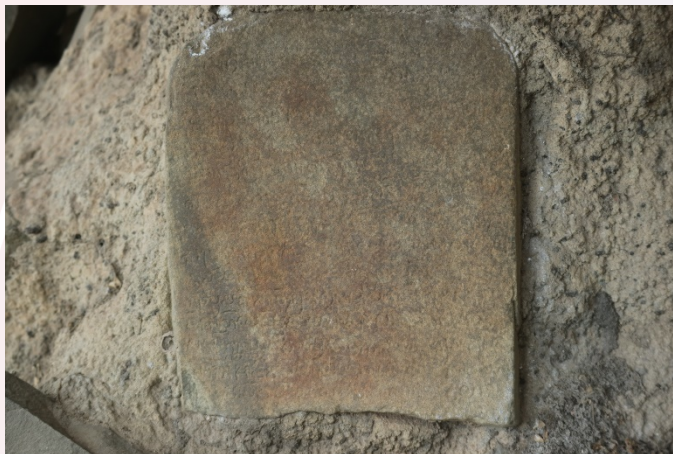
រូបសិលាចារឹក