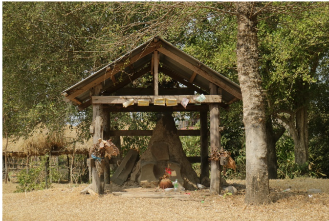
ខ្នងអ្នកតាបាស់ស្រុកនៅទួលជន្លូស