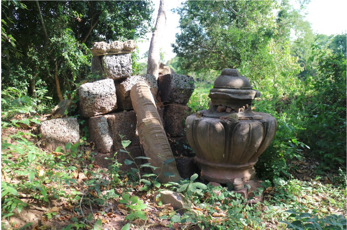
វត្ថុសិល្បៈជាគ្រឿងលម្អប្រាសាទបន្ទាយព្រាវ (ដោយ៖ ហ៊ិន ឈុនតេជ)