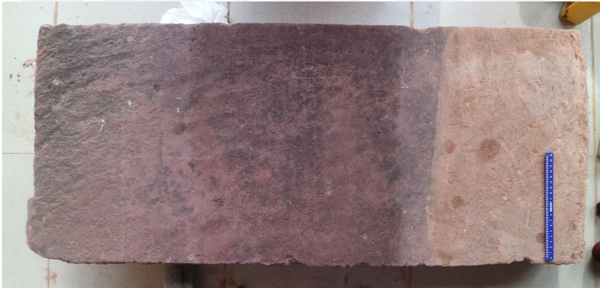
រូបថតសិលាចារឹកមកពីប្រាសាទបន្ទាយព្រាវ