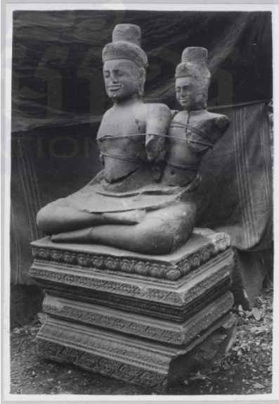
រូបលេខ៨៖ រូបរឿងឯកបទ(Ekapada) និងសទាសិវៈ មកពីព្រៃជ្រូ សតវត្សទី១០-១១ NMC718 សារមន្ទីរជាតិ ភ្នំពេញ