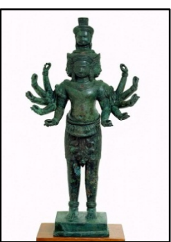
រូបលេខ៤៖ សទាសិវៈកាយវិកាយរ មានព្រះកក្រដាព្រះហស១០នៅភ្នំ ប្រាសាទវត្តភ្នំក្នុងសតវត្សទី១១នៃគ.ស