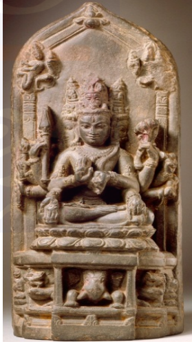
តារាងទី១៖ ការបង្ហាញតាមព្រះភក្ត្រទាំង៥ និងប្រភេទខុសៗរបស់សទាសិវៈ រូបលេខ១៖ សទាសិវៈកាយវិការ អង្គុយភក្ត្រ៥ព្រះហសនៅឥណ្ឌា