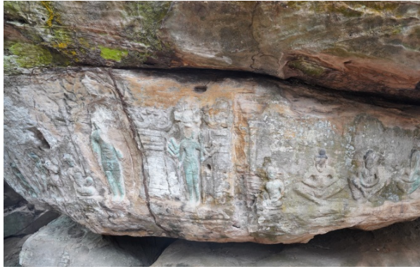
រូបលេខ៥៖ បង្ហាញរូបសទាសិវៈមាន២ប្រភេទ ក្នុងសតវត្សទី១១នៃគស