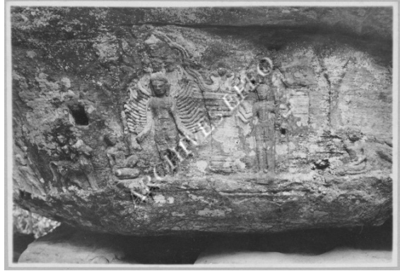
រូបលេខ៦៖ បង្ហាញរូបសទាសិវៈមាន២ប្រភេទ ក្នុងសតវត្សទី១១នៃគស (EFEO)