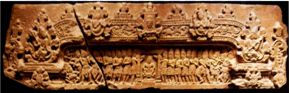
រូបលេខ១០៖ រូបសទាសិវៈឬមុខលីង្គ ដែលមានបង្ហាញក្នុងរឿងមហាសូរមុរតិទាំង២៥។ រឿងបង្ហាញពីការរៀបអភិសេកឡើងគ្រងរាជរបស់ព្រះមហាក្សត្រនៅប្រាសាទវត្តអង្គខ្នារ កំពង់ធំ សព្វថ្ងៃនៅសារមន្ទីរជាតិ(Ka.1774) (ប្រកាសJohn, 2012:165)។

មុនអង្គរសតវត្សទី៧នៃគ.ស ៤ (រូបលេខ១០)។ តើចម្លាក់សទាសិវៈឬមុខលីង្គនេះ ជារឿងអាចឱ្យយើងយល់ពីអ្វីខ្លះ? ចម្លាក់ផ្តែរមកពីប្រាសាទវត្តអង្គខ្នារនេះ កាន់តែបន្ថែមព័ត៌មានកាន់តែច្បាស់ទៀតថា ជារឿងទាក់ទងនឹងរឿងមហាសូរមុរតិទាំង២៥។ ផ្តែរបង្ហាញពីរូបសទាសិវៈផុសចេញពីសសរភ្លើង(លិង្កោទ្ត) និងមានព្រះព្រហ្មនៅខាងស្តាំ ព្រះវិស្ណុនៅខាងឆ្វេង បន្ទាប់ពីការផ្តល់គ្នារវាង ព្រះព្រហ្មប្រែរូបជាហង្សទៅរកកំពូលសសរភ្លើង និងព្រះវិស្ណុប្រែខ្លួនជាជ្រូកព្រៃទៅរកគល់សសរភ្លើង។ បន្ទាប់មករូបសិវលីង្គ និងសទាសិវៈព្រះភក្ត្រ៥ផុសចេញជាបន្តបន្ទាប់ ដើម្បីពន្យល់ពីការបង្កើតច្រក្រវាឡថ្មីទៅអទិទេពទាំងពីរដែលអមសង្ខាង។ ការបង្ហាញនេះខ្មែរបានយកមកអនុវត្ត និងប្រើប្រាស់សម្រាប់ធ្វើពីដីសំខាន់ៗសម្រាប់រាជ ការបូជាសាសនា និងការឡើងគ្រងរាជរបស់ព្រះមហាក្សត្រដែលប្រទះឃើញតាំងពីសតវត្សទី៧មក។ ឧទាហរណ៍មួយទៀតការសង់ក្រុមប្រាសាទ(N)ជារចនាបថសំបូរព្រៃគុកក៏បានបង្ហាញពីការរៀបចំដំបូងរបស់រាជធានីដែលយករឿងនេះមកស្ថាបនានៅលើដីផ្ទាល់ និងលើប្រាសាទសម្រាប់រាជ។