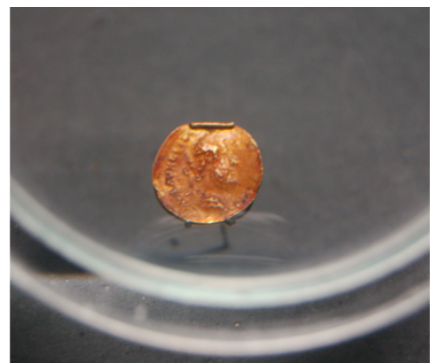
កាក់មាសរ៉ូម៉ង់