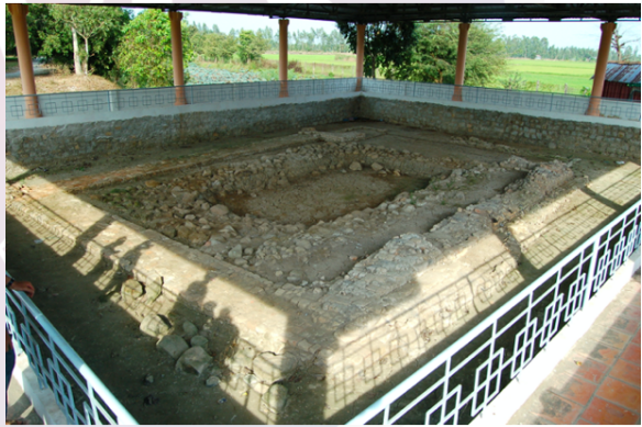
សារមន្ទីរអូរកែវ