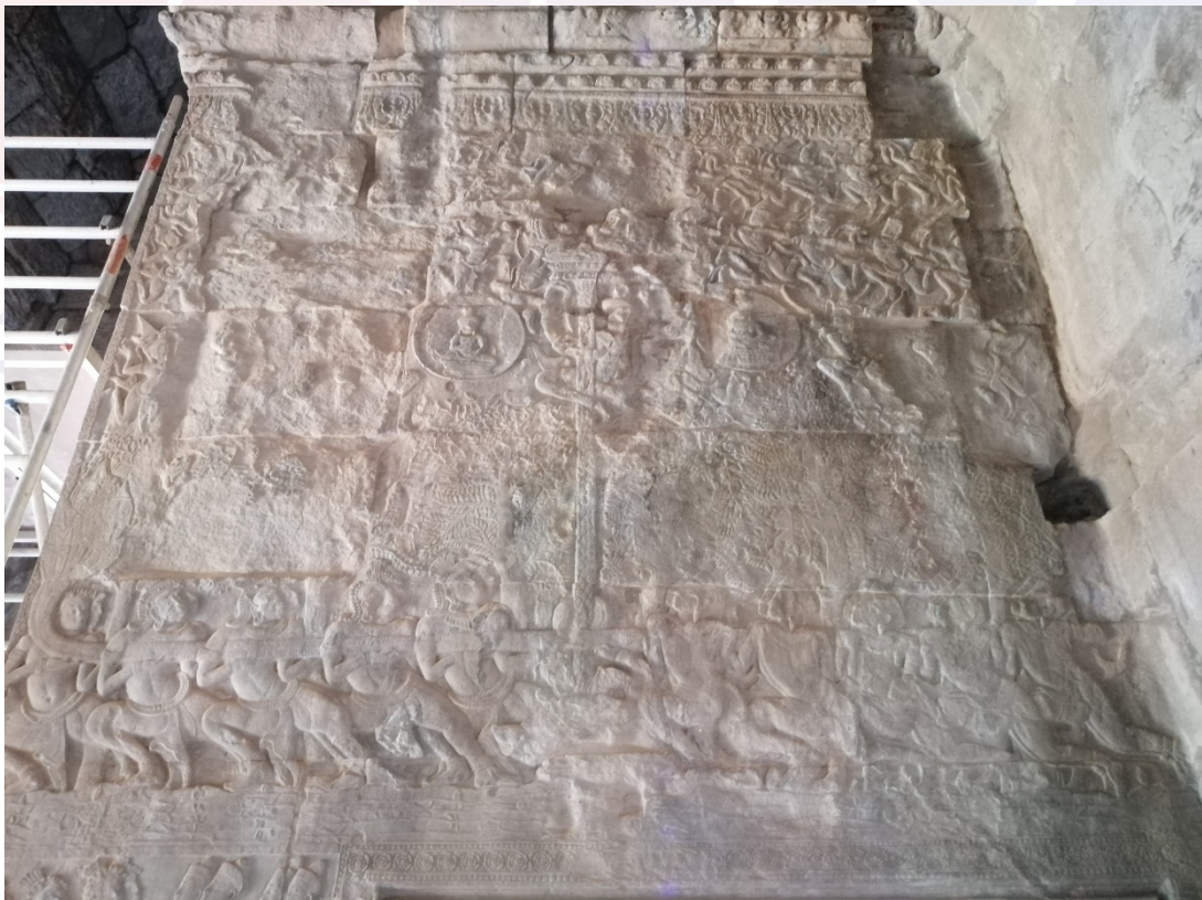
រូបលេខ៣៖ ចម្លាក់លើជញ្ជាំង (ប្រាង្គនិរតី ថែវទី១)