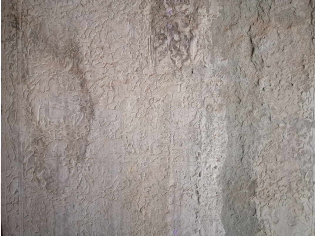
រូបលេខ៤៖ ចម្លាក់លើស៊ីទ្វារ (ប្រាង្គពាយ័ព្យ ថែវទី១)