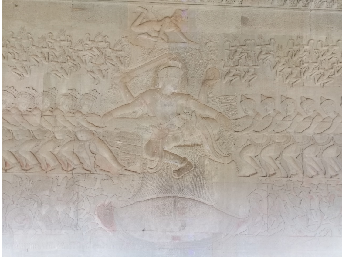
រូបលេខ៨៖ ចម្លាក់លើជញ្ជាំងថែវខាងកើត ស្ថាបខាងត្បូង (ថែវទី១)