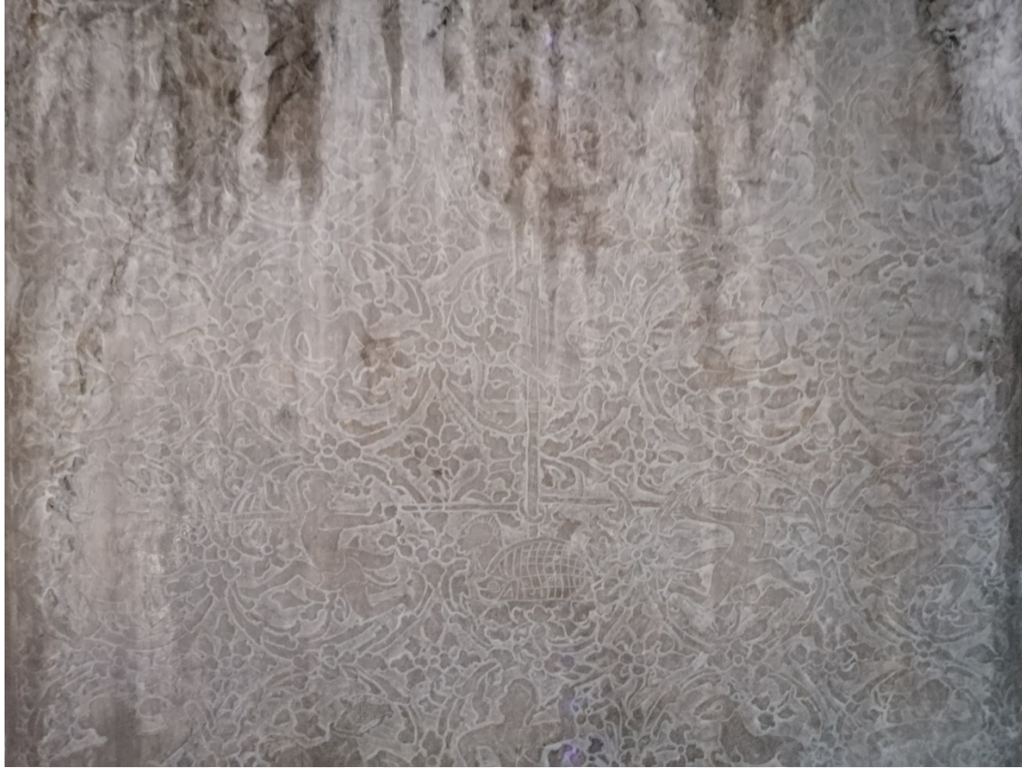
រូបលេខ៦៖ ចម្លាក់លើស៊ីទ្វារ (ប្រាង្គនិរតី ថែវទី២)