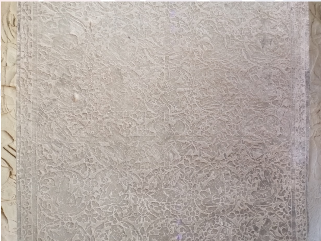
រូបលេខ៥៖ ចម្លាក់លើស៊ីទ្វារ (ប្រាង្គនិរតី ថែវទី២)