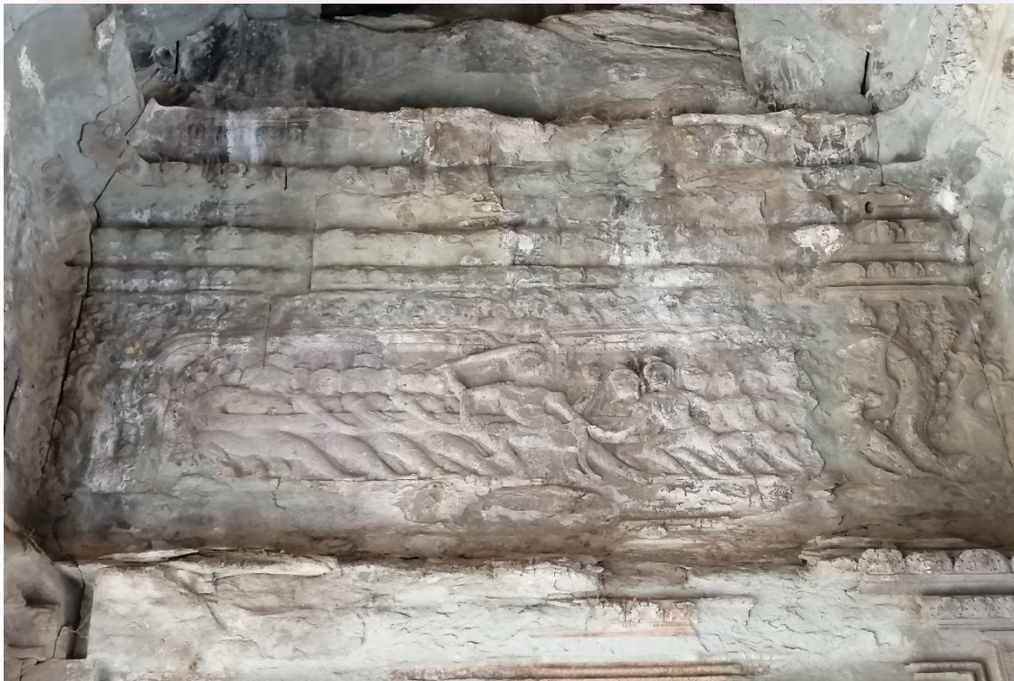
រូបលេខ៧៖ ចម្លាក់លើហោជាង (ទ្វារកណ្តាលនៃរូតព្រះពាន់)