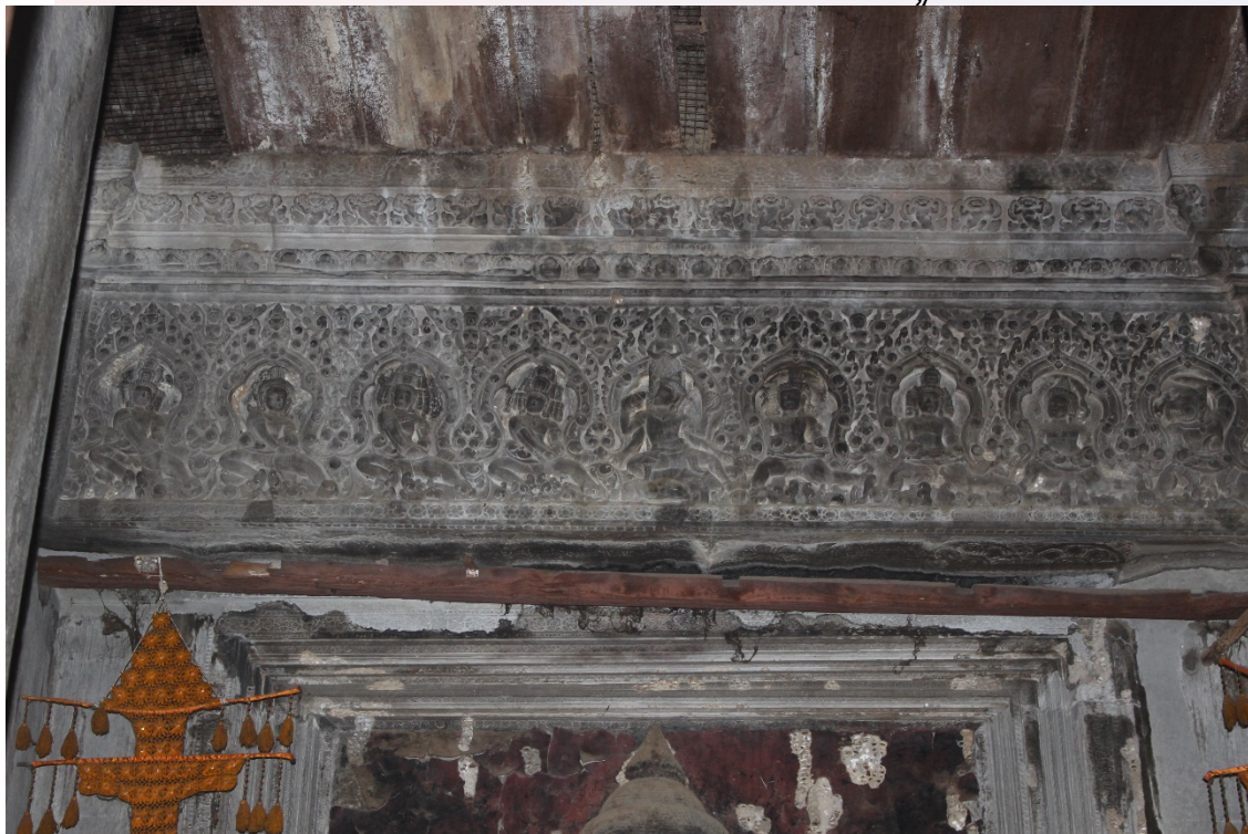
រូបលេខ៩៖ ចម្លាក់លើផ្តែរ ទ្វារខាងជើងនៃប្រាង្គបុកាណ