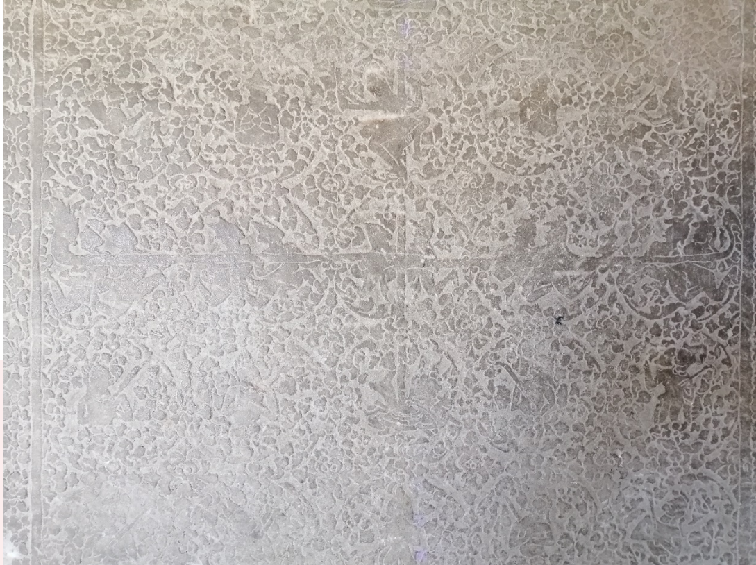
រូបលេខ២៖ ចម្លាក់លើស៊ីឡារ (ប្រាង្គនិរតី ថែវទី១)