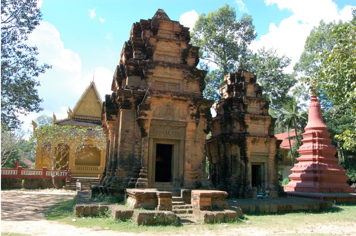
ប្រាសាទព្រះឥន្ទ្រកោសិយ៍ មើលពីខាងកើត