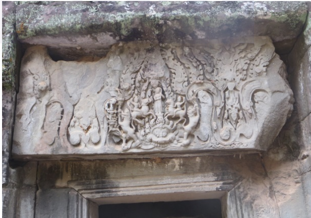
រូបលេខ២៖ រូបព្រះពុទ្ធផ្កាញ់មារ និងព្រះ នាងធរណីនៅផ្នែកប្រាសាទតាព្រហ្ម