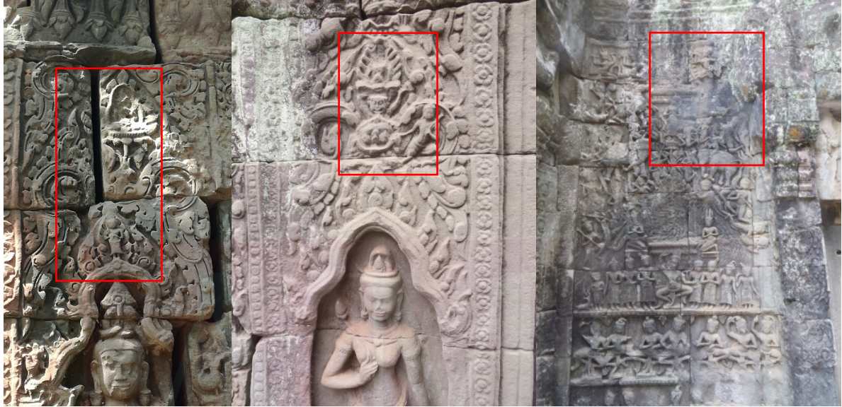
រូបលេខ៤៖ រូបព្រះពុទ្ធ និងព្រះម៉ែធរណីនៅ