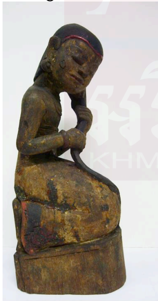
រូបលេខ៧៖ រូបព្រះម៉ែធរណីនៅសារមន្ទីរពេទ្យសាក្សា លេខ N.721