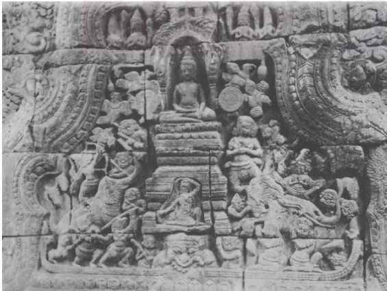
រូបលេខ១៖ រូបព្រះពុទ្ធផ្កាញ់មារ និងព្រះ នាងធរណី (Fournereau L., 1890)

សរុបសេចក្តីមកចម្លាក់ព្រះម៉ែធរណី និងការគោរព គឺមានតាំងពីសម័យមុនអង្គរ មកម៉្លេះ ដោយយើងប្រទះឃើញមានក្នុងសិលាចារឹក។ ចម្លាក់នៅតាមប្រាសាទមួយចំនួន ដូចជាតាព្រហ្ម បន្ទាយធំ បន្ទាយឆ្មារ ព្រះខ័ន ប្រាសាទជ្រុង បាយ័ន ដែលរូបមួយចំនួន បង្ហាញនៅលើហោជាងជាមួយព្រះពុទ្ធផ្កាញ់មារ និងផ្សេងទៀតធ្លាក់តាមជញ្ជាំងជាមួយ ព្រះពុទ្ធតូចៗ និងម៉ែធរណី ឬដូចអប្សរាធូតសក់។ រហូតដល់សតវត្សទី១៦ និង១៧គ.ស ទាំងខ្មែរ និងភូមាទៅបន្តធ្លាក់រូបម៉ែធរណី ឬគង្គីជារូបបដិមាទោលសម្រាប់គោរពបូជា និងមានបន្តសម្តែងក្នុងពិធីផ្សេងៗរហូតដល់បច្ចុប្បន្ន។ ព្រះម៉ែធរណីជាទេពទាក់ទងខ្លាំង ជាមួយសាសនាហិណ្ឌូ និងពុទ្ធសាសនា។ រូបចម្លាក់ទោលភាគច្រើនតែងធ្លាក់ជាមួយរូប ក្រពើ និងដៃស្អួតសក់ដំណាងឱ្យម្ចាស់ទឹកដី។ ព្រះម៉ែធរណីមានឈ្មោះច្រើនទាំងក្នុងពុទ្ធ សាសនា និងសាសនាហិណ្ឌូនៅប្រទេសឥណ្ឌា។ ព្រះម៉ែធរណីក៏ជាព្រះពោធិសត្វមួយអង្គ ហៅថា (Vasudhara) នៅក្នុងមហាយាន វជ្រះយាន និងជាទេពព្រះភូមិនៅក្នុងសាសនា ហិណ្ឌូទាំងនៅឥណ្ឌា ភូមា និងអាស៊ីអាគ្នេយ៍ផងដែរ។