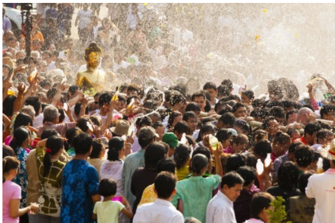
រូបលេខ៩៖ ពិធីអភិសេកព្រះ និងសម្តែងរៀងទាក់ទងនឹងនាងគង្គីឬព្រះម៉ែធរណី។