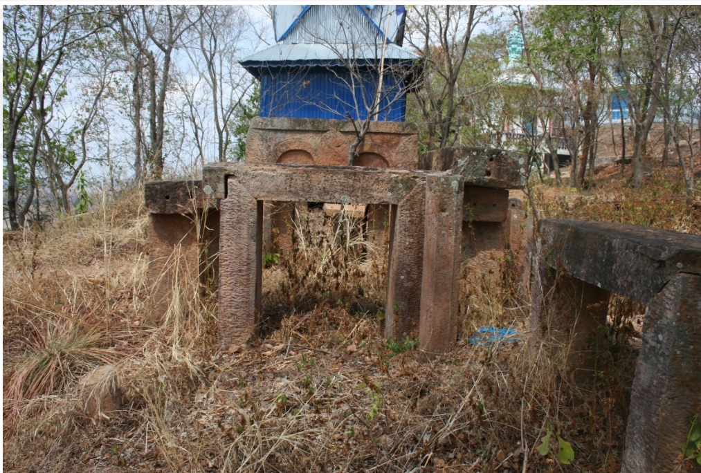
រូបលេខ២៖ ស៊ីទ្វាររបស់អគារ (C) ធ្វើមិនទាន់រួច អត្ថបទដោយ៖ សុខ កែវ សុវណ្ណារ៉ា