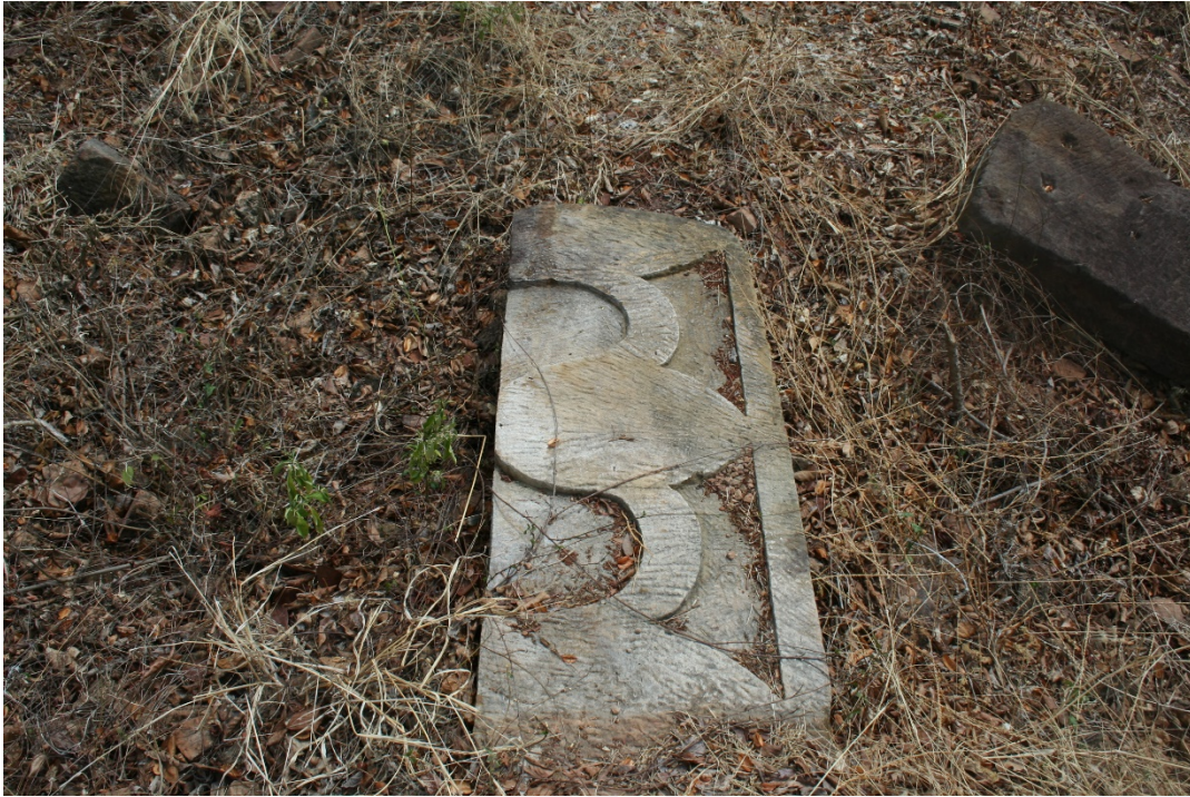
រូបលេខ៣៖ ផ្តែរធ្វើមិនទាន់រួច