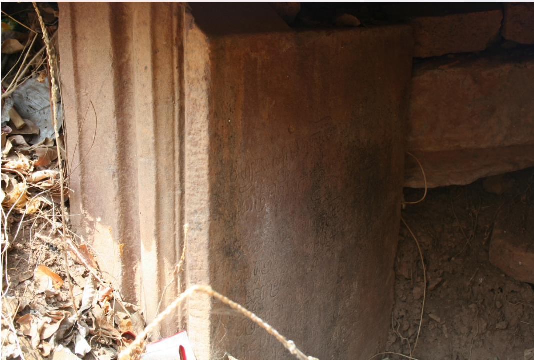
រូបលេខ៤៖ សិលាចារឹក K.215 លើស៊ីទ្វារខាងត្បូងអគារ (B)