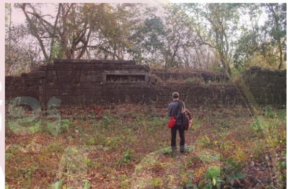
រូបលេខ៣-៤