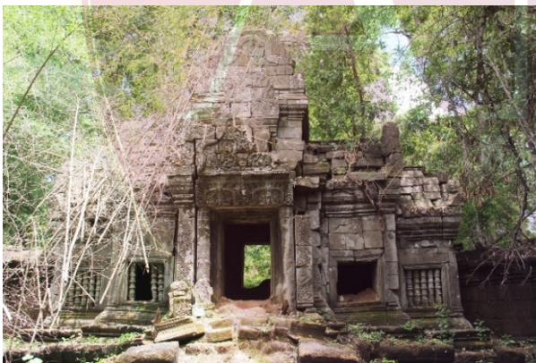
រូបលេខ៥-៦-៧