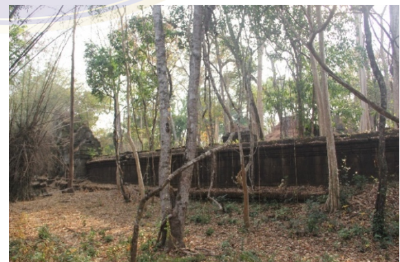
រូបលេខ៨-៩