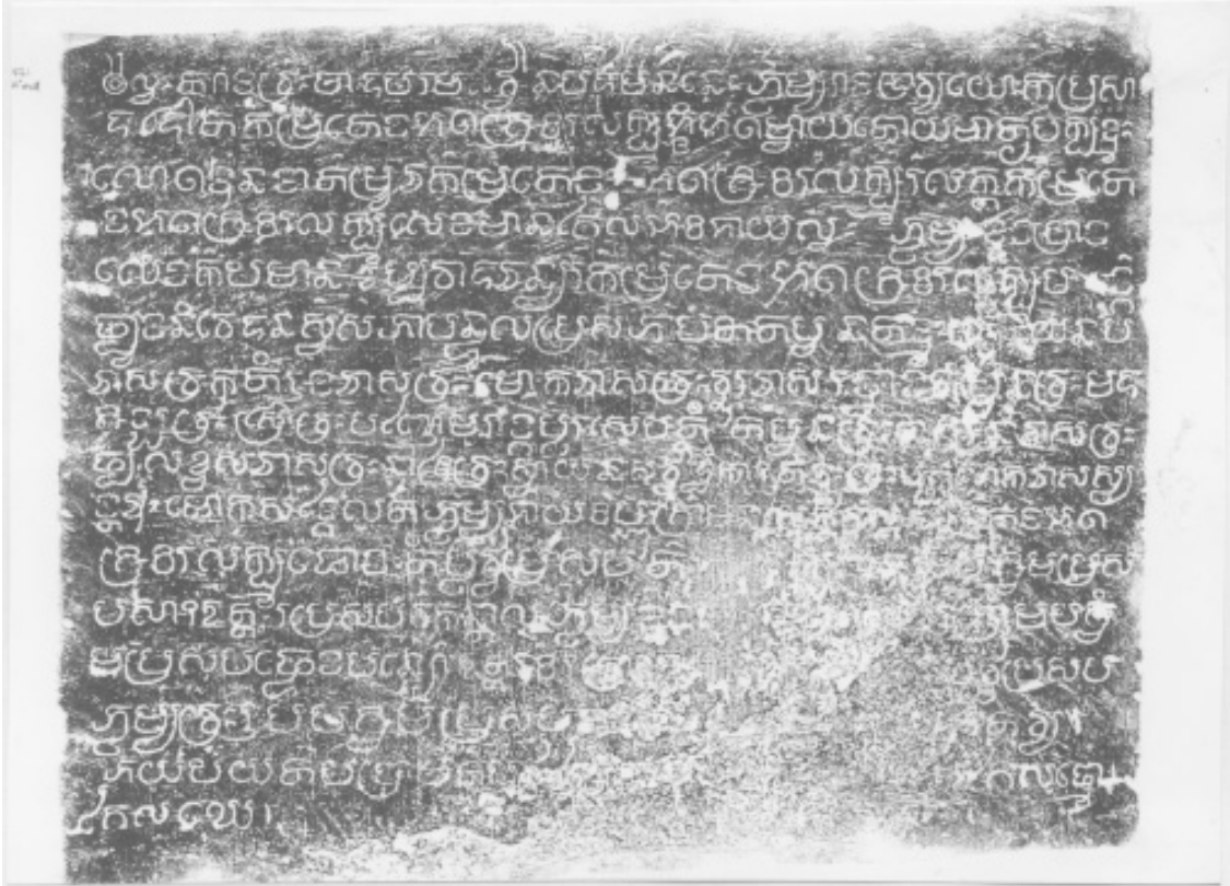
រូបលេខ៤៖ សិលាចារឹកលើស៊ីឡាររបស់ប្រាង្គខាងត្បូង