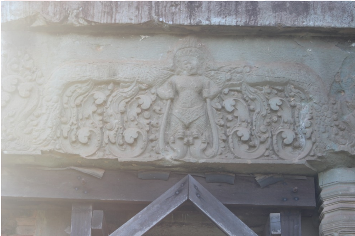
រូបលេខ៣៖ ផ្តែររបស់ប្រាង្គខាងត្បូង