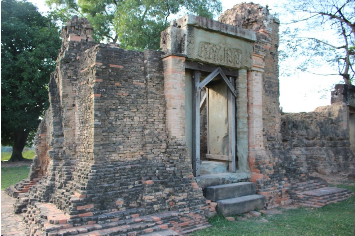
រូបលេខ២៖ ប្រាង្គខាងត្បូងប្រាសាទគោកចក