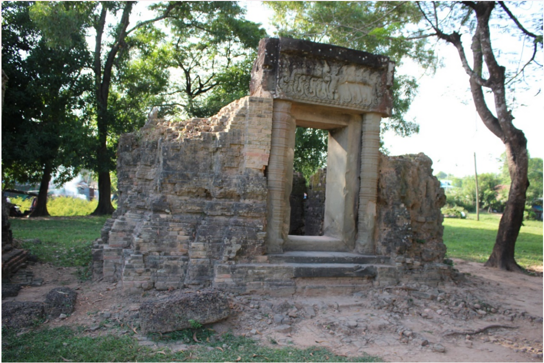
រូបលេខ៥៖ ប្រាង្គខាងជើងប្រាសាទគោកចក