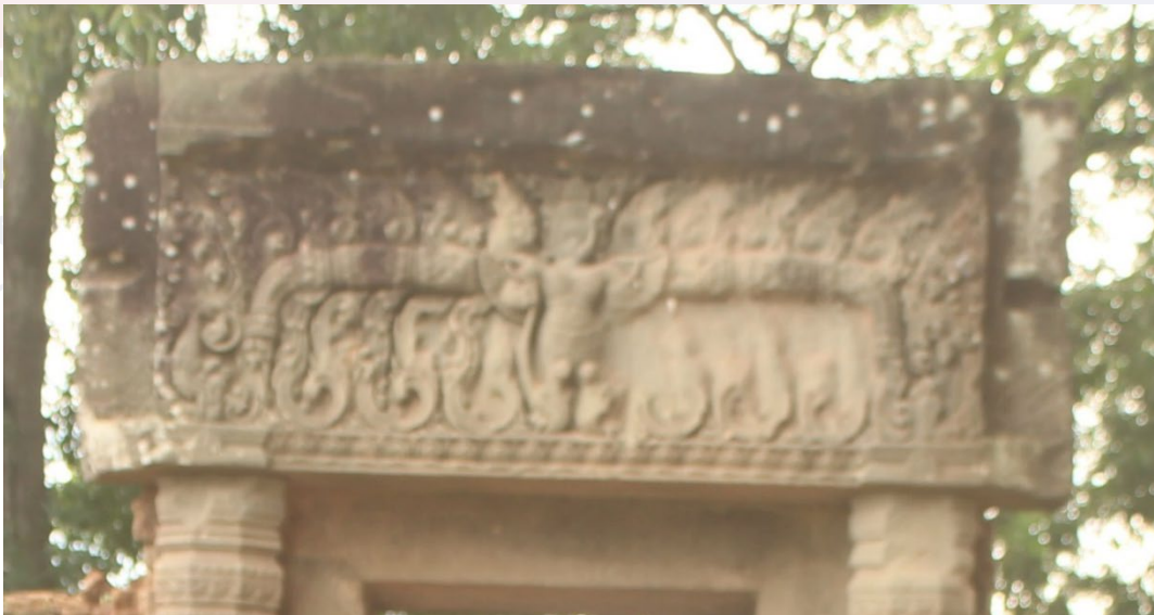
រូបលេខ៧៖ ផ្តែរទ្វារប្រាង្គខាងជើង