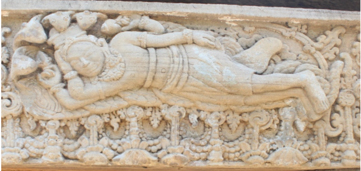
រូបលេខ២៖ ផ្តែរទ្វារនៅប្រាសាទគុកព្រះធាតុ (ភ្នំហាន់ជ័យ)