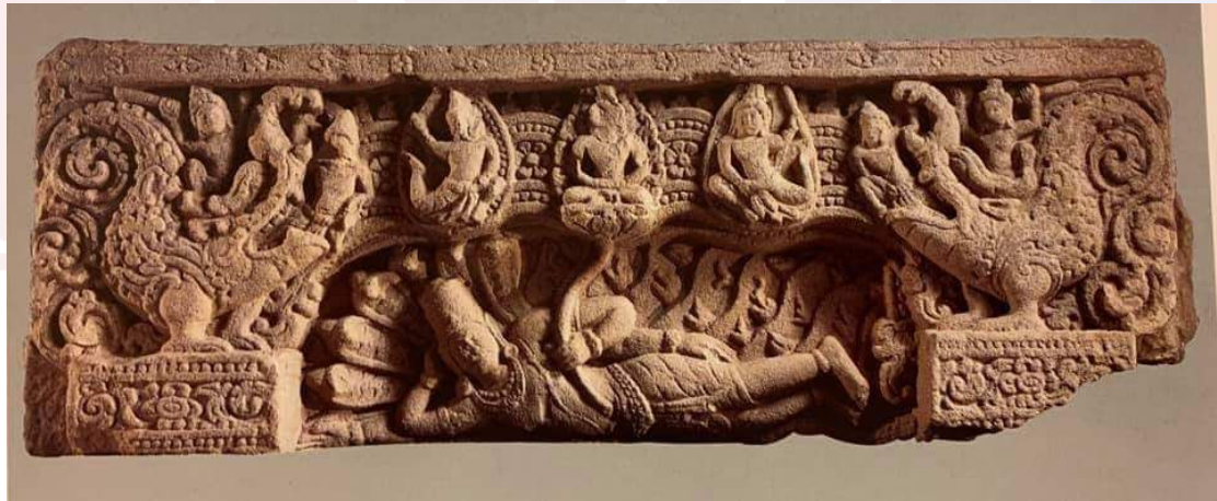
រូបលេខ១៖ ផ្នែរទ្វារមិនស្គាល់ប្រភពរក្សាទុកសហរដ្ឋអាមេរិក

2005. Visnu Purana Book 1, Chapter 3, p.18.