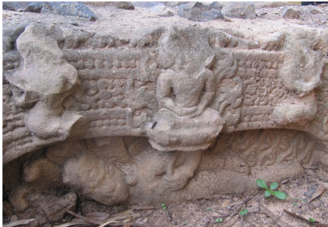
រូបលេខ៤៖ ផ្តែរទ្វារនៅវត្តតាំងក្រសាំង ស្រុកបាធាយ ខេត្តកំពង់ចាម