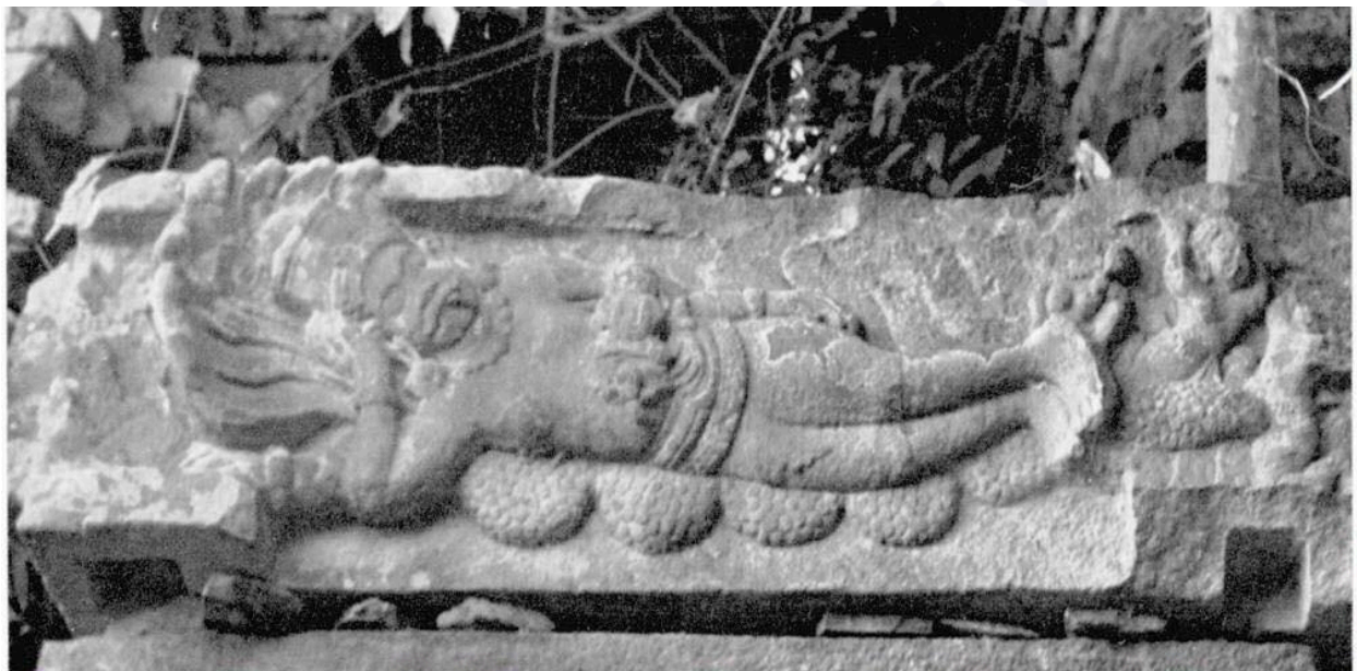
រូបលេខ៧៖ ផ្តែរទ្វាររកឃើញនៅតំបន់ប្រាសាទសំបូរព្រៃគុក (ដកស្រង់ពីសៀវភៅលោកស្រី Mireille Benisti, 1974)