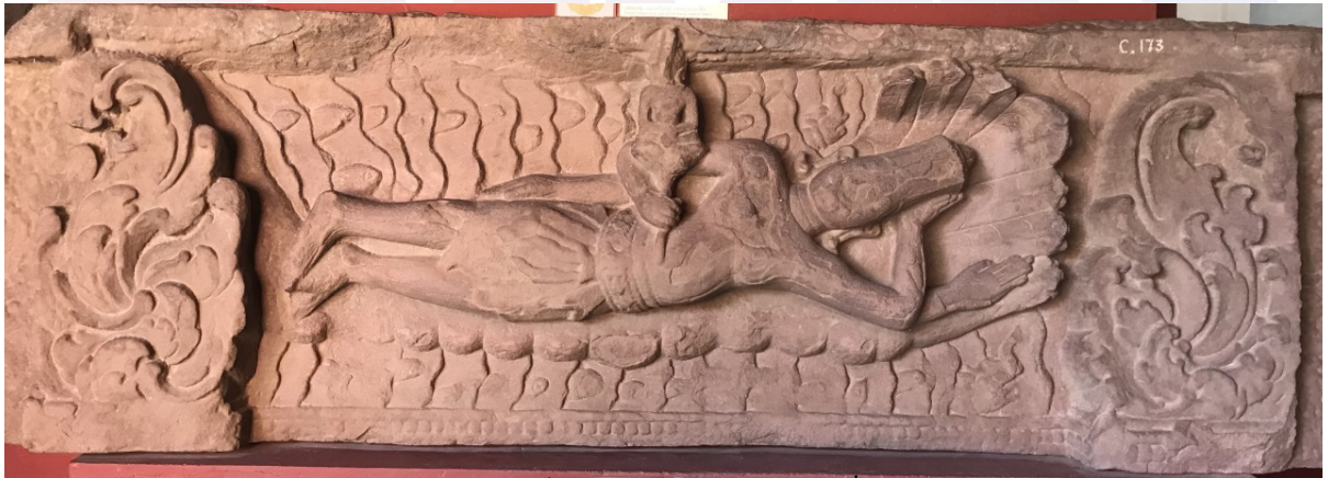
រូបទី៣៖ ផ្តែរទ្វារនៅទួលអង្គ (កំពង់ស្ពឺ)