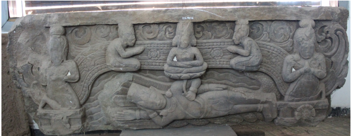
រូបទី៥៖ ផ្តែរទ្វាររកឃើញនៅស្រុកអូររាំងឌី ខេត្តត្បូងឃ្មុំ