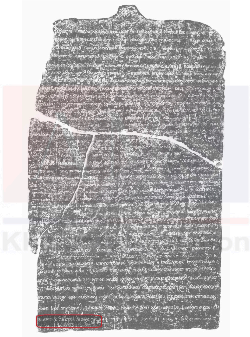
សិលាចារឹក K. 362 មានប្បា «នេះគ្រោកនេះគឹមនីស្រសិវិនុកម្មជាក្សរ»