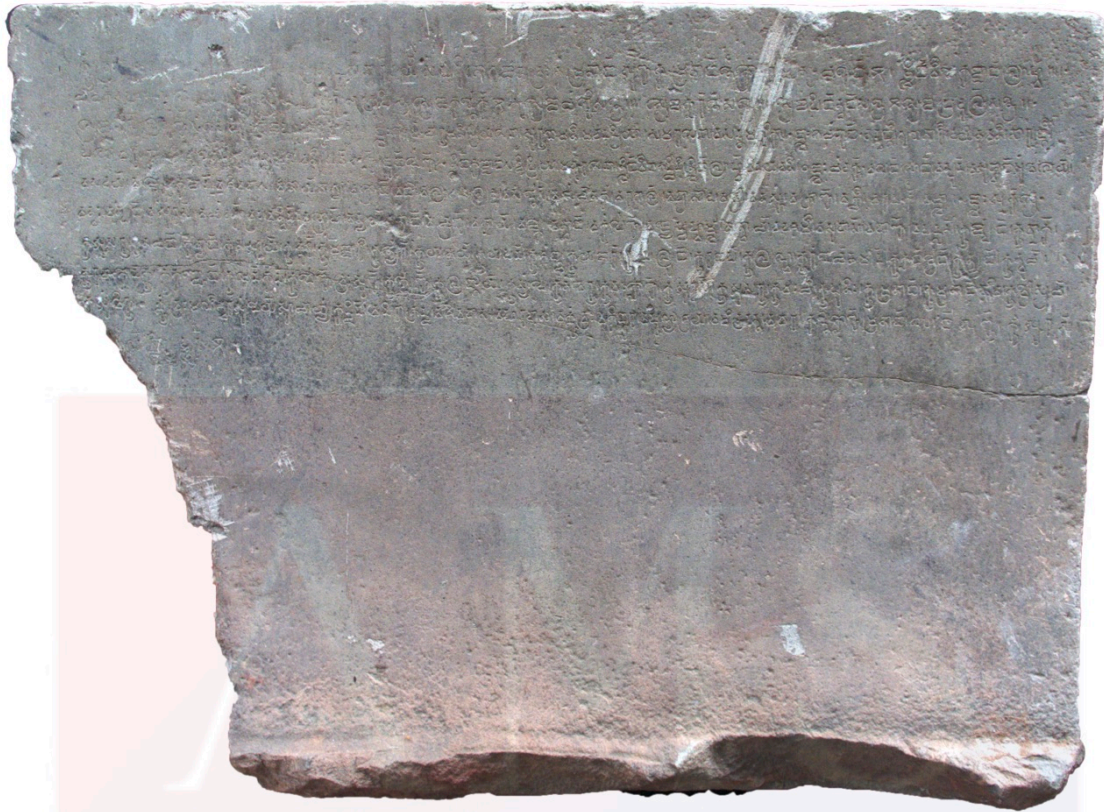
សិលាចារឹកទួលវត្តគំនូរ K.600