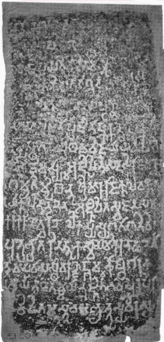
សិលាចារឹកក្បូកាញ់

នៅរដ្ឋអាស៊ីអាគ្នេយ៍បុរាណទាំងដីគោក និងដីកោះ (ខ្មែរ មន ចាម្ប៍ និងជ្វា) យើងពុំ ឃើញមានតិកតាងអក្សរកត់ត្រា មុនមានឥទ្ធិពលពីឥណ្ឌានោះឡើយ។ ក្រៅពីឥទ្ធិពលផ្នែក សាសនា របៀបគ្រប់គ្រងរដ្ឋ សិល្បៈ ស្ថាបត្យកម្ម... រដ្ឋទាំងនោះក៏ទទួលឥទ្ធិពលអក្សរ ទាំងស្រុងពីឥណ្ឌាផងដែរ។ អ្នកស្រាវជ្រាវបានរកឃើញថា អក្សរខ្មែរ និងអក្សររដ្ឋអាស៊ីអា គ្នេយ៍បុរាណដទៃទៀតមានប្រភពមកពីឥណ្ឌាកាត់ខាងត្បូង គឺប្រភេទអក្សរដំបូងឈ្មោះ ថា "ព្រាហ្មី" នៅសម័យ "បល្លវៈ" (និយមហៅថាអក្សរបល្លវៈ) និង "ចាលុក្យៈ"។