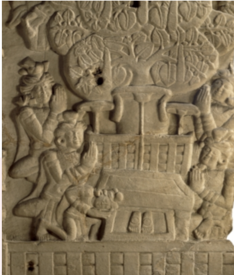
រូបលេខ៖ ការលំទោនគោរពព្រះពុទ្ធបាទ និងការគោរពរូបតំណាងផ្សេងៗរបស់ព្រះពុទ្ធ (ចម្លាក់ក្រឡាតទាបមកពីចេតិយនៅសាន់ឈី)