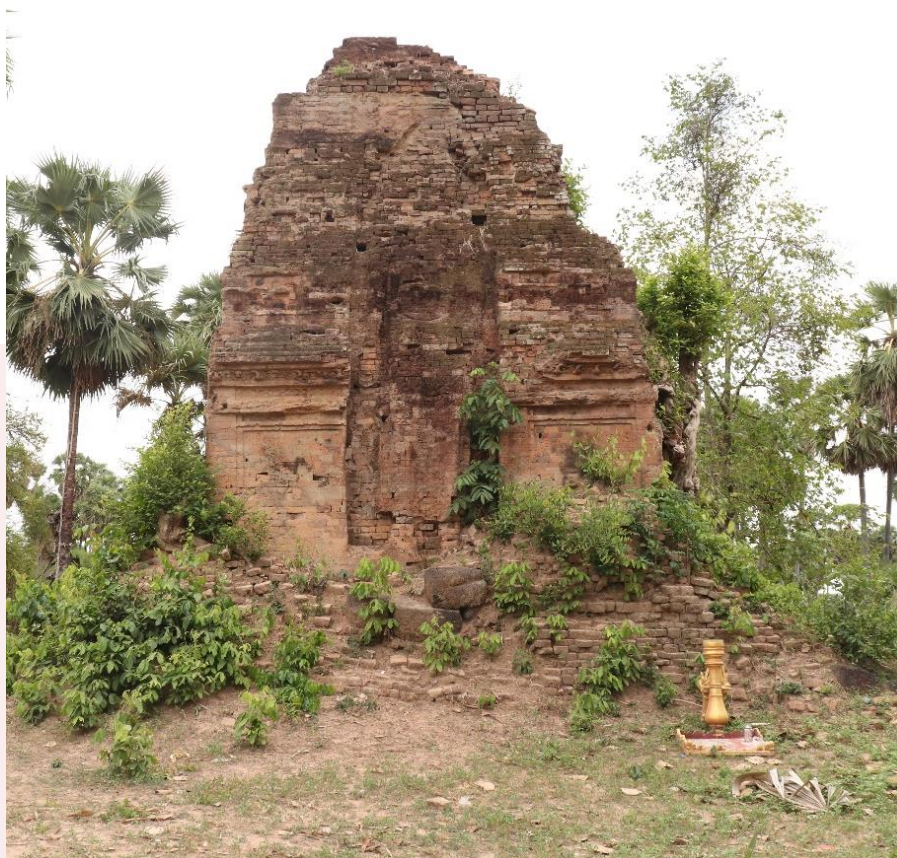
រូបទី២៖ គុកជើង (មើលពីមុខខាងត្បូង)