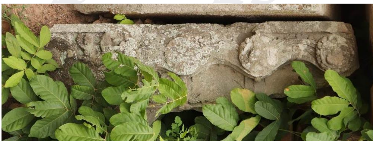
រូបទី៣៖ ផ្តែរទ្វារខាងកើតដែលជ្រុះចុះមកក្រោម