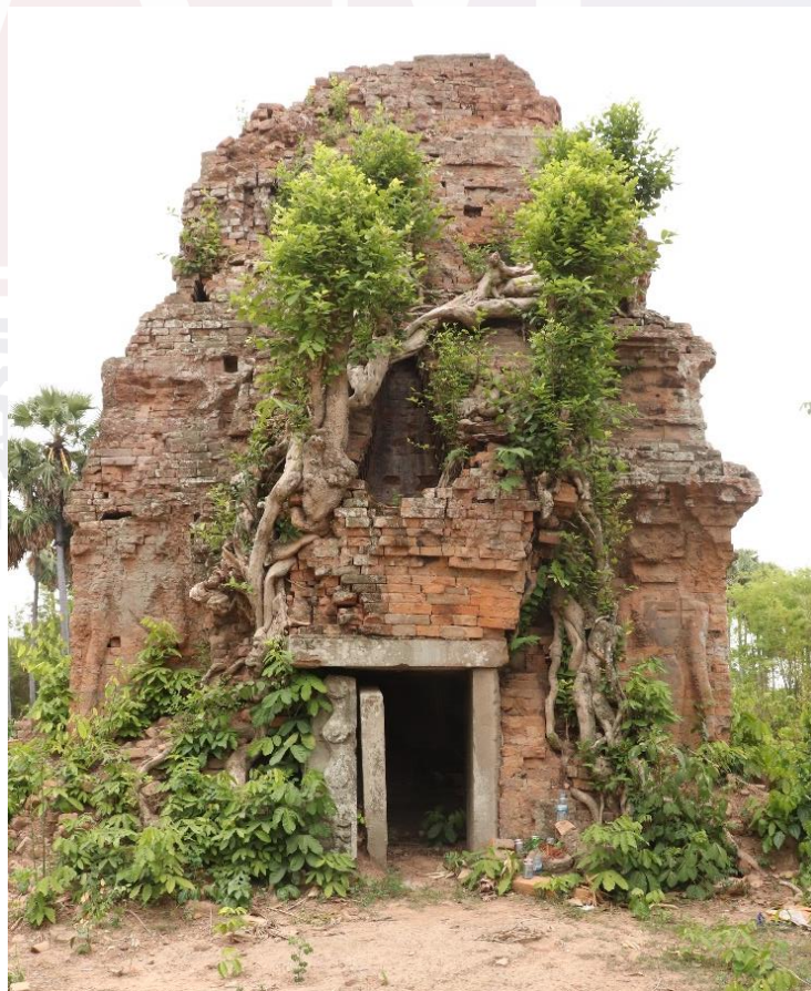
រូបទី១៖ គុកជើង (មើលពីមុខខាងកើត)

1989, Nouvelles inscriptions du Cambodge I , traduites et éditées par, École Française d'Extrême-Orient, Paris