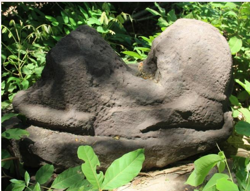
រូបទី៥៖ បដិមាគោរកឃើញនៅខាងមុខប្រាសាទ