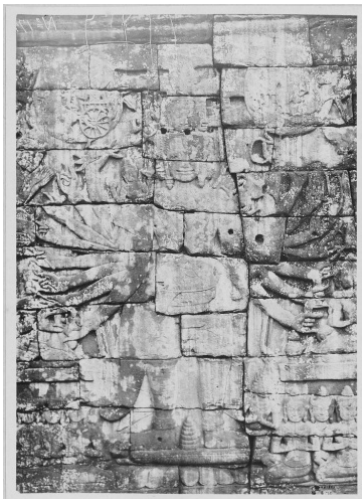
រូបលេខ៥ ព្រះអាទិត្យនិងព្រះចន្ទ្រកើតចេញពីអវលោកិតិស្វរៈ (បន្ទាយឆ្មារ)