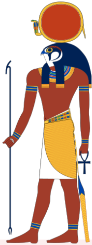
រូបលេខ១ គំនូរទេពព្រះអាទិត្យ (Ra) ក្នុងវប្បធម៌អេហ្ស៊ីប