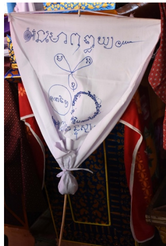
រូបលេខ៥ ព្រះអាទិត្យនិងព្រះចន្ទ្រក្នុងទង់ព្រលឹង