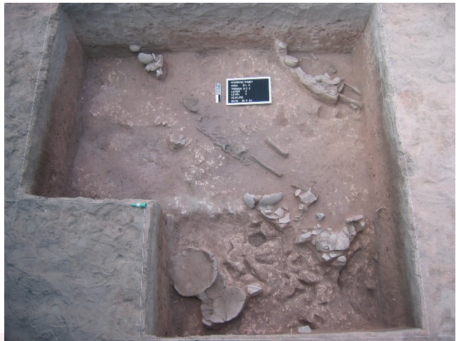
រូបលេខ២ ការកប់សពបែរទៅទិសព្រះអាទិត្យលិច (ភូមិក្រសាំងថ្មី)