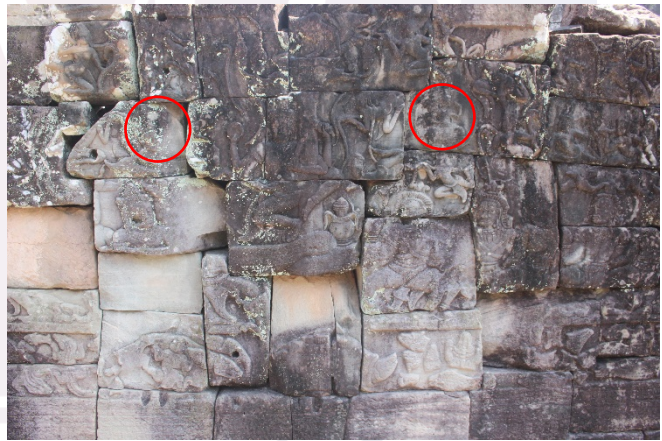
រូបលេខ៤ ព្រះអាទិត្យនិងព្រះចន្ទ្រកើតចេញពីកូរសមុទ្រទឹកដោះ (បាយ័ន)