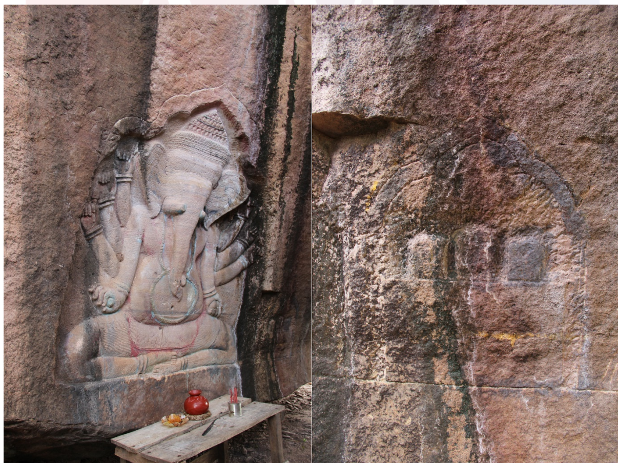
រូបលេខ២ រូបលេខ៣