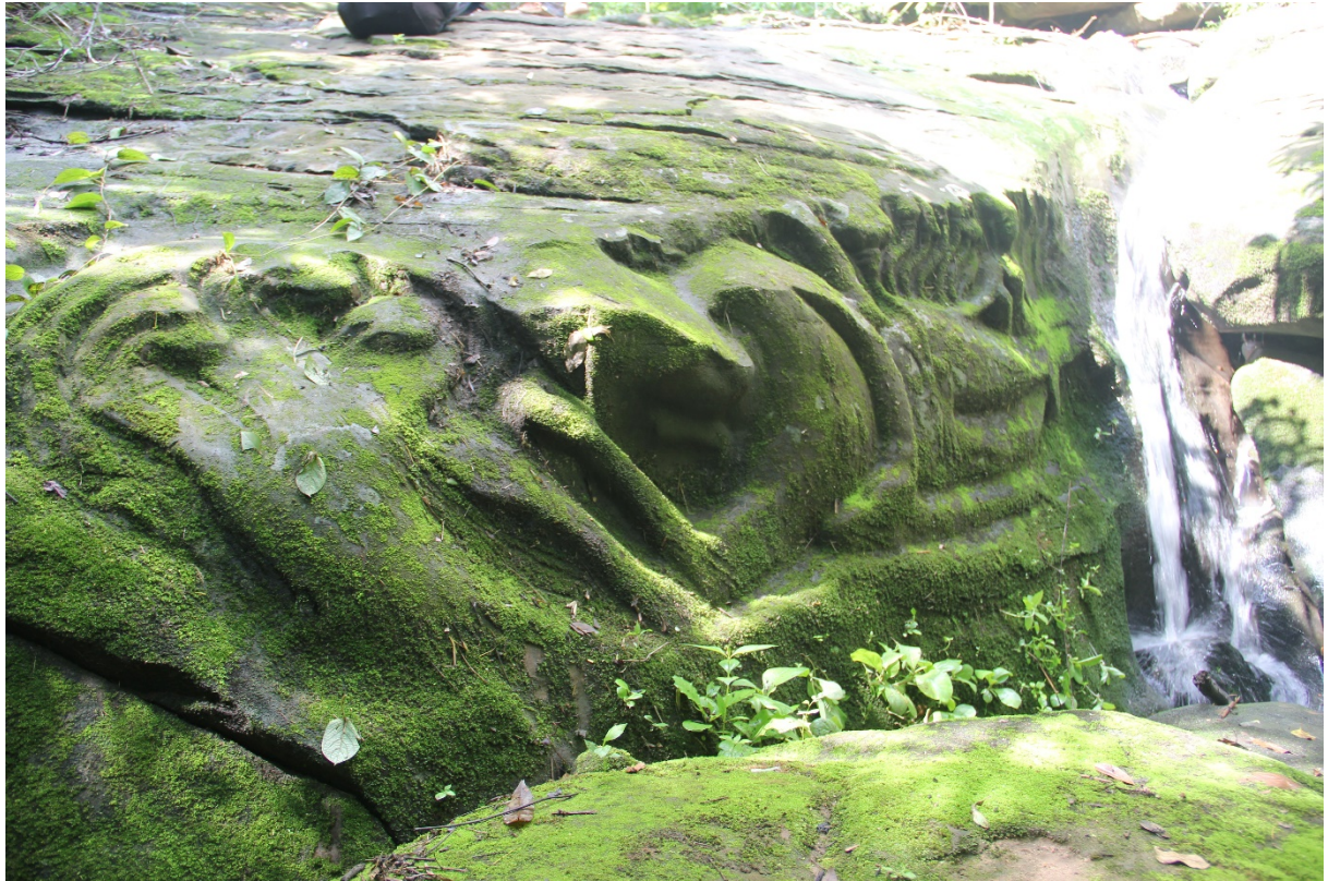
រូបលេខ១០