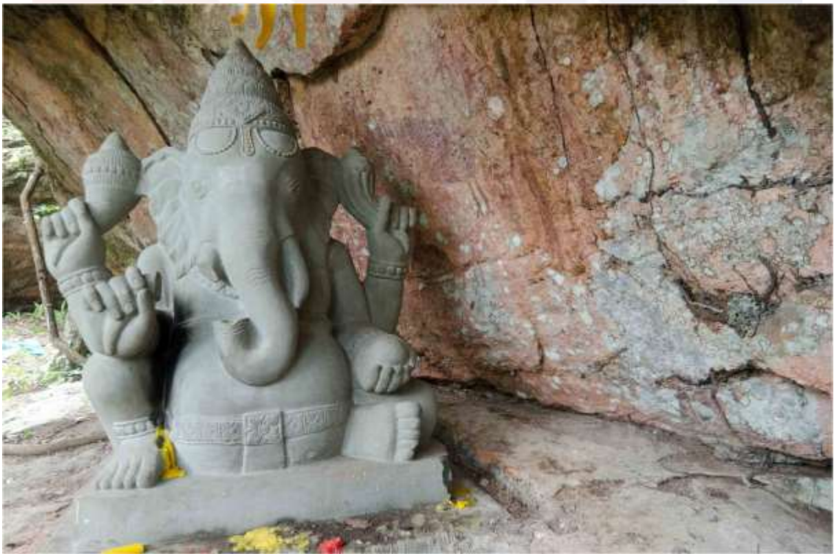
រូបលេខ២ គំនូរលើជញ្ជាំងថ្ម