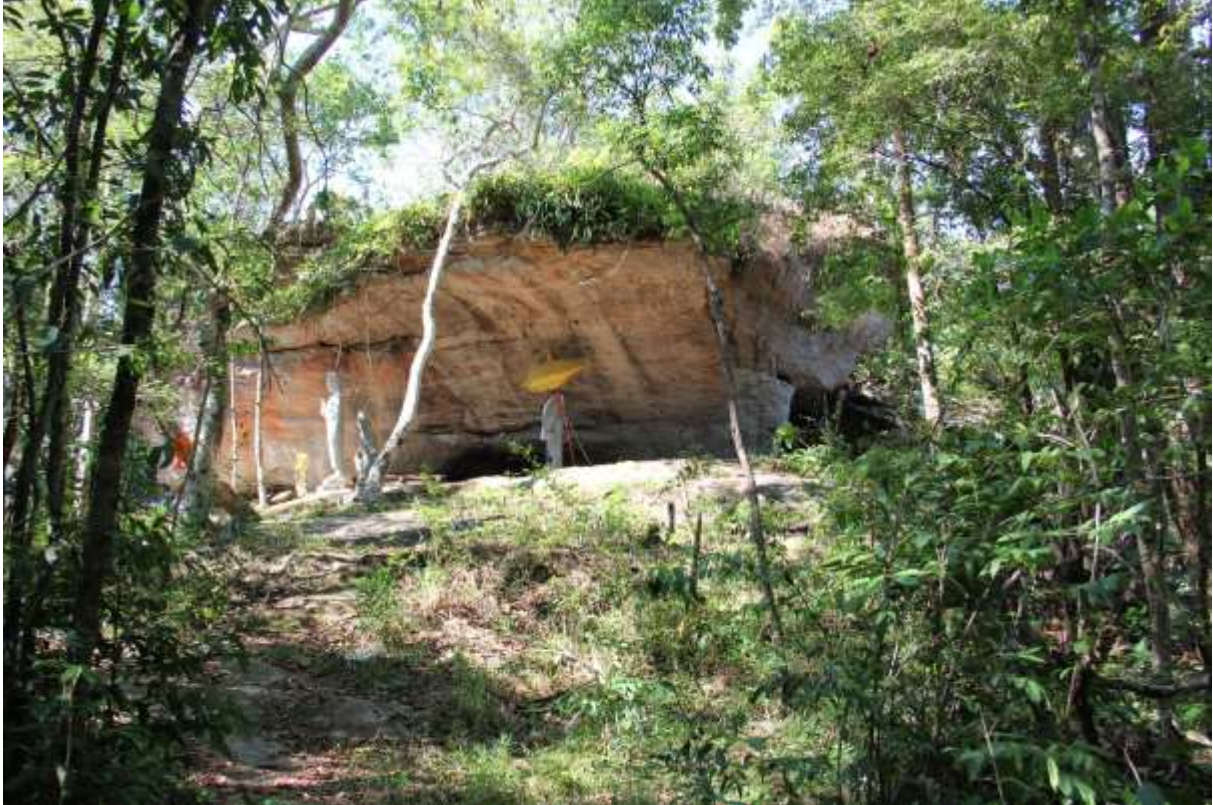
រូបលេខ១ ពើងតាខាប