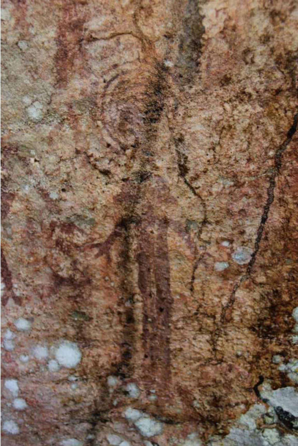
រូបលេខ៣ គំនូរមនុស្ស