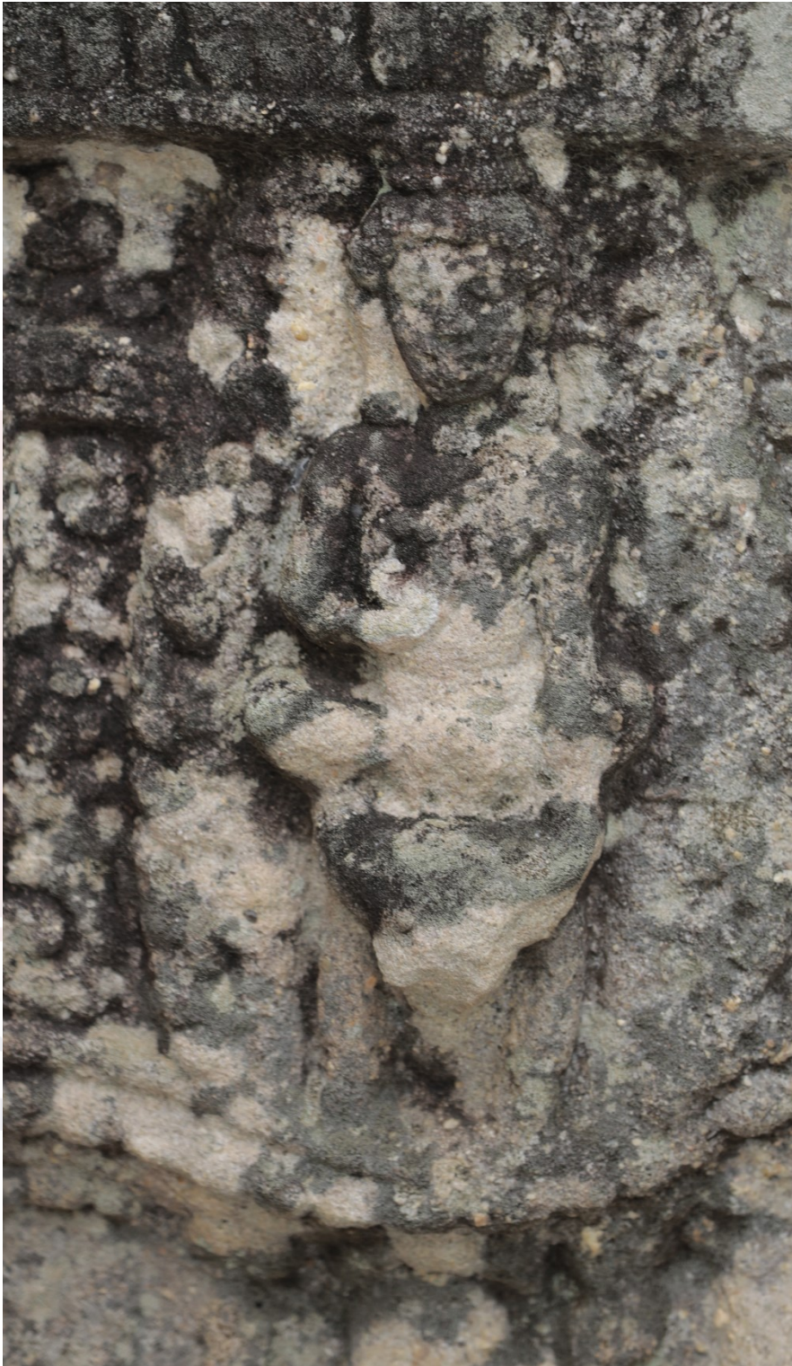
រូបលេខ៧៩៖ ចម្លាក់ព្រះយម នៅប្រាសាទភ្នំព្រះបាទ