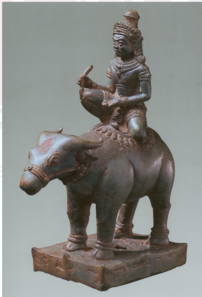
រូបលេខ៦៖ ចម្លាក់បដិមាព្រះយមធ្វើពីលោហៈ