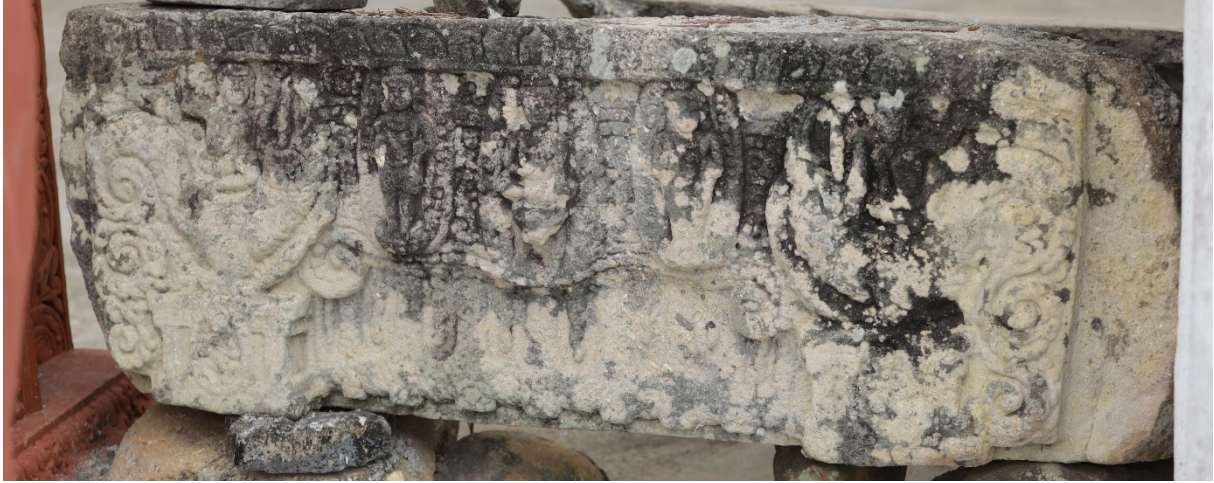
រូបលេខ៧៖ ផ្តែរទ្វារប្រាសាទភ្នំព្រះបាទ ខេត្តកំពង់ចាម