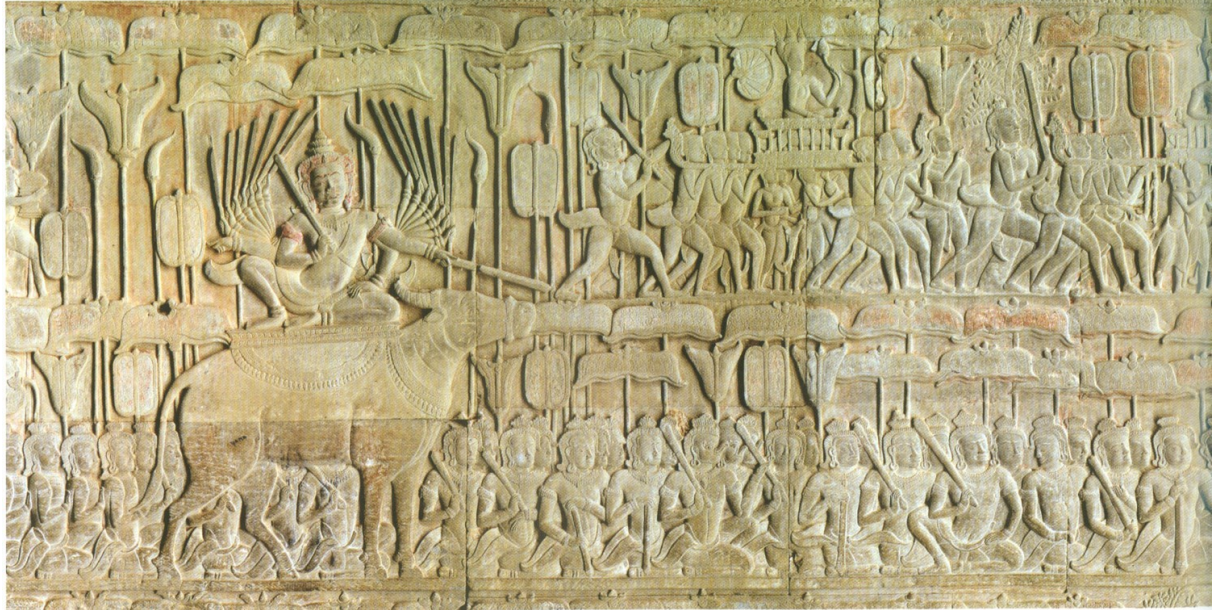
រូបលេខ៥៖ ចម្លាក់ព្រះយមជិះលើក្របី នៅជញ្ជាំងប្រាសាទអង្គរវត្ត