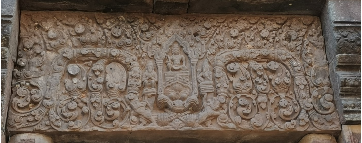
រូបលេខ១១៖ ចម្លាក់បង្ហាញព្រះយម និងសេនាកត់ត្រានៅលើផ្តែរព្រះសាទរត្តកូ