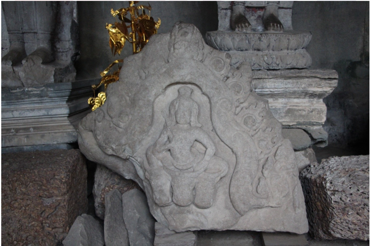
រូបលេខ៤៖ ចម្លាក់ព្រះយមជិះលើក្របី (កញ្ចាំងនៅប្រាសាទអង្គរវត្ត)