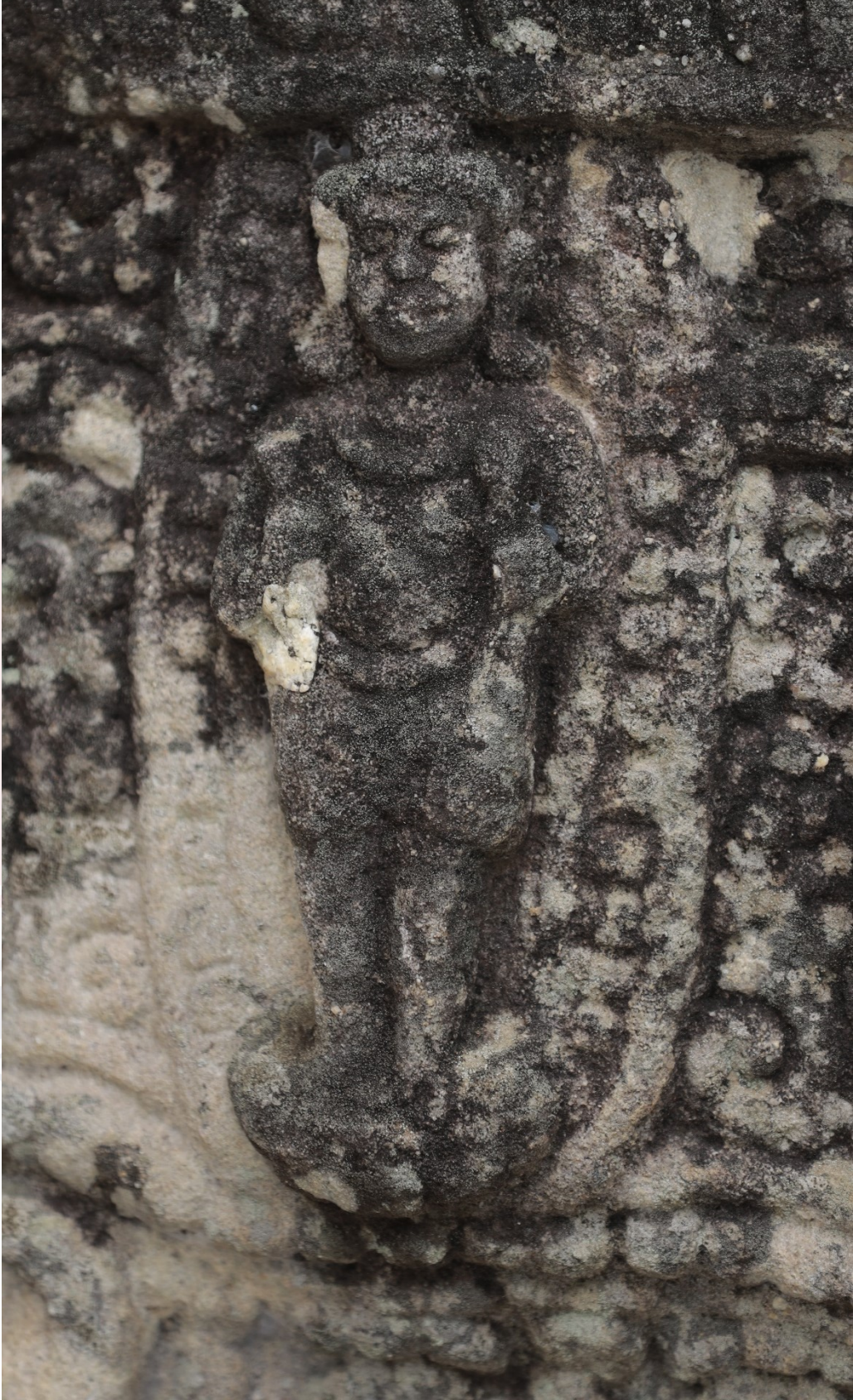
រូបលេខ១០៖ ចម្លាក់សេនាភត់ត្រារបស់ព្រះយម (ចិត្រគុហ្ម) នៅប្រាសាទភ្នំព្រះបាទ