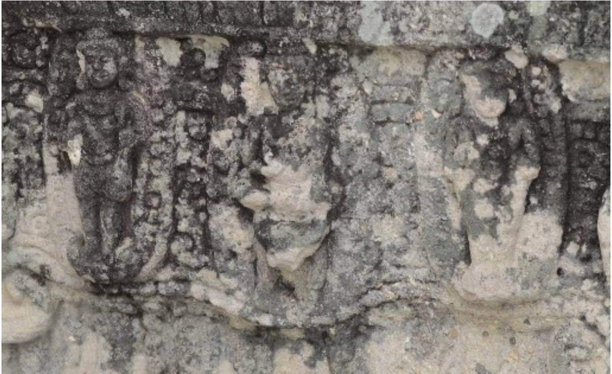
រូបលេខ៨៖ ចម្លាក់បង្ហាញព្រះយម និងសេនាកត់ត្រា (ចិត្រគុប្ប) នៅប្រាសាទភ្នំព្រះបាទ