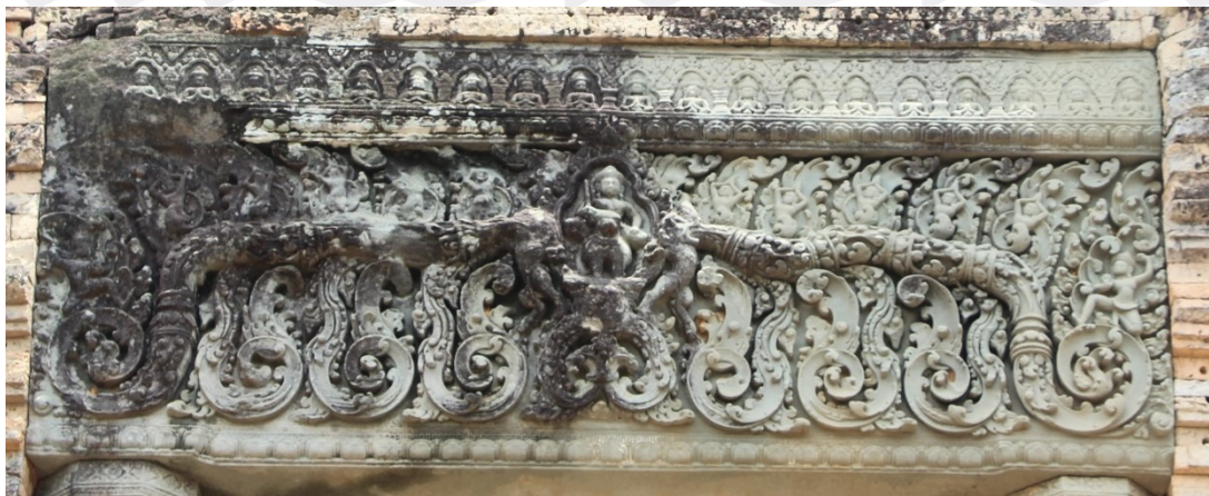
រូបលេខ២៖ ចម្លាក់បង្ហាញព្រះយមជិះលើក្របីនៅលើផ្តែរព្រាសាទមេបុណ្យខាងកើត