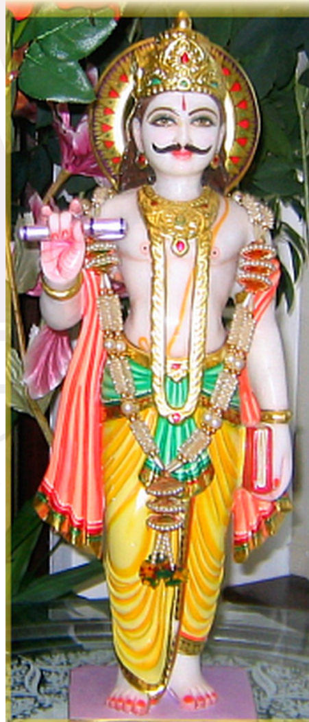
រូបលេខ១២-១៣៖ ព្រះចិត្រគុបត្តនៅសិល្បៈសៀម និងឥណ្ឌា