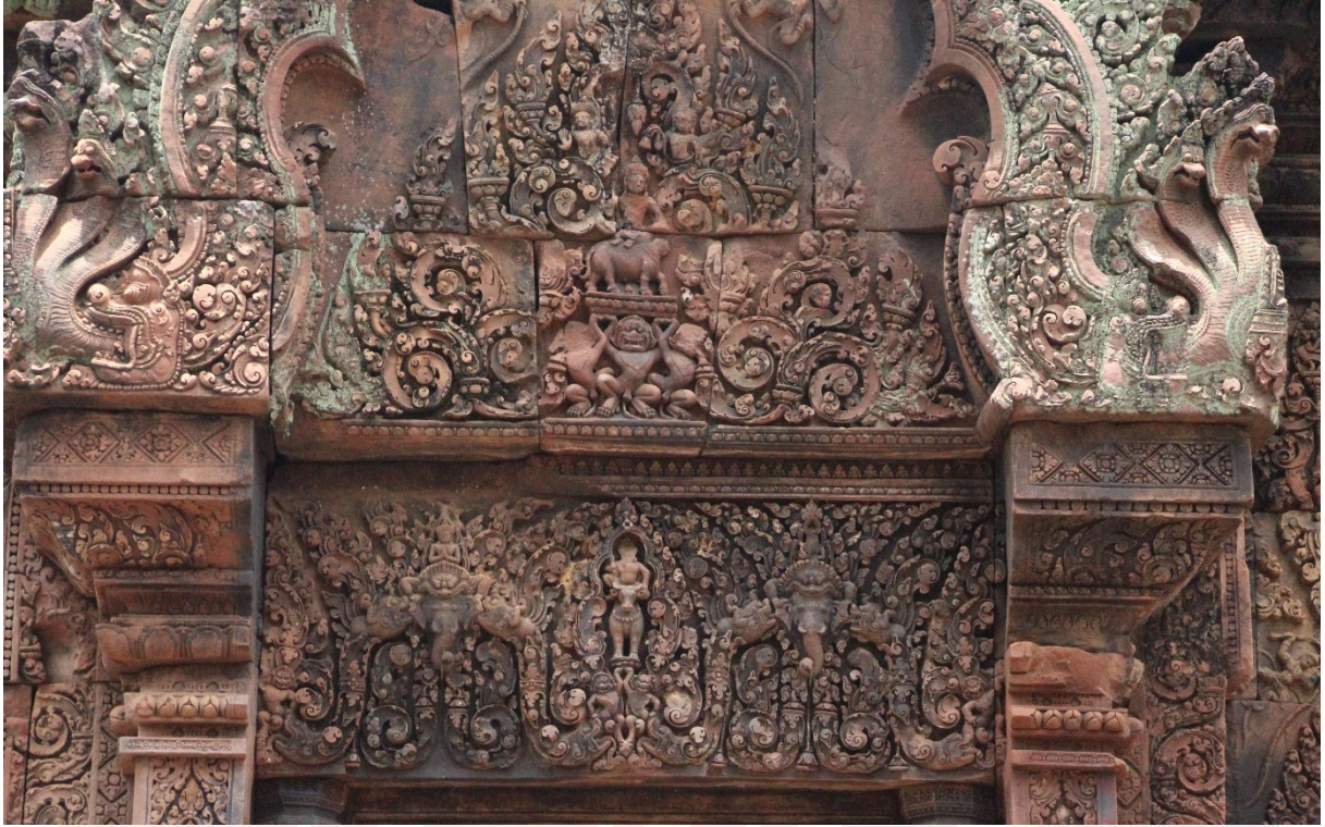
រូបលេខ៣៖ ចម្លាក់បង្ហាញព្រះយមជិះនៅលើក្របីនៅលើហោជាងនិងផ្តែរទ្វារប្រាសាទបន្ទាយស្រី