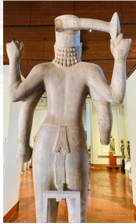
រូបលេខ៣-៤៖ បដិមាព្រះវិស្ណុទួលដៃបួន ដាក់តាំងនៅសារមន្ទីរជាតិកម្ពុជា (មើលពីមុខ-ក្រោយ) អត្ថបទដោយ៖ ម៉ង់ វ៉ាលី