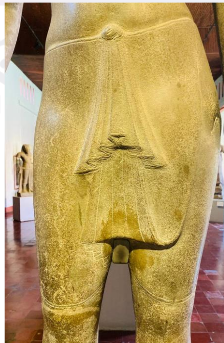
រូបលេខ៧-៨៖ លម្អិតដងខ្លួន និងសំពត់បដិមាព្រះវិស្ណុទួលដៃបួន