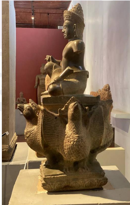
រូបលេខ ៥ - ៨៖ បដិមាព្រះវរុណ មើលពីគ្រប់មុខទាំងបួន (ថតឆ្នាំ២០២៤ សារមន្ទីរជាតិកម្ពុជា)