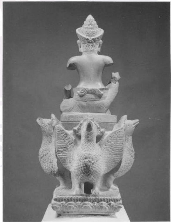
រូបលេខ៣ និងលេខ៤៖ បដិមាព្រះវរុណមើលពីមុខនិងក្រោយ (ថតឆ្នាំ១៩៦២)