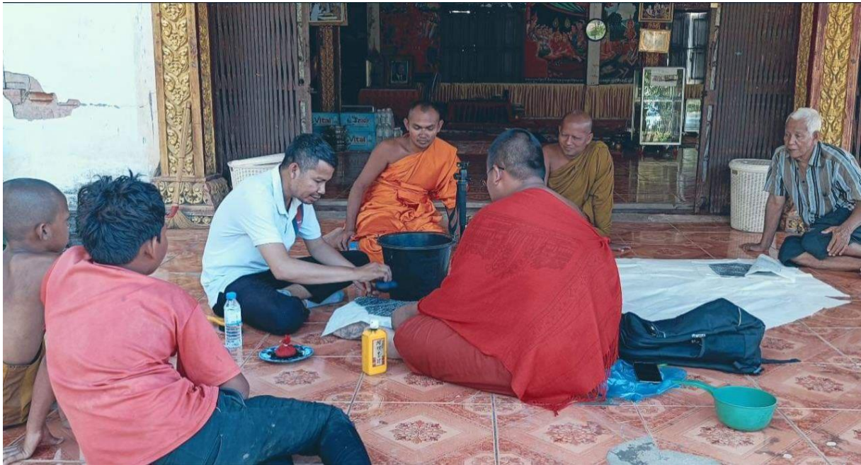
រូបលេខ១៖ ការចុះផ្ចិតសិលាចារឹកទួលម្លេស នៅវត្តពន្លៃ ខេត្តបាត់ដំបង