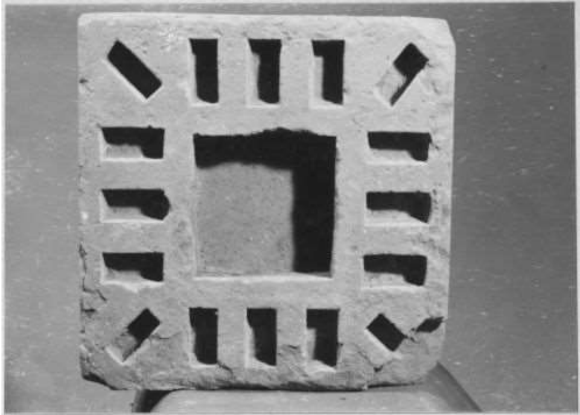
រូបលេខ៤៖ ថ្មបញ្ចុះនៅប្រាសាទព្រះគោ