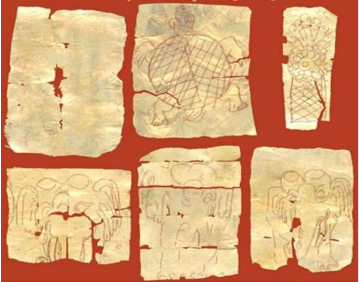
រូបលេខ១១៖ សន្លឹកមាសដែលមានចាររូបសត្វនាគ ដំរី អណ្តើកនៅប្រាសាទគោកតាស៊ាន

ធ្វើកិច្ចពិធីប្រុងពាលី និងបញ្ចុះបឋមសិលា (ឬដំបូង) នៅក្រោមគ្រឹះជាមុនសិន ហើយបន្ទាប់ពីសាងសង់រួចទើបគេធ្វើពិធីបញ្ចុះសីមានៅតាមទិសទាំង៨ និងសីមាកិល នៅចំកណ្តាលព្រះវិហារ។ ដោយឡែក ការសាងសង់លំនៅដ្ឋានក៏មិនសូវខុសគ្នាប៉ុន្មានដែរ ពោលគឺជួនកាលគេមានបញ្ចុះមាសស្រួយ ឬមាសសន្លឹក ឬគ្រឿងអលង្ការនៅក្រោមបាតសសរកន្លែង ក្នុងជំនឿថាលំនៅដ្ឋាននោះនឹងពោរពេញដោយសេចក្តីសុខ រីកចម្រើន គង់វង្ស រឹងមាំ។