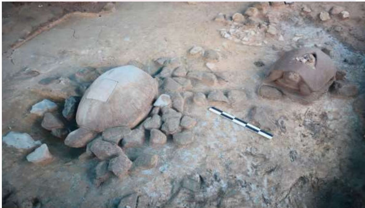
រូបលេខ៣៖ រូបអណ្តើកធំនិងតូចមើលពីជ្រុងភ្នំសាន

រូបលេខ២៖ អណ្តើកសំណារនៅព្រះលានដល់ជំរី