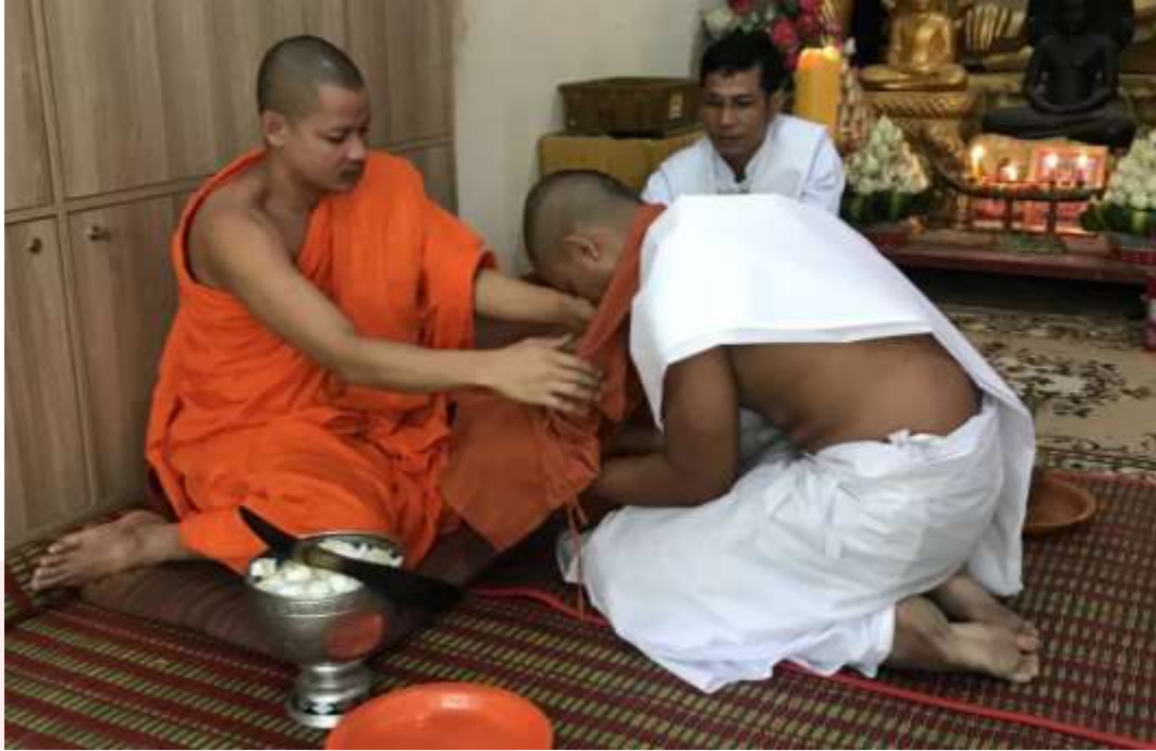
រូបលេខ២ ការបូសមុខភ្លើង សង្ក្រាន្តព្រលឹងអ្នកស្លាប់