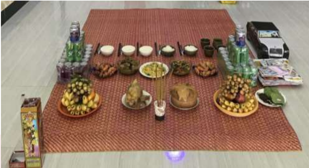
រូបលេខ១ គ្រឿងសំណែនដល់ព្រលឹងដូនតា ឬអ្នកស្លាប់។