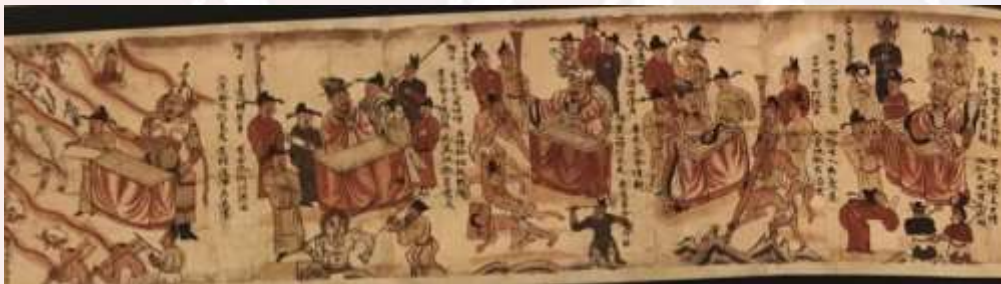
រូបលេខ២ ការរៀបចំចាត់ចែងព្រលឹងនៅស្ថាននរក