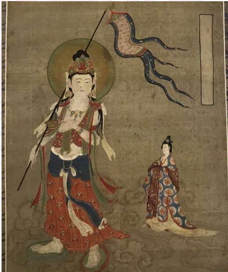
រូបលេខ៥ ព្រះលោកេស្វរ ដឹកនាំព្រលឹង និងសង្ក្រាន្តព្រលឹងអ្នកស្លាប់