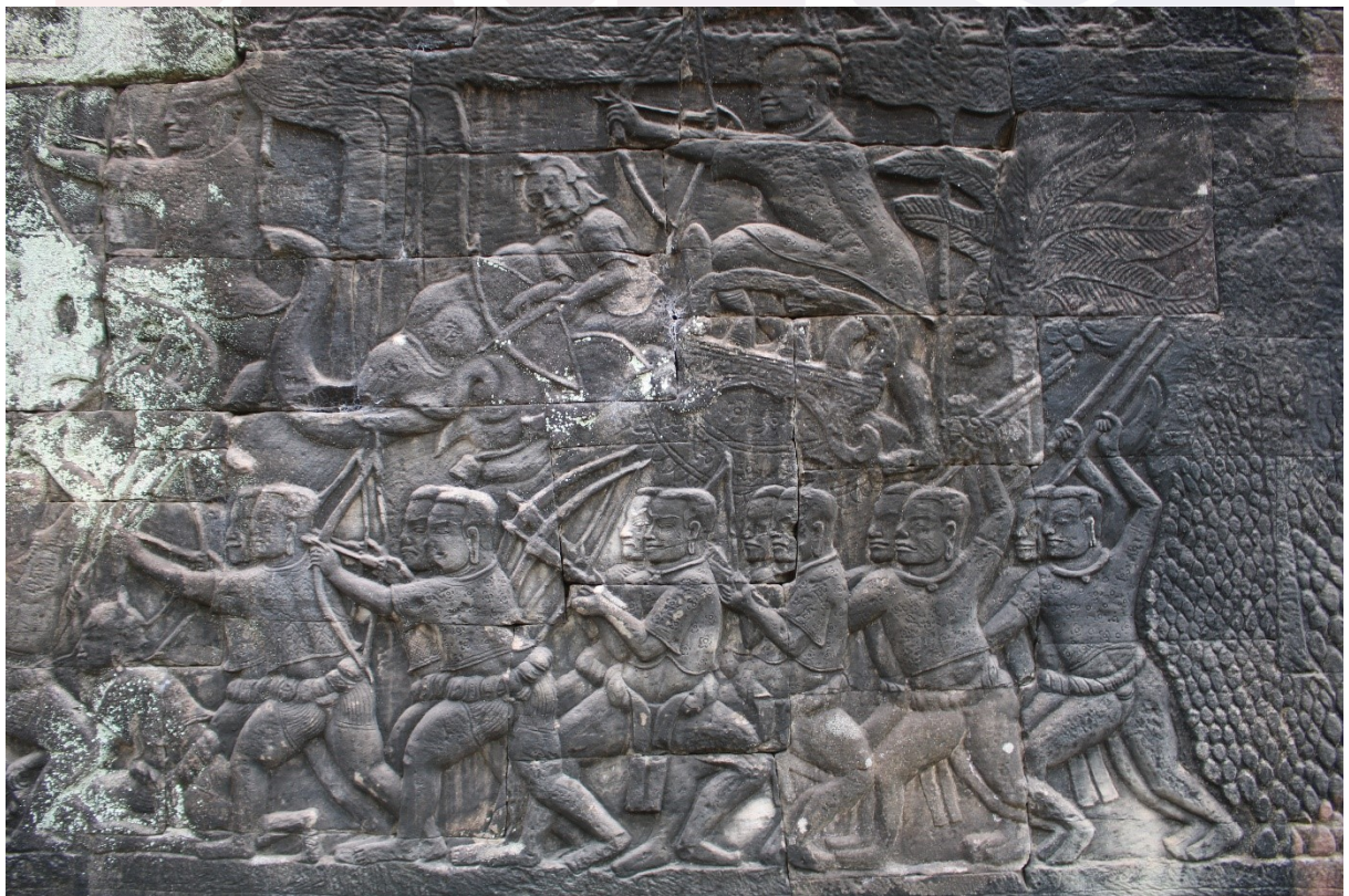
រូបលេខ២៖ ចម្លាក់បង្ហាញកងទ័ពនៅជញ្ជាំងប្រាសាទបាយ័ន្ត