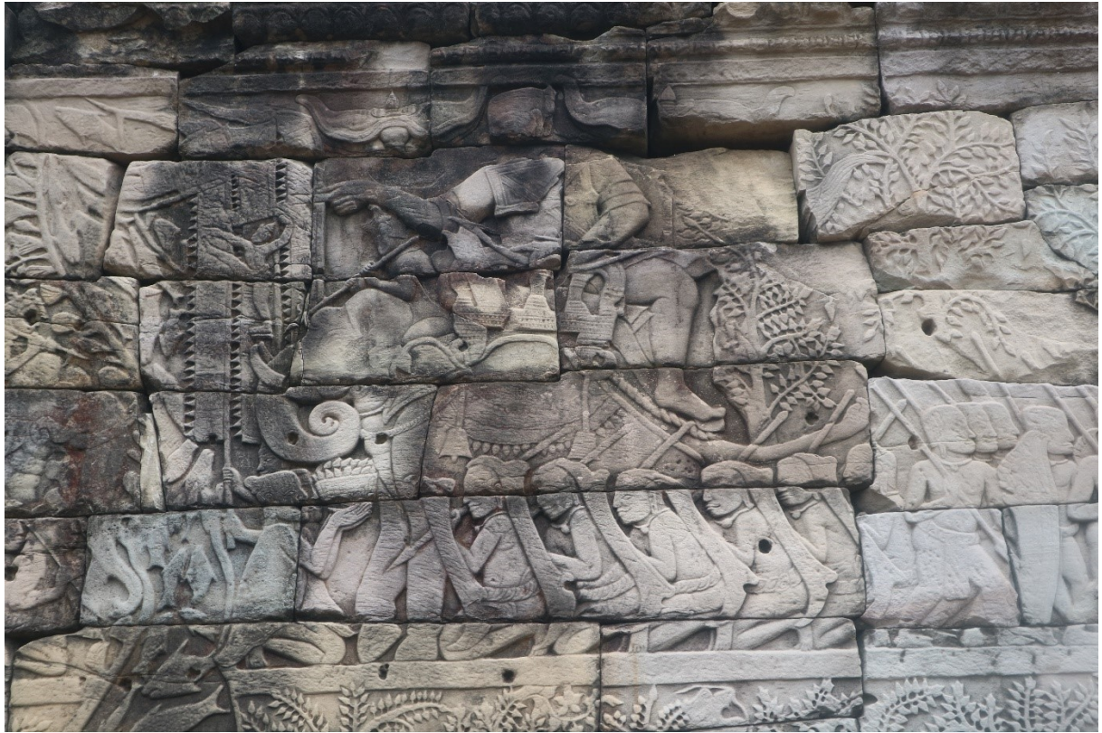
រូបលេខ១៖ ចម្លាក់បង្ហាញកងទ័ពនៅជញ្ជាំងប្រាសាទបន្ទាយច្នាវ