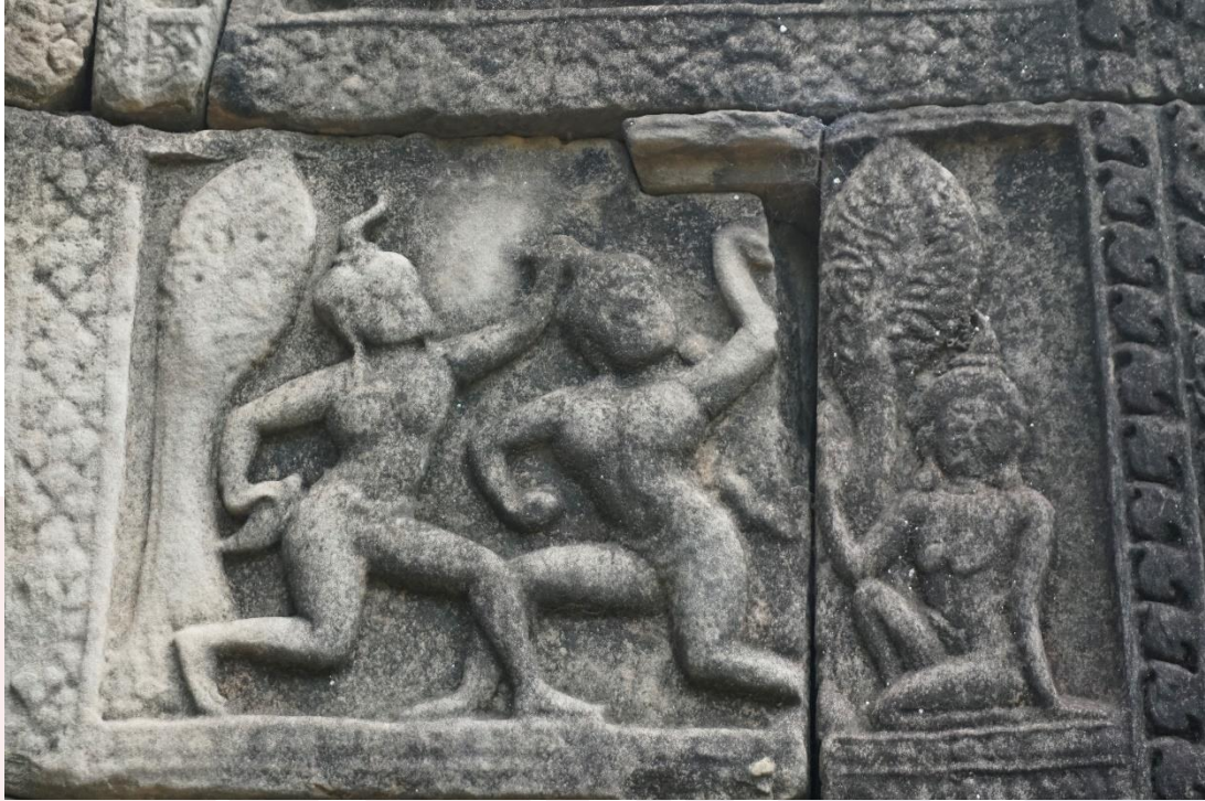
រូបលេខ៣៖ ចម្លាក់បង្ហាញអំពីសុន្ទ និងឧបសុន្ទប្រយុទ្ធគ្នាដណ្តើមនាងតិលោត្តមានៅជញ្ជាំងប្រាសាទបាគួន តំបន់អង្គរ