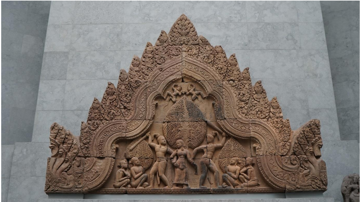
រូបលេខ១៖ ចម្លាក់បង្ហាញអំពីសុន្ទ និងឧបសុន្ទប្រយុទ្ធគ្នាដណ្តើមនាងតិលោត្តមានៅហោជាង ប្រាសាទបន្ទាយស្រី ((សព្វថ្ងៃរក្សាទុកនៅសារមន្ទីរហ្គីមេត ប្រទេសបារាំង)