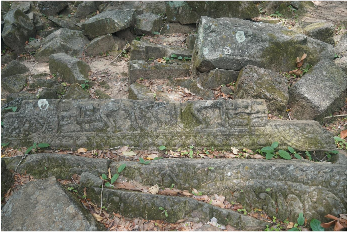
រូបលេខ២៖ ប្រហែលចម្លាក់បង្ហាញអំពីសុន្ទ និងឧបសុន្ទប្រយុទ្ធគ្នាដណ្តើមនាងតិលោត្តមានៅ ហោជាងប្រាសាទធំ តំបន់កោះកេរ