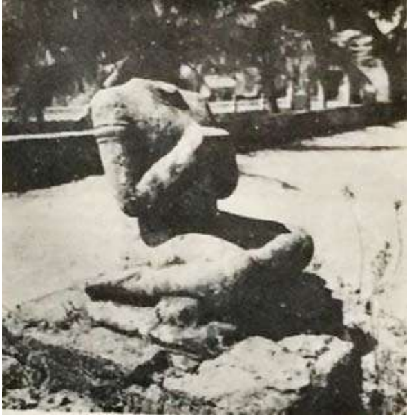
រូបលេខ២៖ រូបទេពប្រណម្យអំពីថ្មភក់ខាងមុខព្រះ វិហារឆ្នាំ១៩០៩