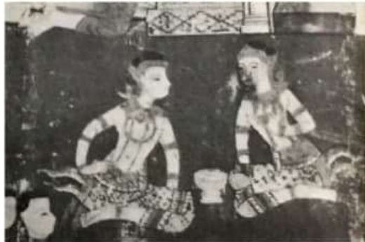
រូបលេខ១៖ រូបថតចាស់នៃព្រះវិហារ និងរូបគំនូរឆ្នាំ១៩០៩ (ប្រភព៖ GITEAU ១៩៦៣)