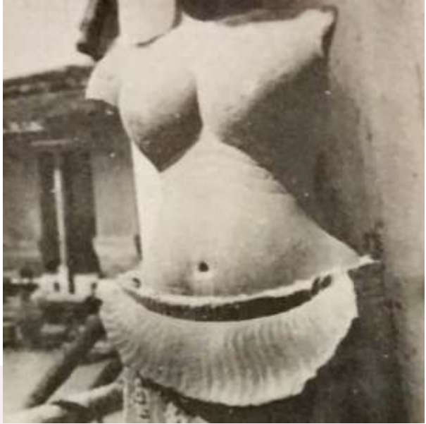
រូបលេខ៣៖ រូបទេពស្រី