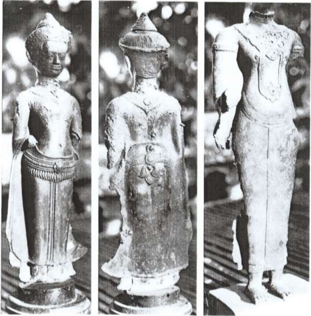
រូបលេខ៥ និង ៦ ៖ ព្រះពុទ្ធរូប