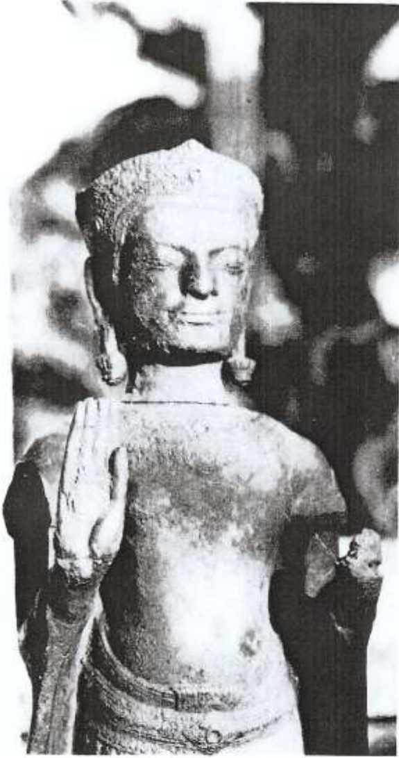
— 6 —