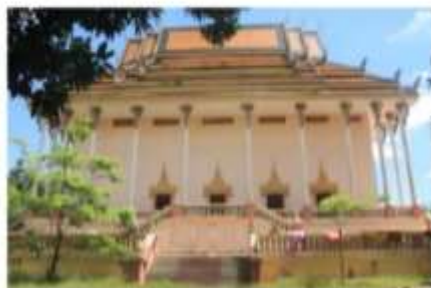
រូបលេខ៤៖ ព្រះវិហារបច្ចុប្បន្ន ថតឆ្នាំ ២០២០