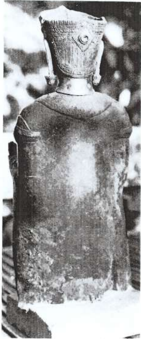
— 7 —