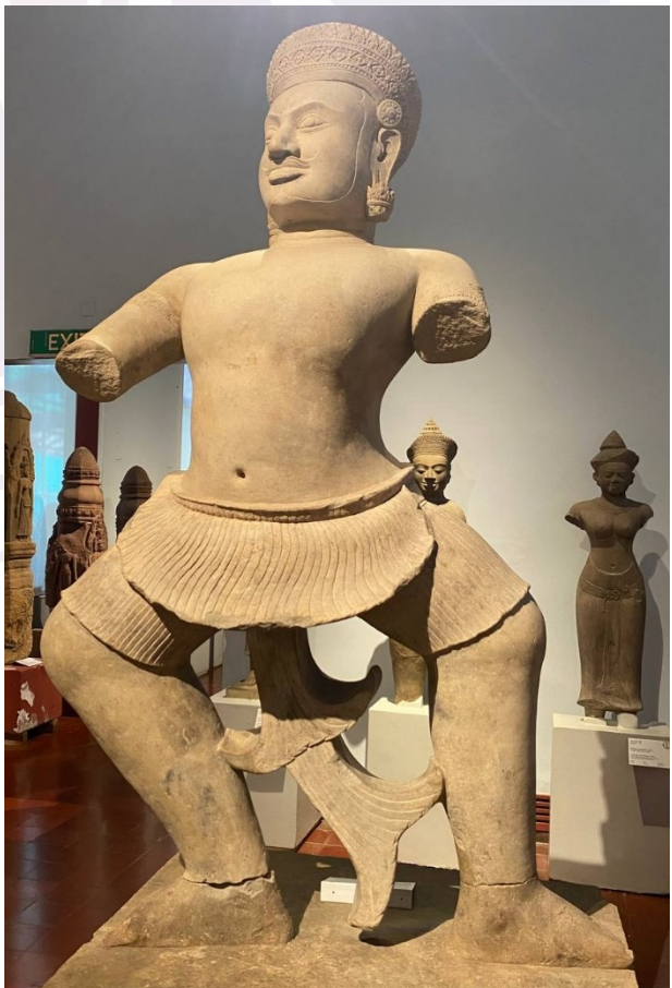
រូបលេខ៣៖ បដិមាអ្នកចម្បាំងទុយ៉ោធន ប្រាសាទចិន