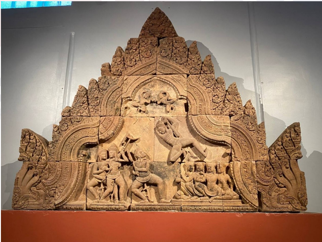
រូបលេខ៩៖ ចម្លាក់ហោជាងបង្ហាញអំពីឈុតសង្គ្រាមគុរុក្សេត្រនៃរឿងមហាការតមកពី ប្រាសាទបន្ទាយស្រី ស.វ.ទី១០