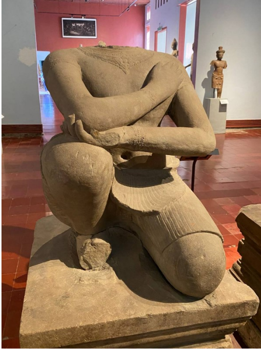
រូបលេខ៤៖ បដិមាអជ្ជន ប្រាសាទចិន