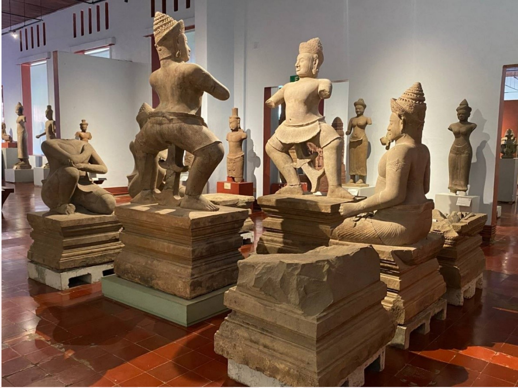
រូបលេខ៨៖ បដិមាចំនួន ៥ បង្ហាញអំពីឈុតសង្គ្រាមគុរុក្សេត្រនៃរឿងមហាការតមកពី ប្រាសាទចិន ដាក់តាំងបង្ហាញផ្គុំគ្នានៅសារមន្ទីរជាតិកម្ពុជា