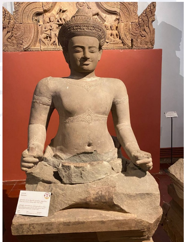
រូបលេខ៧៖ បដិមាពលរាម ប្រាសាទចិន