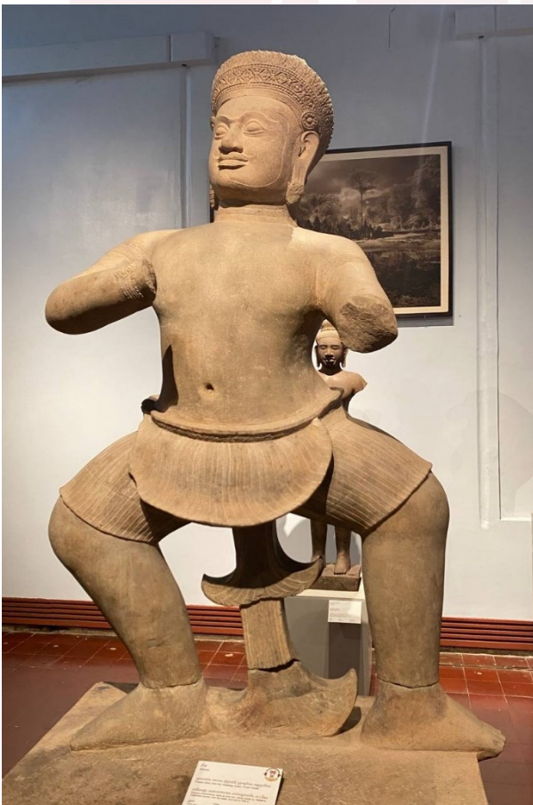
រូបលេខ២៖ បដិមាអ្នកចម្បាំងភីម ប្រាសាទចិន