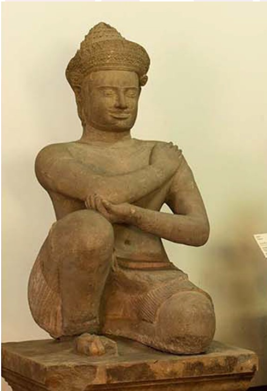
រូបលេខ៦៖ បដិមាណកុល ប្រាសាទចិន