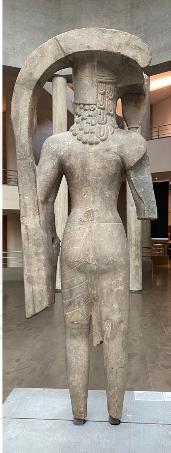
រូបលេខ១-២៖ បដិមាហរិហរមកពីភ្នំដា ស្រុកអង្គរបុរី មើលពីមុខនិងពីក្រោយ (សព្វថ្ងៃទុកនៅសារមន្ទីរជាតិហ្គីមេ ប្រទេសបារាំង)