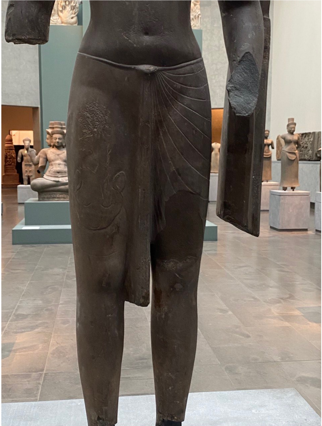
រូបលេខ៤៖ លម្អិតផ្នែកសំពត់បដិមាហរិហរមកពីភ្នំដា ស្រុកអង្គរបុរី (សព្វថ្ងៃទុកនៅសារមន្ទីរជាតិហ្គីមេ ប្រទេសបារាំង)