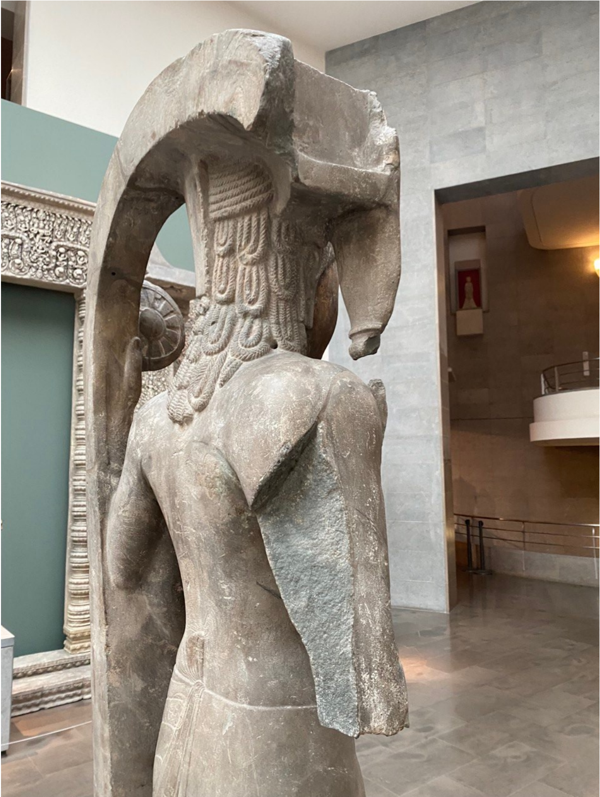
រូបលេខ៦៖ លម្អិតព្រះហស្តដែលបាក់បែក នៃបដិមាហរិហរមកពីភ្នំដា ស្រុកអង្គរបុរី (សព្វថ្ងៃទុកនៅសារមន្ទីរជាតិហ្គីមេ ប្រទេសបារាំង)