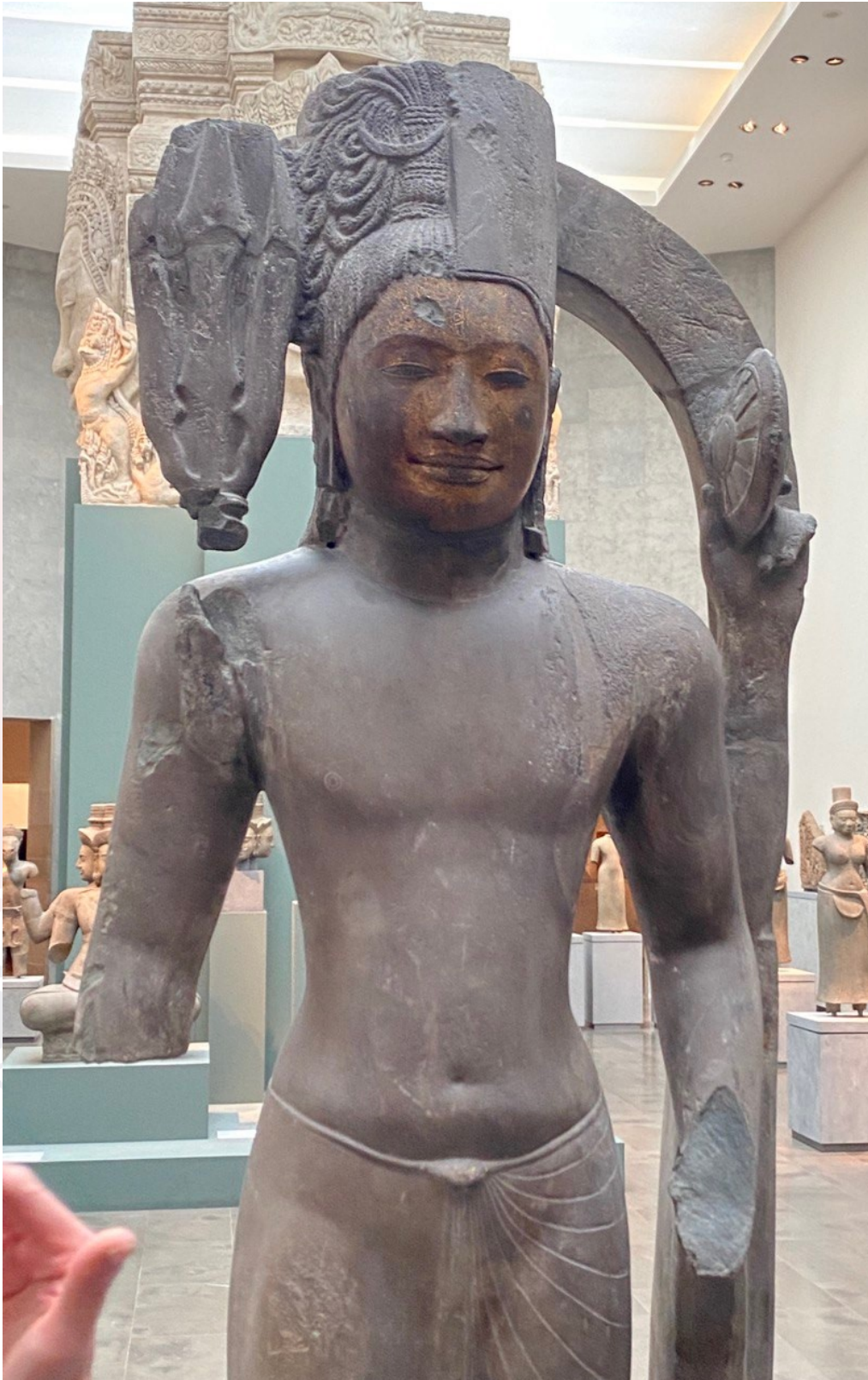
រូបលេខ៣៖ លម្អិតបដិមាហរិហរមកពីភ្នំដា ស្រុកអង្គរបុរី ផ្នែកខាងមុខមួយកំណាត់ខាងលើ (សព្វថ្ងៃទុកនៅសារមន្ទីរជាតិហ្គីមេ ប្រទេសបារាំង)