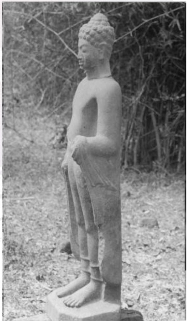
រូបលេខ១២៖ ព្រះពុទ្ធរូបរកឃើញនៅទួលព្រះធាតុ ខេត្តកំពង់ស្ពឺ នៅទីតាំងដើម ថតឆ្នាំ១៩៣៥