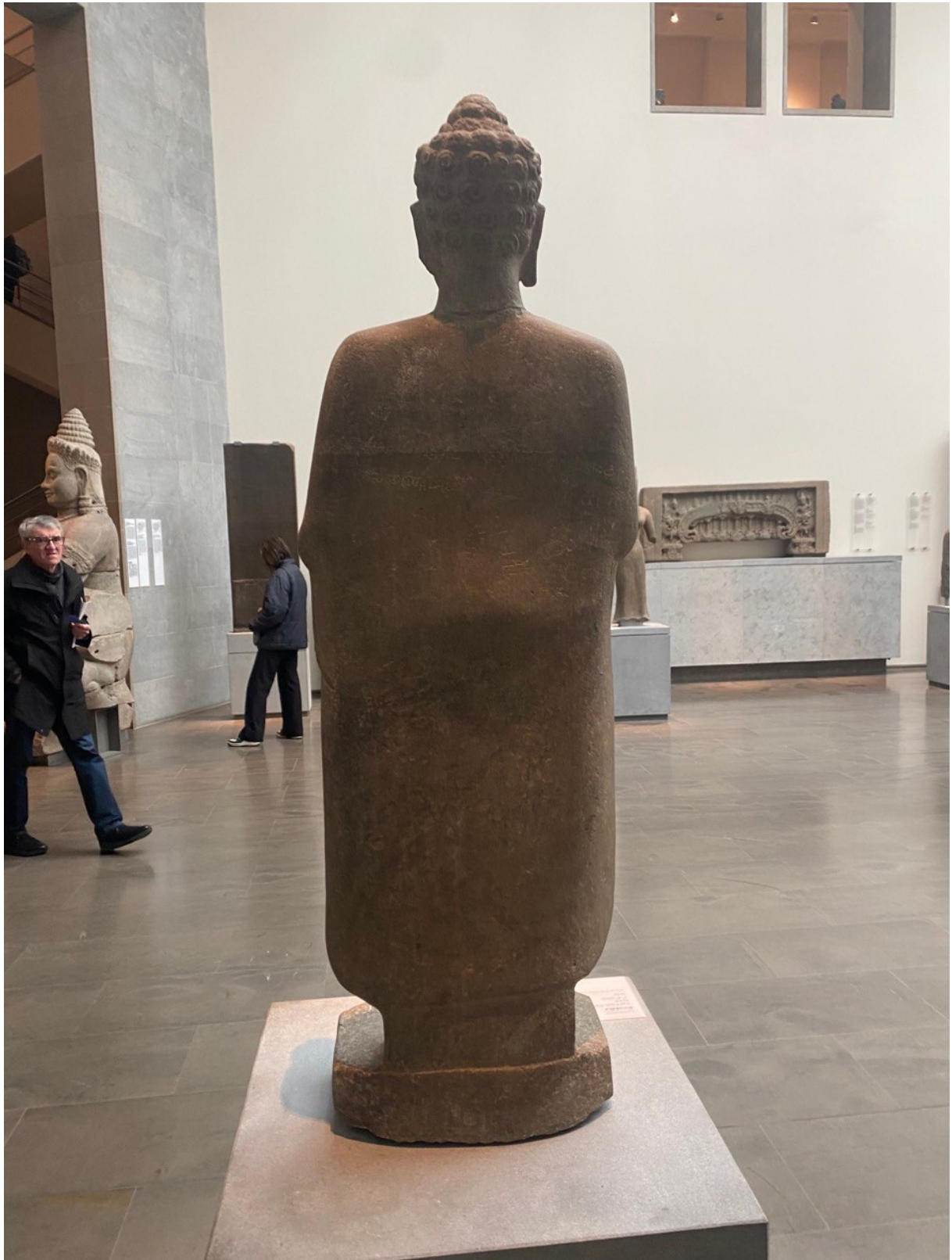
រូបលេខ៧៖ ព្រះពុទ្ធរូបរកឃើញនៅទួលព្រះធាតុ ខេត្តកំពង់ស្ពឺ តាំងនៅសារមន្ទីរជាតិហ្គីមេត ប្រទេសបារាំង (មើលពីមុខខាងក្រោយចំ)