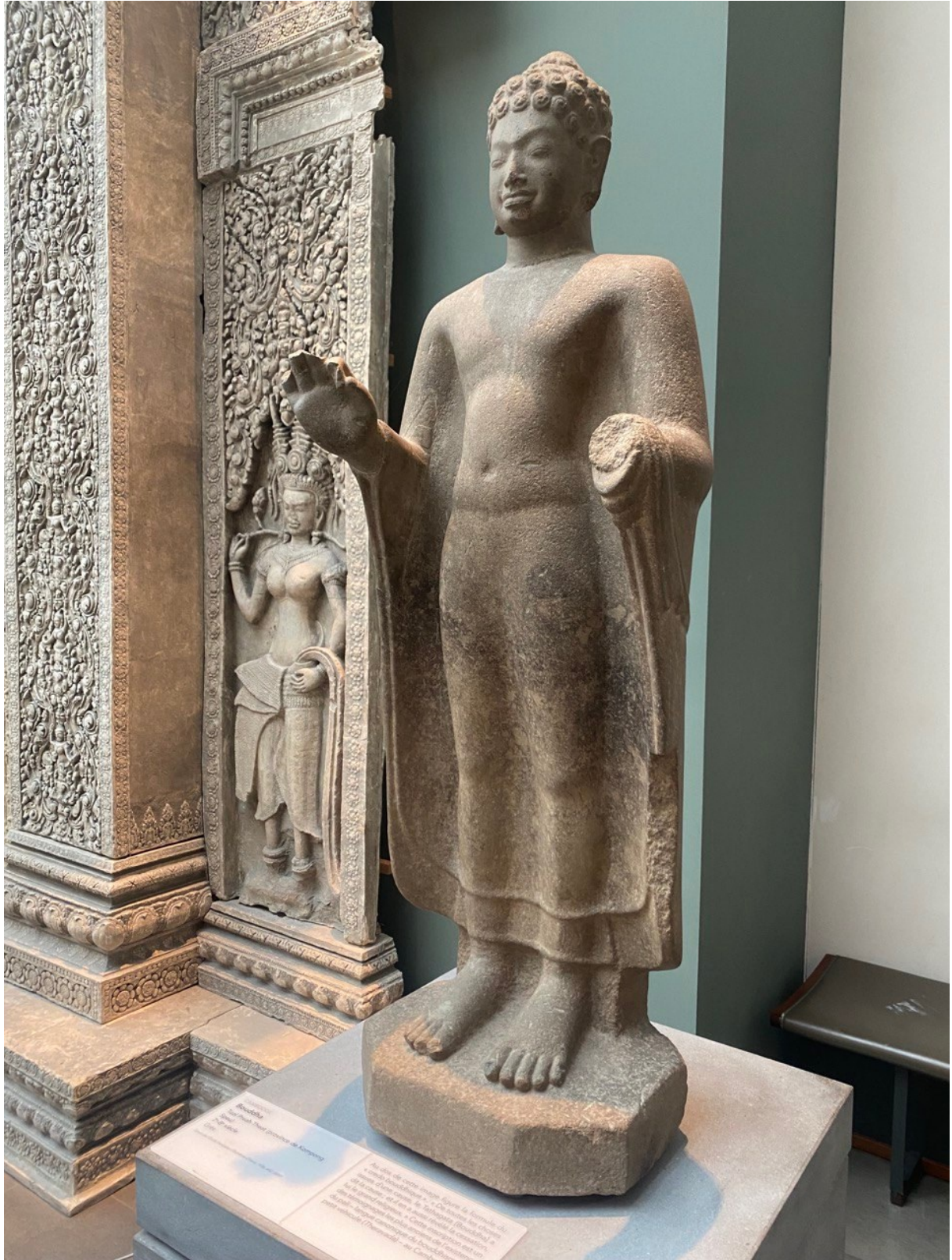
រូបលេខ៤៖ ព្រះពុទ្ធរូបរកឃើញនៅទួលព្រះធាតុ ខេត្តកំពង់ស្ពឺ តាំងនៅសារមន្ទីរជាតិហ្គីមេត ប្រទេសបារាំង (មើលពីចំហៀងខាងឆ្វេង)