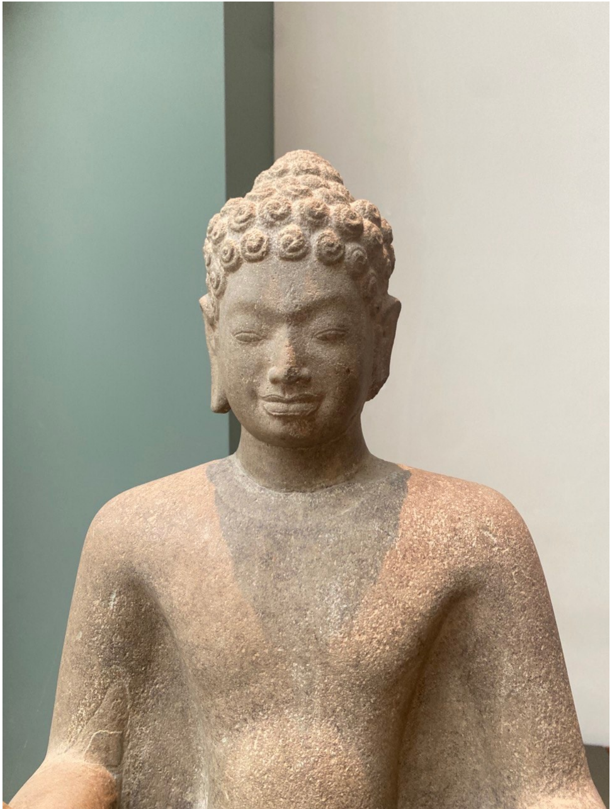
រូបលេខ៦៖ ព្រះពុទ្ធរូបរកឃើញនៅទួលព្រះធាតុ ខេត្តកំពង់ស្ពឺ តាំងនៅសារមន្ទីរជាតិហ្គីមេត ប្រទេសបារាំង (មើលពីលម្អិតកំណាត់ខ្លួនឡើងលើ)