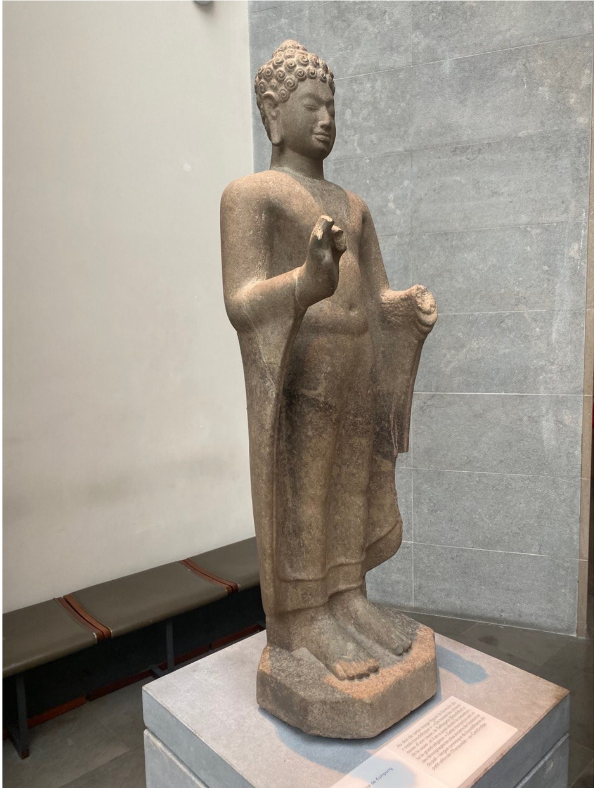
រូបលេខ៥៖ ព្រះពុទ្ធរូបរកឃើញនៅទួលព្រះធាតុ ខេត្តកំពង់ស្ពឺ តាំងនៅសារមន្ទីរជាតិហ្គីមេត ប្រទេសបារាំង (មើលពីចំហៀងខាងស្តាំ)