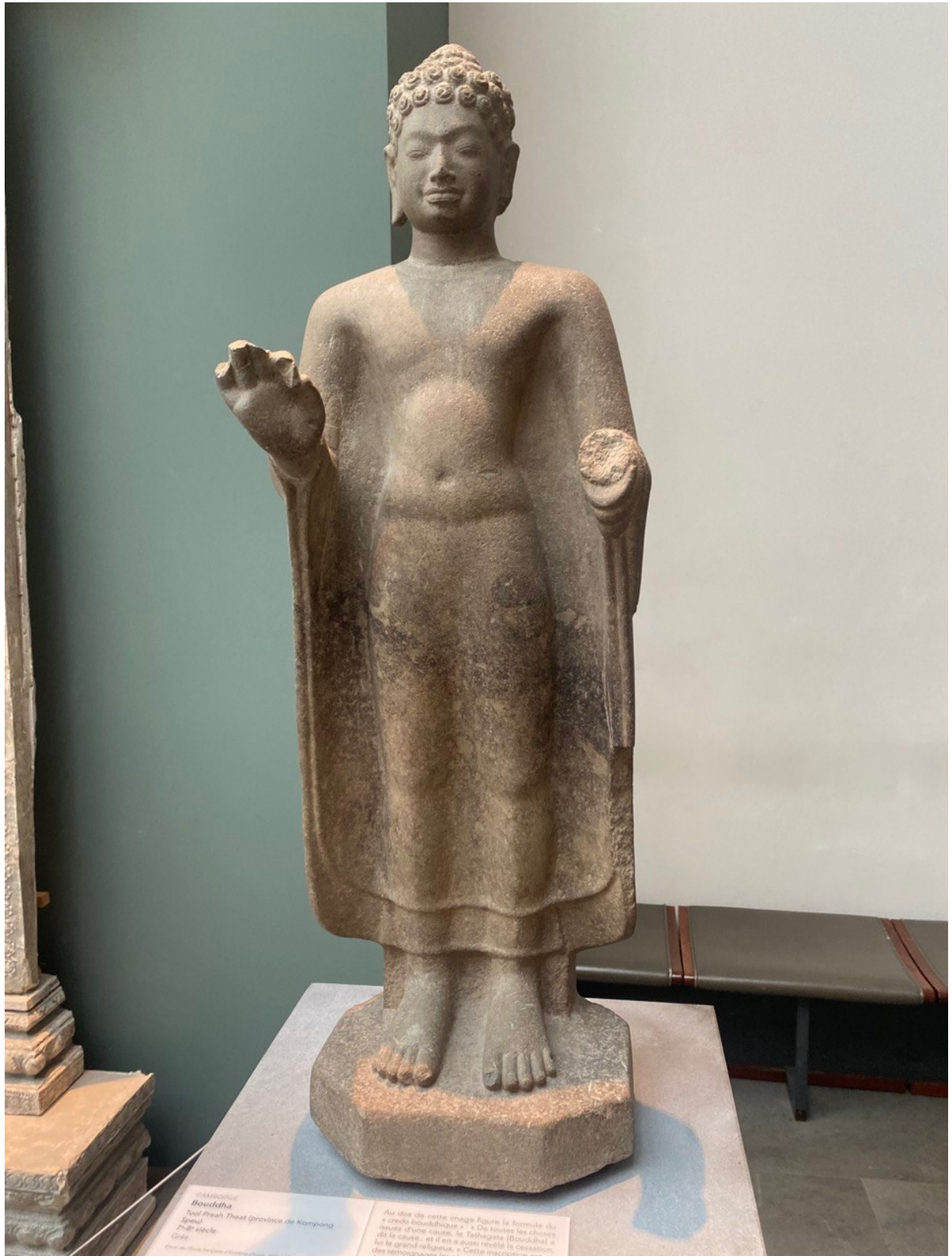
រូបលេខ៣៖ ព្រះពុទ្ធរូបរកឃើញនៅទួលព្រះធាតុ ខេត្តកំពង់ស្ពឺ តាំងនៅសារមន្ទីរជាតិហ្គីមេត ប្រទេសបារាំង (មើលពីមុខចំ)