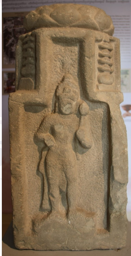
រូបលេខ១-២៖ បដិមាព្រះពុទ្ធរូបរកឃើញនៅវត្តរំលក និងចម្លាក់ព្រះពោធិសត្វធ្លាក់នៅ លើថ្មគោល