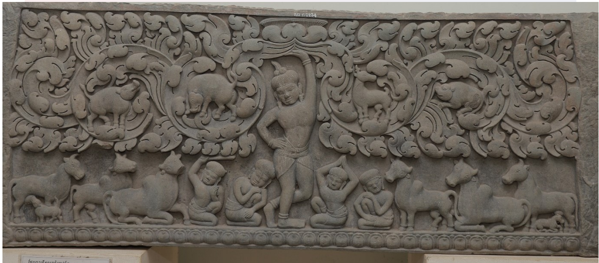
រូបលេខ១០៖ ចម្លាក់ព្រះក្រិស្ណទ្រង់គោរងនៅប្រាសាទស្រីគ្រប់ល័ក្ខណ និងបង្ហាញពីទម្រង់ឈររបស់ព្រះក្រិស្ណបែប សូស្តិកសន