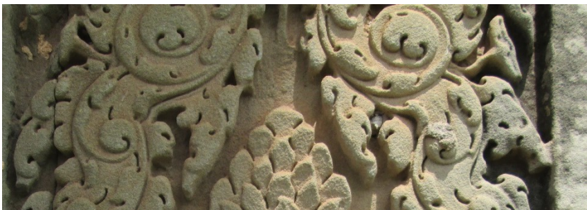
ដោយ៖ ម៉ង់ វ៉ាលី