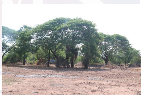
រូបលេខ៣ និង៤៖ ទីតាំងរកឃើញសិលាចារឹកទួលស្រែកូមិ ក្នុងស្រុកមោងឫស្សី ខេត្តបាត់ដំបង