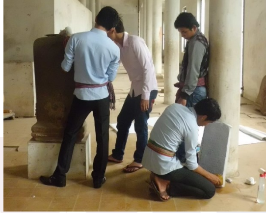
រូបលេខ១ និង២៖ ក្រុមការងារចុះផ្តិតសិលាចារឹកនៅសារមន្ទីរវត្តពោធិវាល ក្រុងបាត់ដំបង