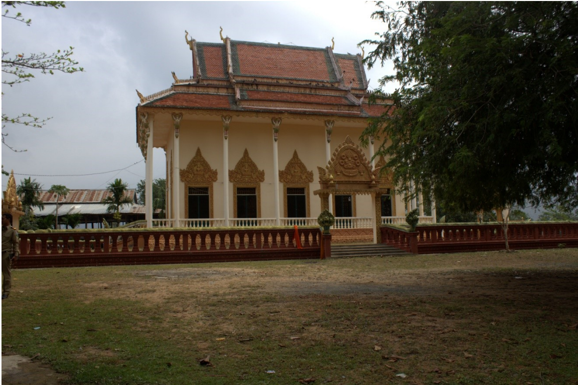
រូបលេខ១៖ ទីតាំងវត្តគិរីស្តេចគង់ ដែលជាអតីតប្រាសាទបុរាណនៅស.វ.ទី៧