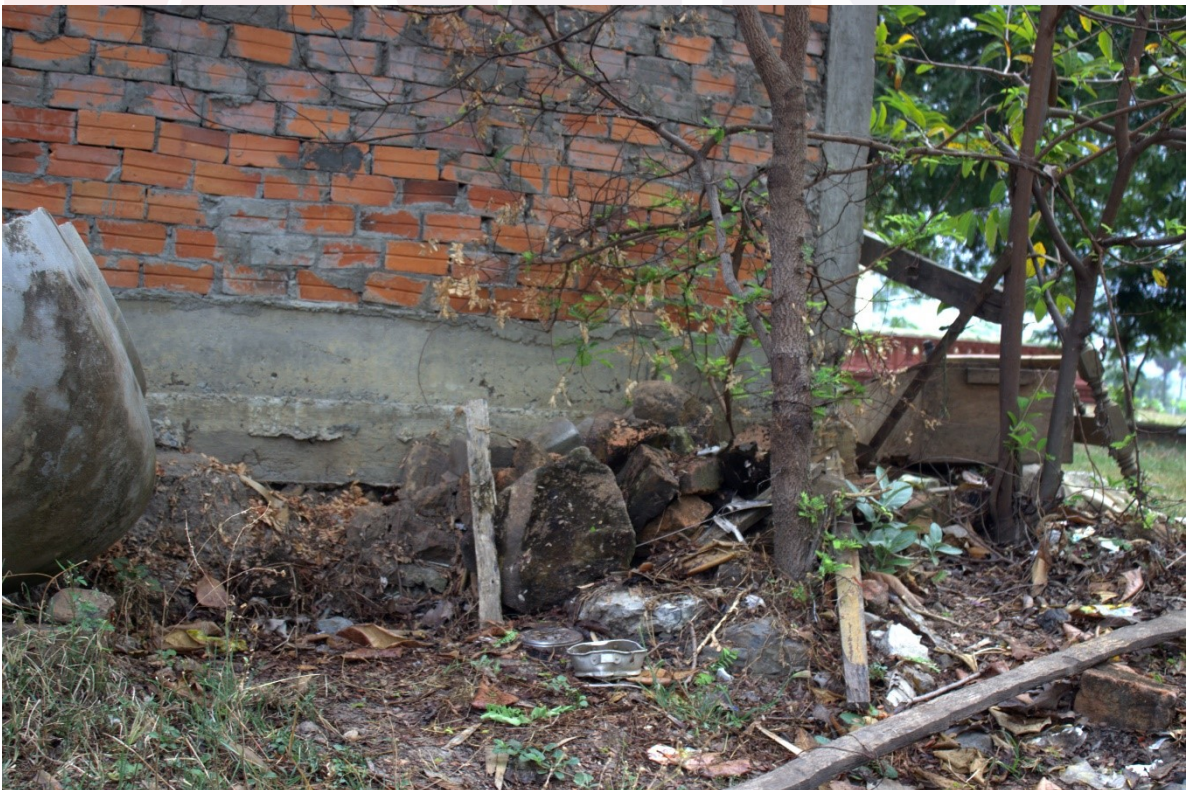
រូបលេខ២៖ ស្នាក់ស្នាមឥដ្ឋប្រាសាទបុរាណនៅស.វ.ទី៧ មុនការធ្វើកំណាយ