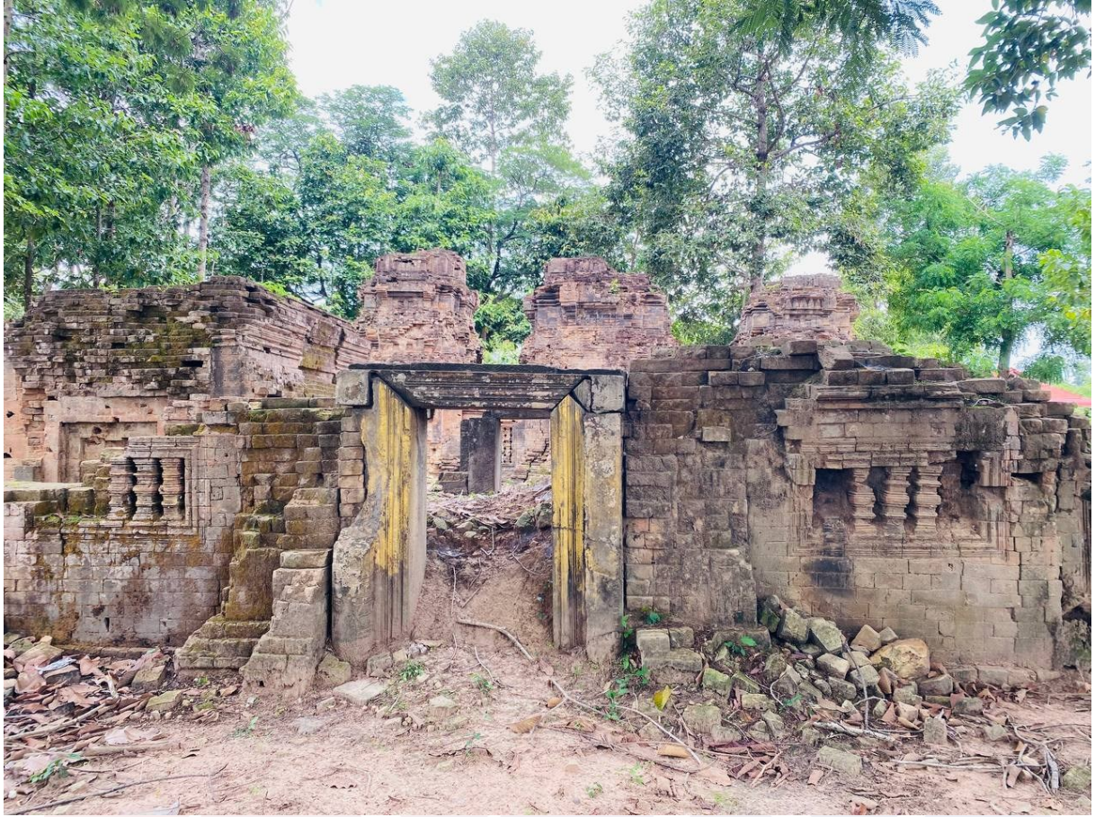
រូបលេខ១១១៖ កំពែងច្រកចូលប្រាសាទស្លាប់ប្តី (លម្អបង្អួច និងចម្រើង)