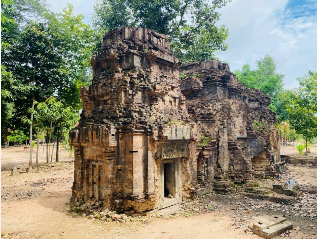
រូបលេខ៣៖ ប្រាង្គទាំងបីនៃប្រាសាទស្វាប់ប្តី (មើលពីអាគ្នេយ៍)