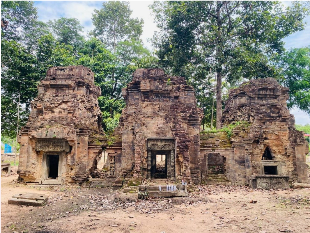
រូបលេខ១៖ ប្រាង្គទាំងបីនៃប្រាសាទស្លាប់ប្តី (មើលពីមុខ មុខខាងកើត)