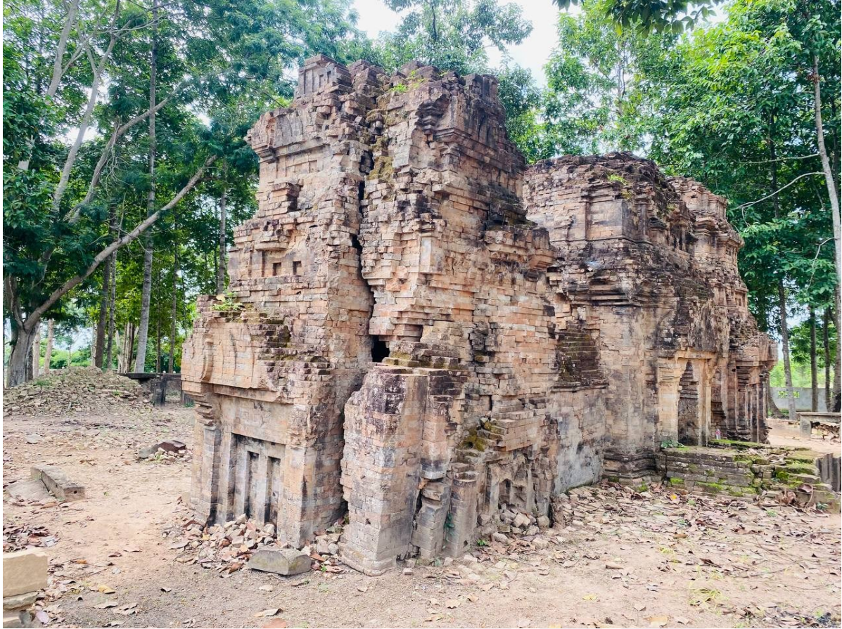
រូបលេខ៥៖ ប្រាង្គទាំងបីនៃប្រាសាទស្វាប់ប្តី (មើលពីនិរតី)