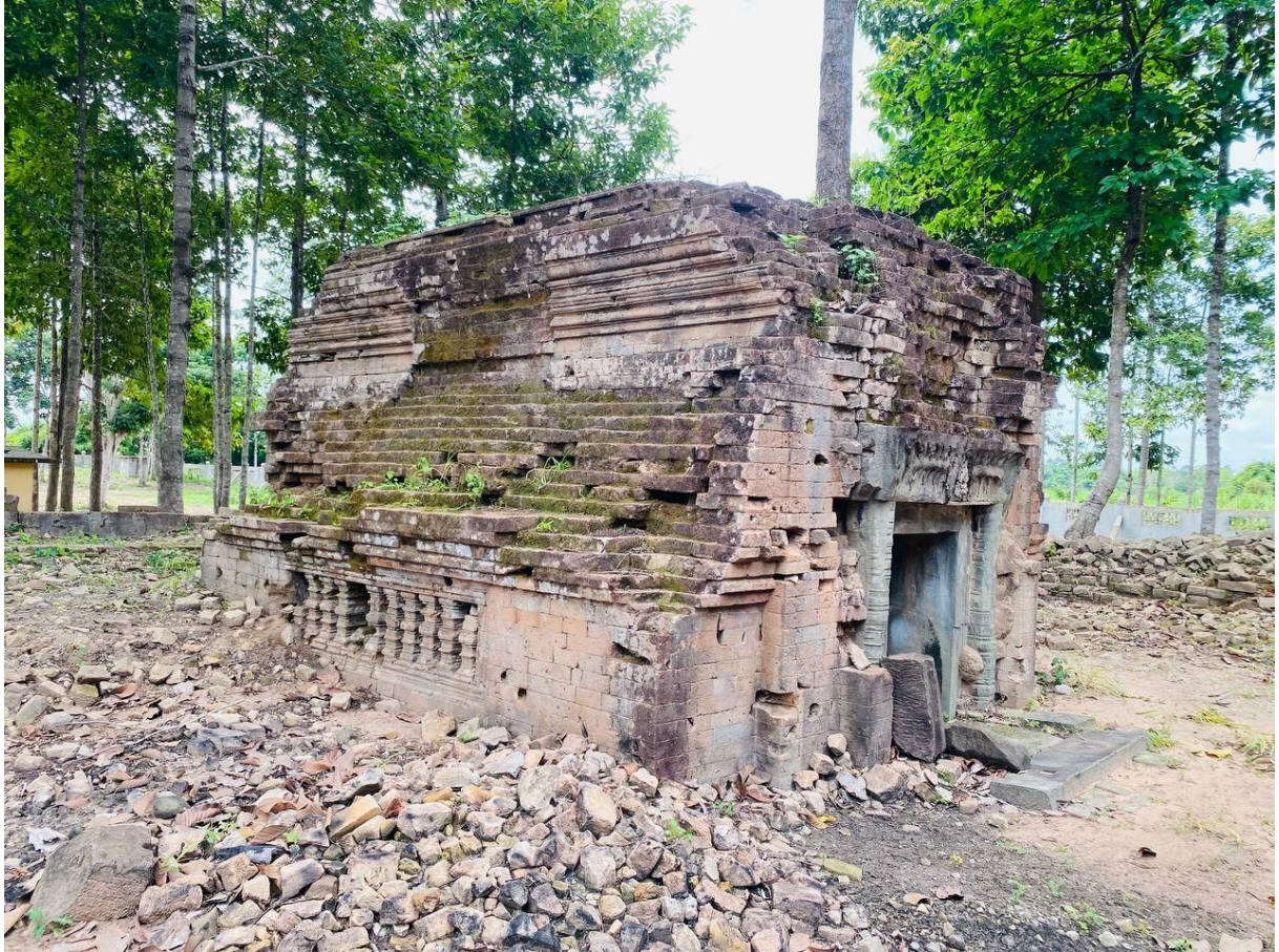
រូបលេខ៩៖ អគារហោត្រៃ ឬអគ្គិគ្រឹះប្រាសាទស្លាប់ប្តី (មើលពីទិសពាយព្យ)