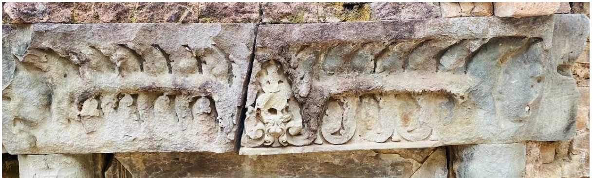
រូបលេខ១០៖ ផ្តែរទ្វារអគារអគ្គិគ្រឹះប្រាសាទស្លាប់ប្តី