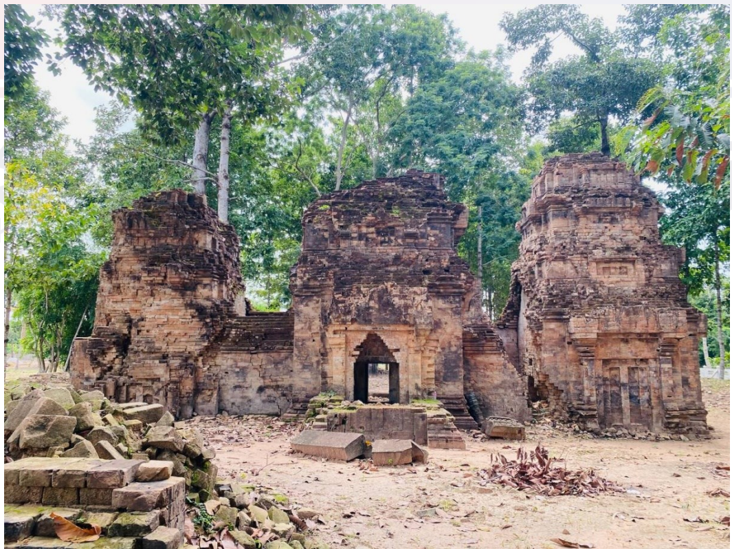
រូបលេខ២៖ ប្រាង្គទាំងបីនៃប្រាសាទស្លាប់ប្តី (មើលពីក្រោយ មុខខាងលិច)