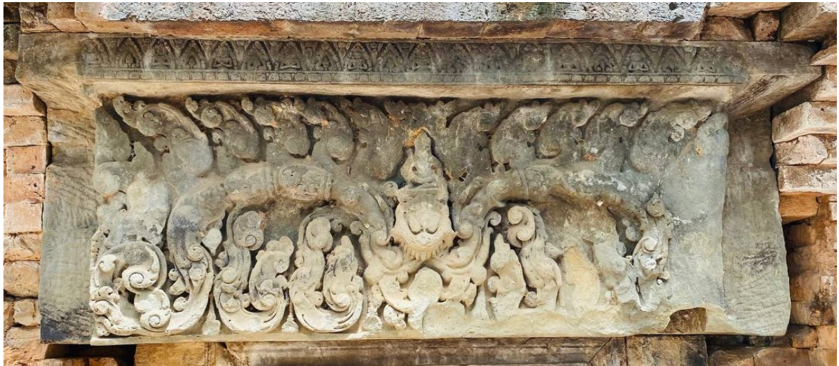
រូបលេខ៧៖ ផ្តែរទ្វារប្រាង្គខាងត្បូងប្រាសាទស្វាប់ប្តី