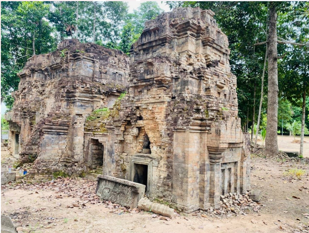
រូបលេខ៤៖ ប្រាង្គទាំងបីនៃប្រាសាទស្វាប់ប្តី (មើលពីព្រំសាន)