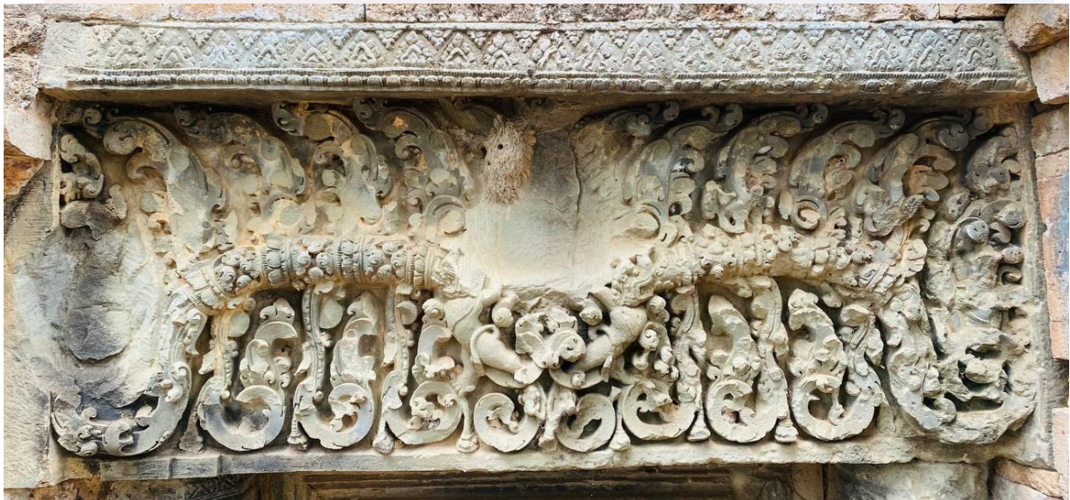
រូបលេខ៦៖ ផ្តែរទ្វារប្រាង្គកណ្តាលប្រាសាទស្វាប់ប្តី