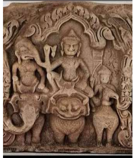
រូបលេខ៧៖ ព្រះស្តុន្តគង់លើក្បែកមកពីប្រាសាទក្រចាប់ (សារមន្ទីរជាតិ) រូបលេខ៨៖ ព្រះស្តុន្តគង់លើក្បែកធ្លាក់លើផ្ទៃរទ្វារវត្តកោះ រូបលេខ៩៖ ព្រះស្តុន្តគង់លើក្បែកធ្លាក់ក្បែរព្រះឥសូរជិះតោនៅផ្ទៃប្រាសាទភិមាយ