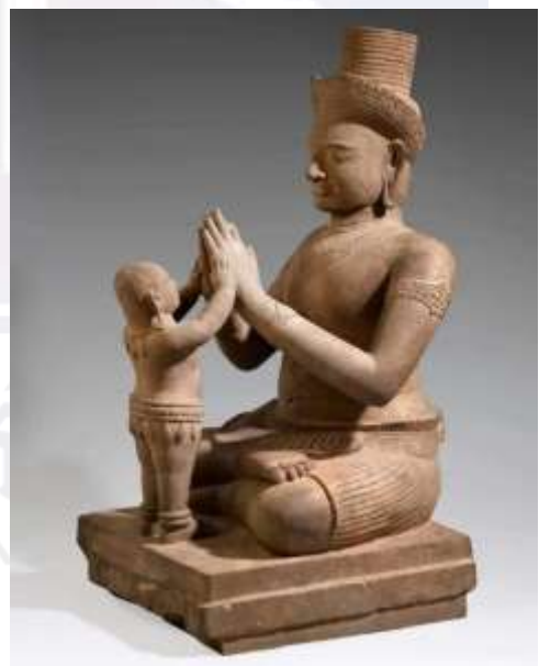
រូបលេខ៤៖ ព្រះស្កន្ធក្នុងលើក្លោកមកពីខេត្តកំពង់ចាម (សារមន្ទីរជាតិ) រូបលេខ៥៖ ព្រះស្កន្ធក្នុងលើក្លោកមិនស្គាល់ប្រភព (សារមន្ទីរកំពង់ធំ) រូបលេខ៦៖ ព្រះស្កន្ធច្រង់ឈរសំពះសុំពរព្រះឥសូរ (សារមន្ទីរជាតិ)