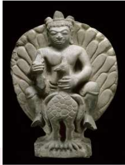
រូបលេខ១-២៖ ចម្លាក់ព្រះស្កន្ធក្នុងឈរលើក្លោកមិនស្គាល់ប្រភព (សារមន្ទីរជាតិ) រូបលេខ៣៖ ព្រះស្កន្ធក្នុងលើក្លោកមកពីទួលក្តីអង្គ ខេត្តព្រៃវែង (សារមន្ទីរហ្គីមេ)