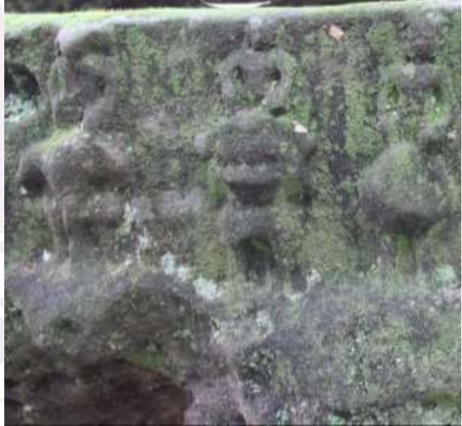
រូបលេខ១០៖ ព្រះស្តុន្តមានព្រះសិវប្រាំមួយគង់លើក្បែកធ្លាក់ក្បែរព្រះឥសូរជិះតោនៅពើងគំនូរ រូបលេខ១១៖ ព្រះស្តុន្តគង់លើក្បែកធ្លាក់ក្បែរព្រះឥសូរជិះតោនៅពើងត្បាល់