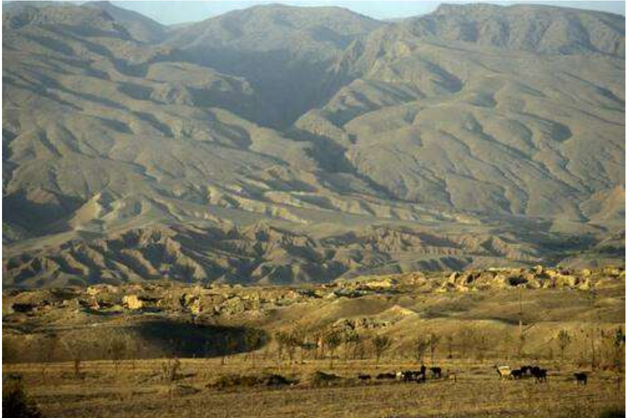
រូបលេខ១ & ២៖ ស្ថានីយ Sarazm