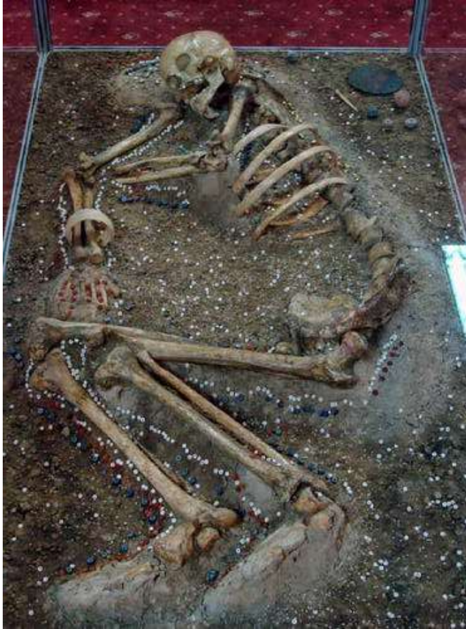
រូបលេខ៥ & ៦៖ គ្រោងឆ្អឹង និង វត្ថុសិល្បៈ ដែលបានរកឃើញកន្លងមក