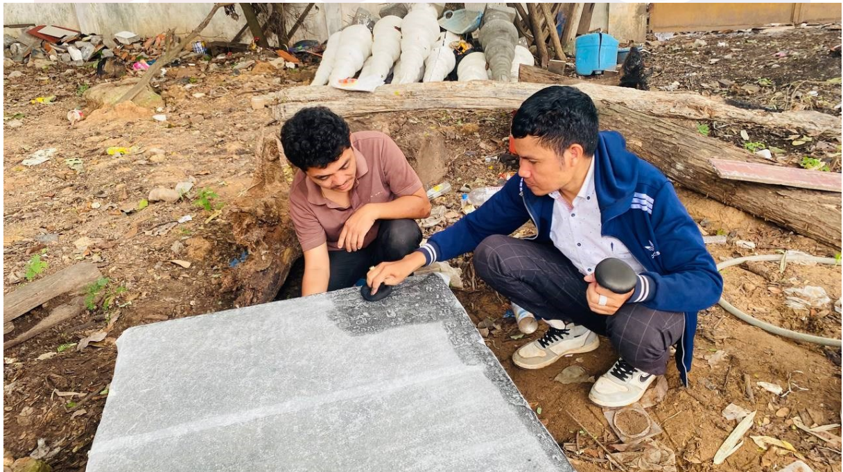
រូបលេខ២៖ ការផ្តិតសិលាចារឹកមេទ្វារខាងត្បូង នៃកំពែងខាងកើត ក្រុមប្រាសាទយាយព័ន្ធ K.440