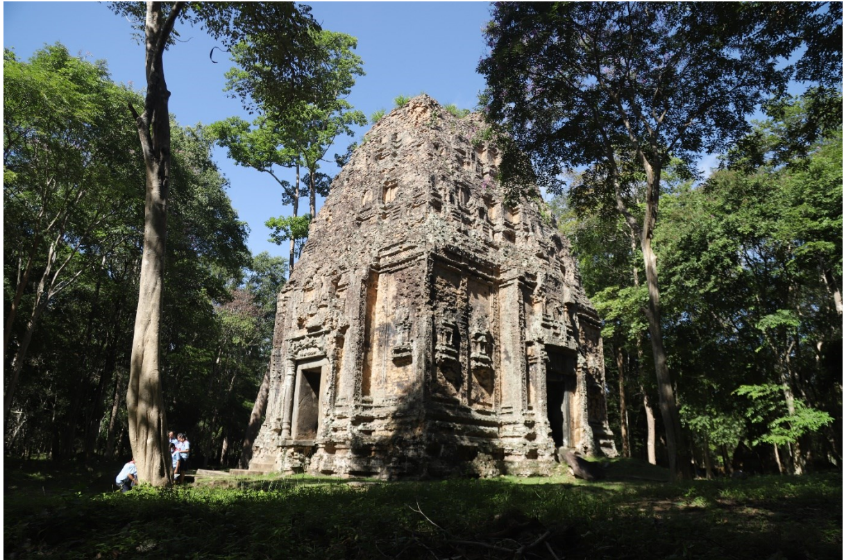
រូបលេខ១៖ ប្រាសាទយាយព័ន្ធ ប្រាង្គកណ្តាល