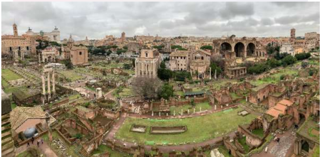
រូបលេខ៩៖ Palatine Hill ដែលស្ថិតនៅក្នុងទីក្រុងរ៉ូម