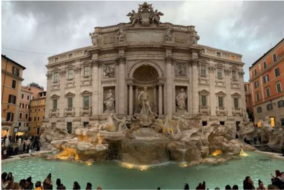
រូបលេខ១០៖ Palatine Hill ដែលស្ថិតនៅក្នុងទីក្រុងរ៉ូម