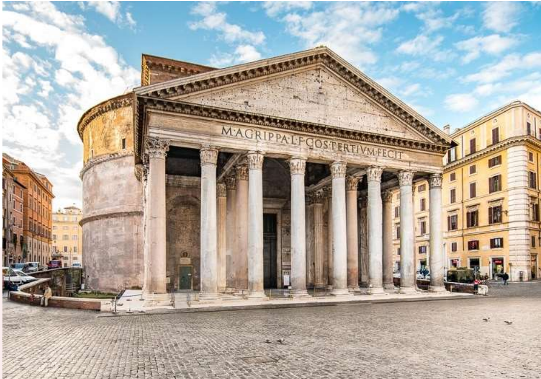
រូបលេខ៦៖ ព្រះវិហារ Patheon of Rome