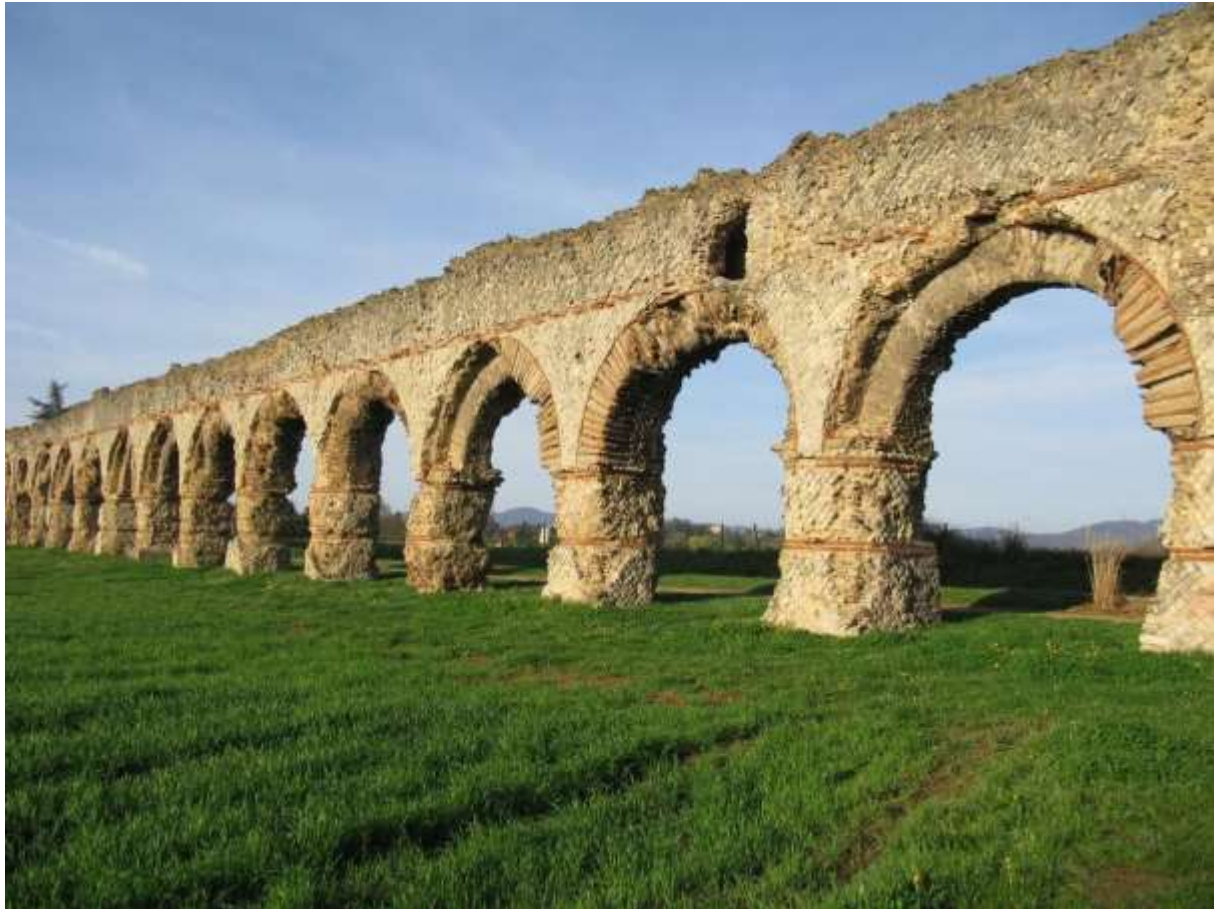
រូបលេខ៨៖ សំណង់ស្ពាន់ទឹក សម័យរ៉ូម៉ាំង