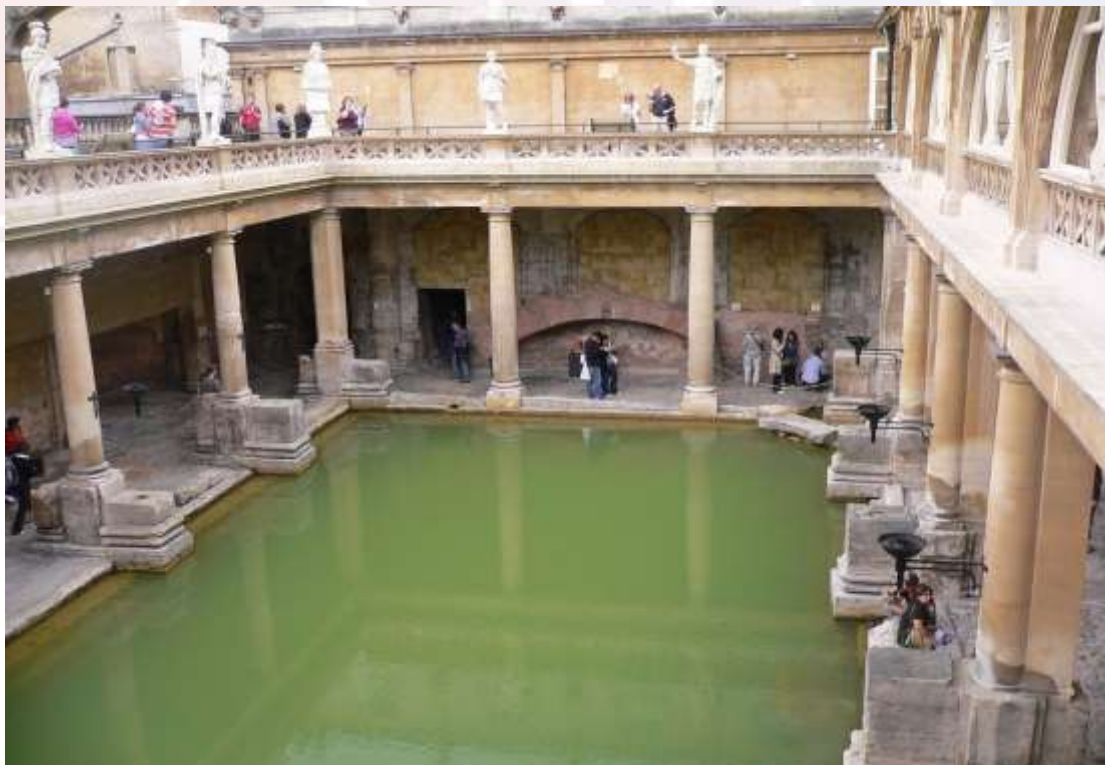
រូបលេខ១១៖ កន្លែងផ្គត់ផ្គង់ទឹកសាធារណៈសម័យរ៉ូមាំង