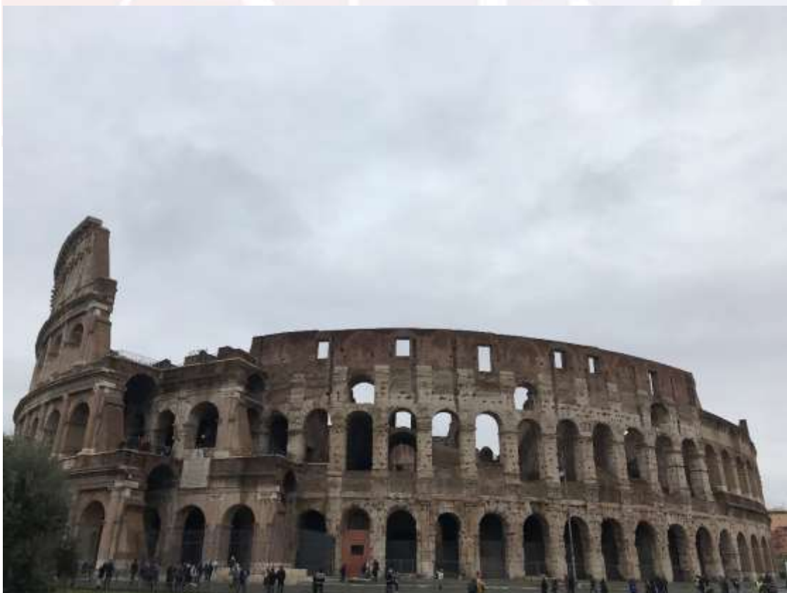
រូបលេខ៧៖ សំណង់ Colosseum