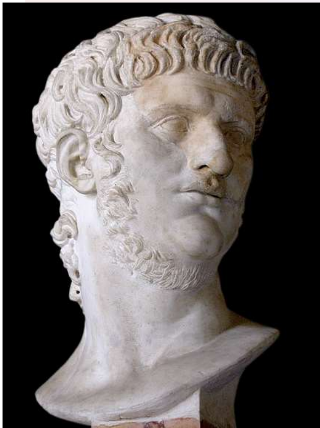
រូបលេខ៣៖ ចម្លាក់ នៃអធិរាជNero