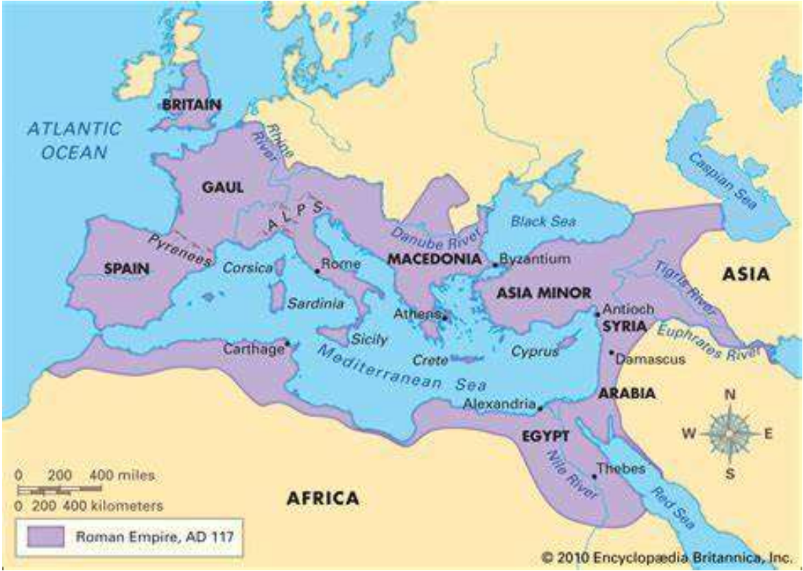
រូបលេខ១៖ ដែនទីរ៉ូមាំងបុរាណ ប្រភព៖ Britannica

រាល់ទន្ទឹន័យទាំងអស់ដែលបានបង្ហាញខាងលើនេះ អាចបង្ហាញឱ្យយើងដឹងបានថា អរិយធម៌រ៉ូមត្រូវបានគេស្គាល់ថា ជាអរិយធម៌ ដែលមានឥទ្ធិពលខ្លាំងលំដាប់ទី២បន្ទាប់ អរិយធម៌ក្រិចក្នុងប្រវត្តិសាស្ត្រតំបន់អឺរ៉ុប។ ការដែលសម្គាល់ថា បែបនេះ គឺតាមរយៈវិសាលភាព នៃការគ្រប់គ្រងទឹកដីស្ទើរទាំងស្រុងនៃតំបន់អឺរ៉ុប និងសំណង់ស្ថាបត្យកម្មដែលបានបន្ទូល ទុកជាច្រើននៅក្នុងបណ្តាប្រទេសក្នុងតំបន់អឺរ៉ុប ជាពិសេសសំណង់ស្ថាបត្យកម្មបុរាណ ស្ថិតក្នុងរាជធានី រ៉ូមផ្ទាល់។