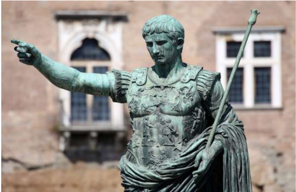
រូបលេខ២៖ ចម្លាក់ នៃអធិរាជAuguste