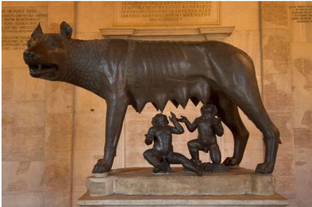
រូបលេខ២៖ ចម្លាក់ទាក់ទងនឹងរឿងព្រេង Romulus និង Remus