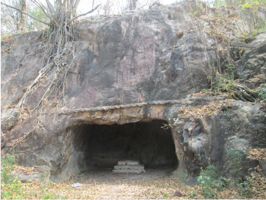
រូបលេខ៦៖ សិល្បៈលុងភ្នំ, ភ្នំជា ស្រុកអង្គរបុរី ខេត្តតាកែវ