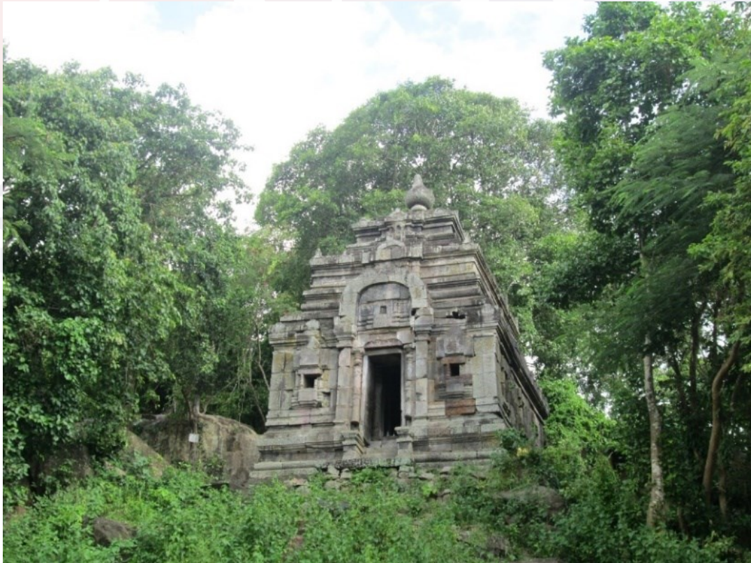
រូបលេខ៧៖ ប្រាសាទអាស្រមមហាសីសាងពីថ្មបាសាល់, ភ្នំជា ស្រុកអង្គរបុរី