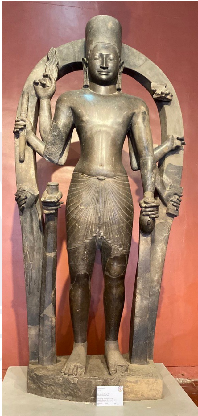
រូបលេខ២៖ បដិមាព្រះពុទ្ធរូបធ្វើអំពីឈើរកឃើញនៅ Go Thap (តំបន់ជុំវិញក្រុងអូរកែវ) រូបលេខ៣៖ បដិមាព្រះវិស្ណុមានព្រះហស្តប្រាំបីរកឃើញនៅភ្នំដា ដោយលោក Henri Mauger (សព្វថ្ងៃនៅរក្សាមន្ទីរជាតិកម្ពុជា)