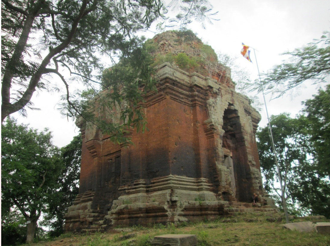
រូបលេខ៨៖ ប្រាសាទភ្នំដាសាងពីថ្មបាយក្រៀម សង់នៅលើគ្រឹះប្រាសាទចាស់នៅសម័យហ្វូណាន