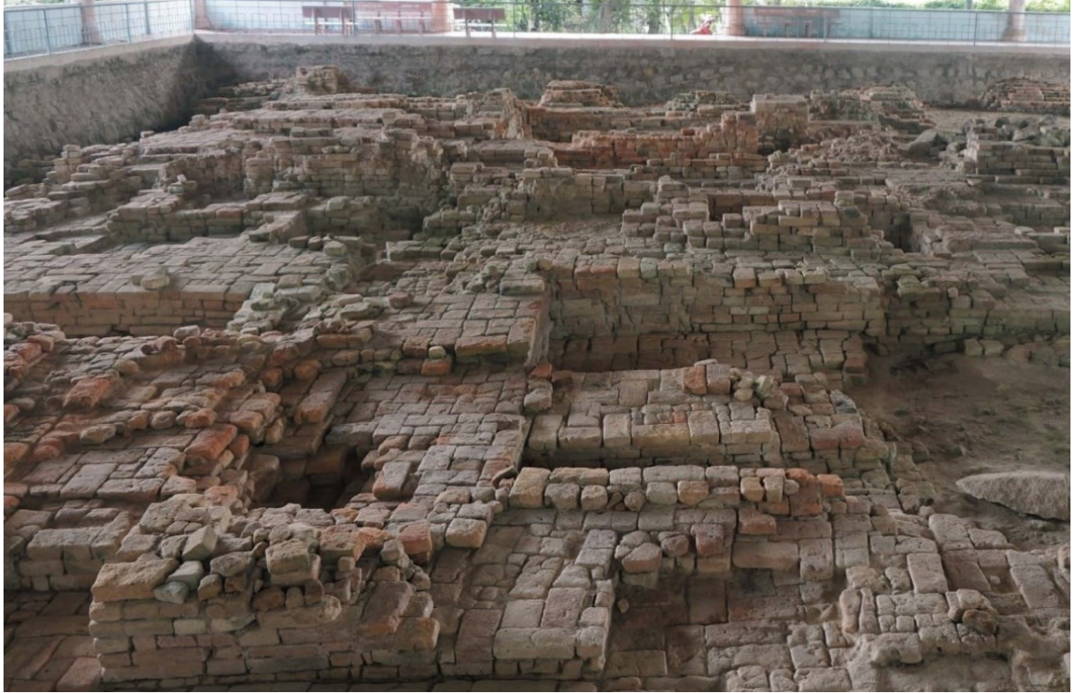
រូបលេខ១៖ គ្រឹះប្រាសាទរកឃើញនៅ Go Thap (តំបន់ជុំវិញក្រុងអូរកែវ)

Wolters, O.W., 1979. "Khmer 'Hinduism' in the Seventh Century," in R.B. Smith & W. Watson (eds) Early South East Asia: Essays in Archaeology, History and Historical Geography , New York & Kuala Lumpur: Oxford University Press, pp.427-442.