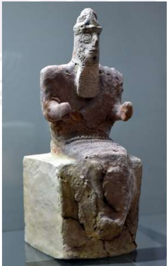
អត្ថបទដោយ៖ អេង តុលា