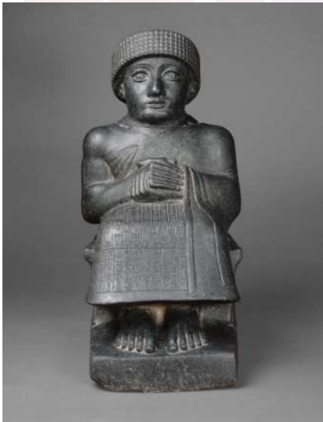
រូបលេខ៤៖ រូបចម្លាក់ Gudea