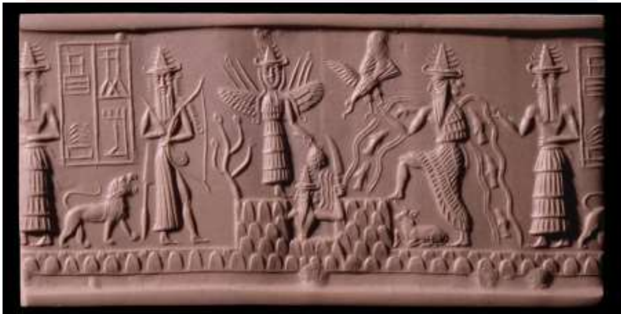
រូបលេខ២៖ ចម្លាក់រូបអាទិទេពបរហាញ្ច័ (Hunting god (full-Face))