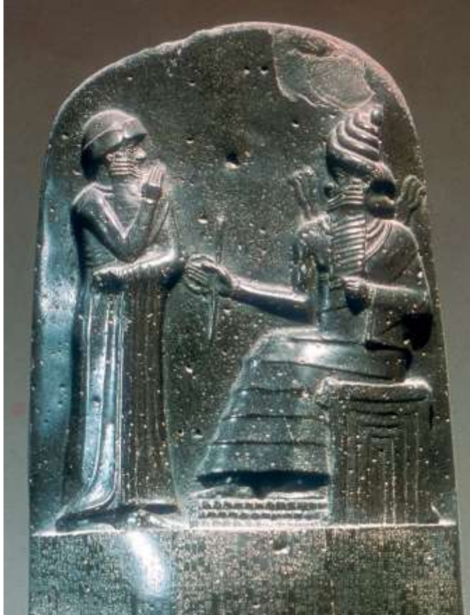
រូបលេខ៣៖ ចម្លាក់ស្តេច Hammurabi ជាមួយនឹងអាទិទេព