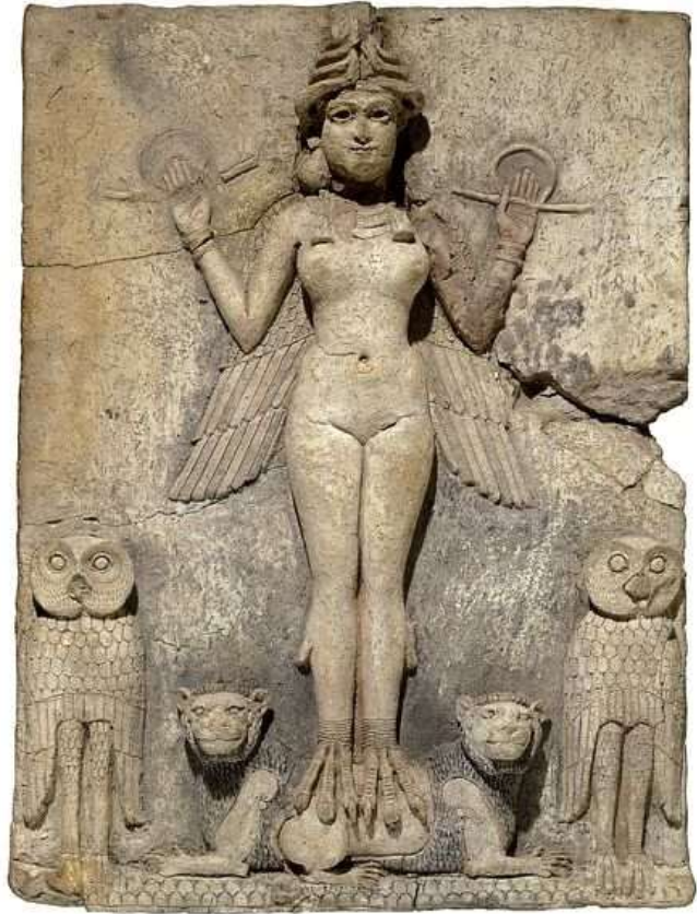
រូបលេខ៧៖ ម្ចាស់ក្សត្រីពេលរាត្រី (Queen of the night )