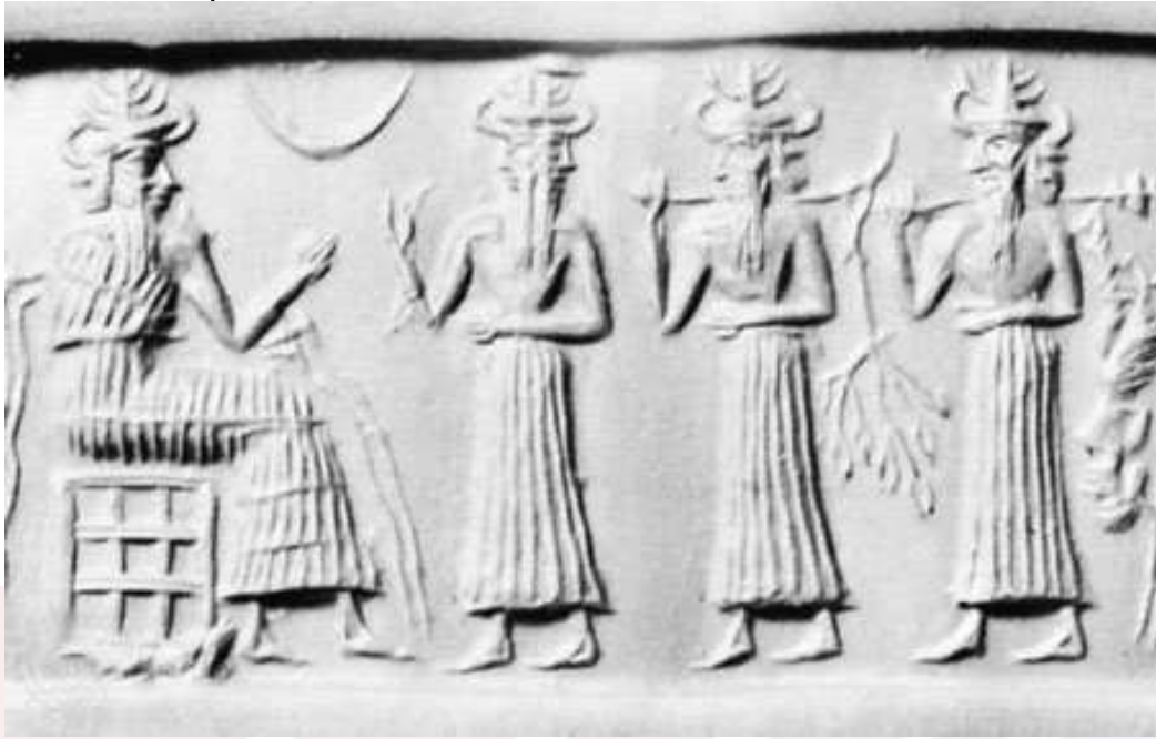
រូបលេខ៤៖ ចម្លាក់បង្ហាញពីអាទិទេព Anunnaki