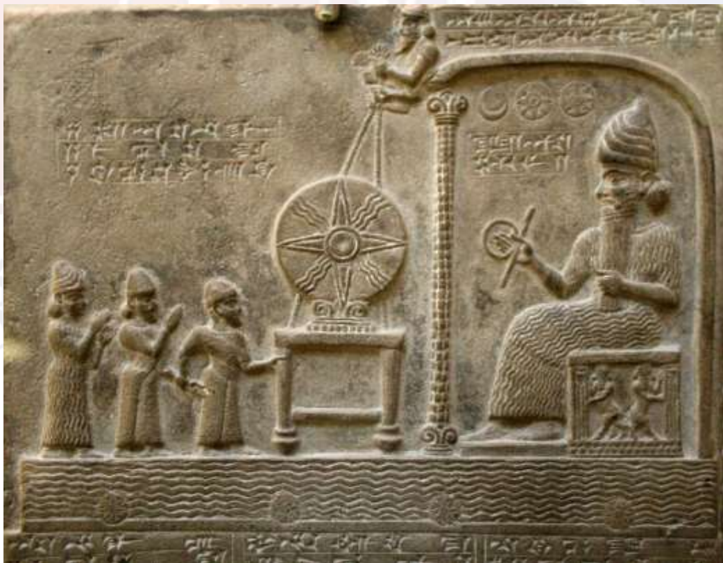
រូបលេខ៦៖ ចម្លាក់បង្ហាញពីអាទិទេព Anunnaki