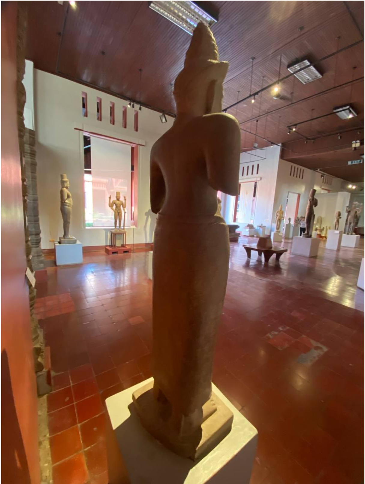
រូបលេខ៥៖ បដិមាព្រះនាងស្រីរាជេន្ទ្រទេវី (មើលពីចំហៀងក្រោយ)