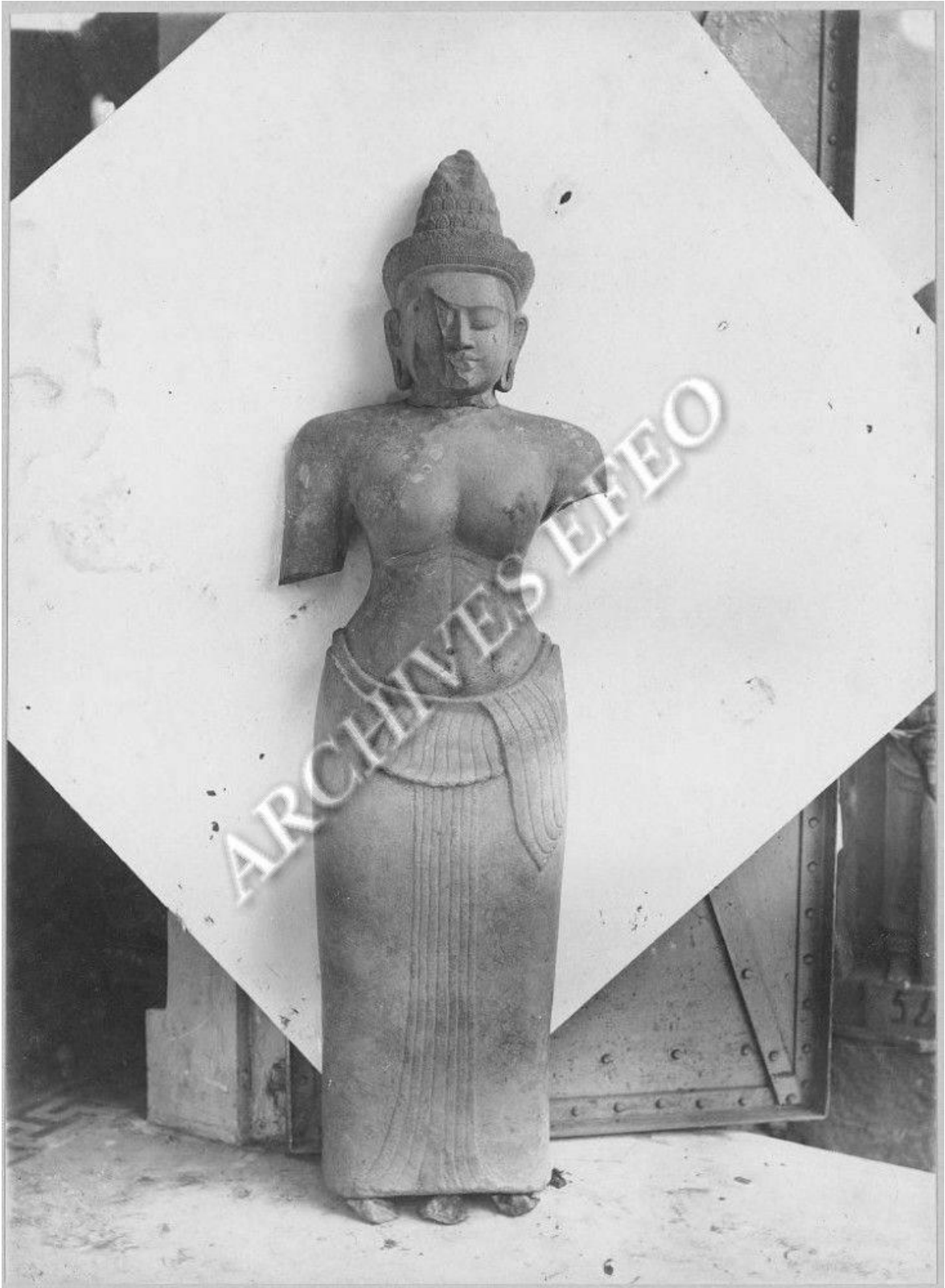
រូបលេខ២៖ បដិមាព្រះនាងស្រីរាជេន្ទ្រទេវី ថតនៅទសវត្សរ៍ ១៩៣០