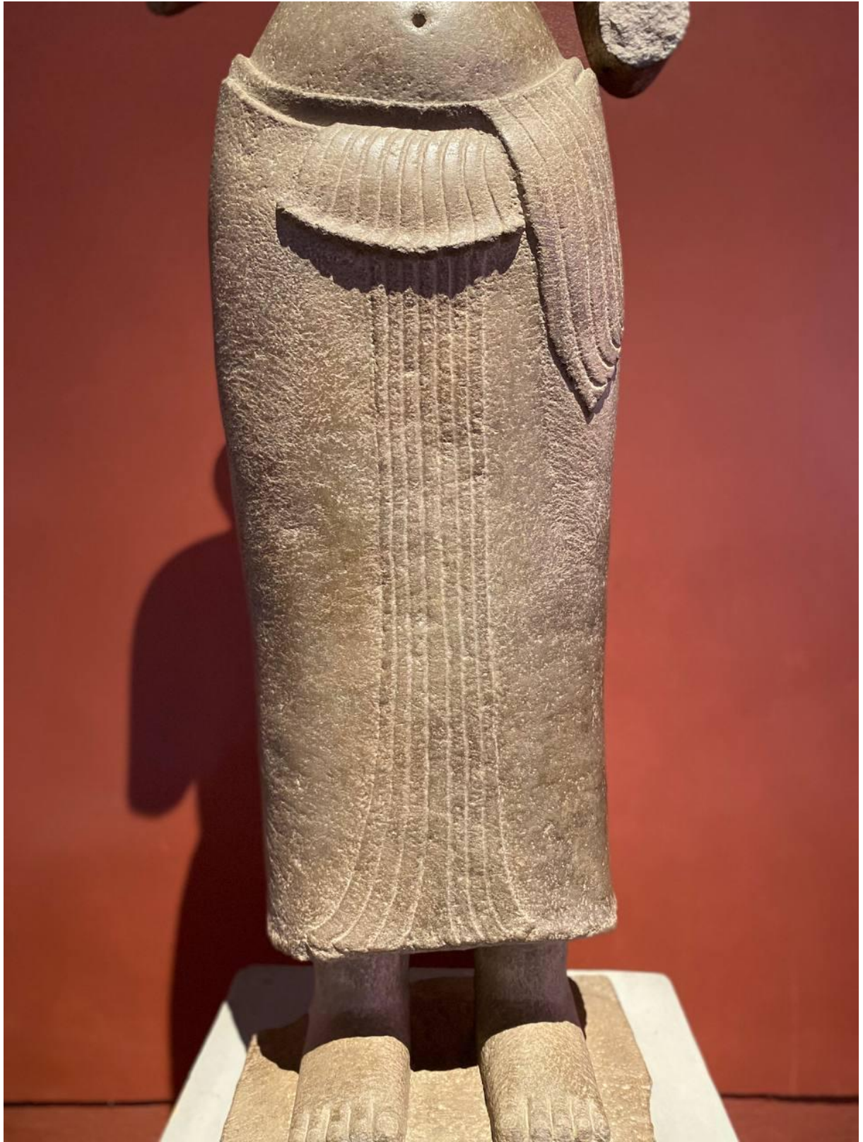
រូបលេខ៨៖ លម្អិតបដិមាព្រះនាងស្រីរាជេន្ទ្រទេវី មួយកំណាត់ខ្លួនចុះក្រោម