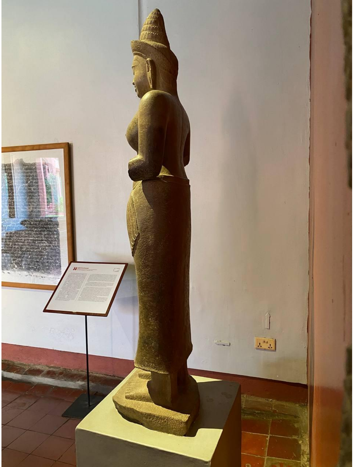
រូបលេខ៦៖ បដិមាព្រះនាងស្រីរាជេន្ទ្រទេវី (មើលពីចំហៀងខាងក្រោយ)