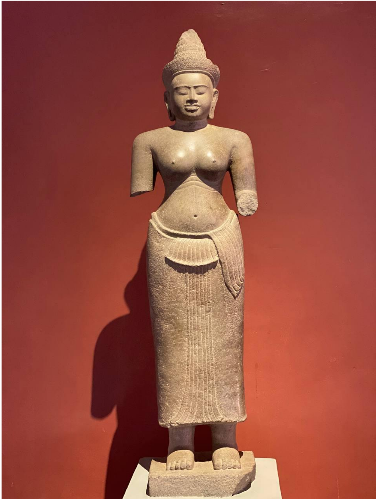
រូបលេខ៣៖ បដិមាព្រះនាងស្រីរាជេន្ទ្រទេវី (មើលចំពីមុខ)