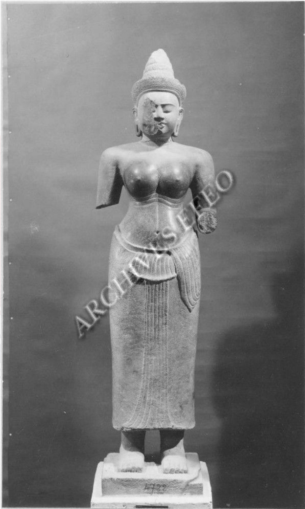
រូបលេខ១៖ បដិមាព្រះនាងស្រីរាជេន្ទ្រទេវី ថតនៅទសវត្សរ៍ ១៩៣០