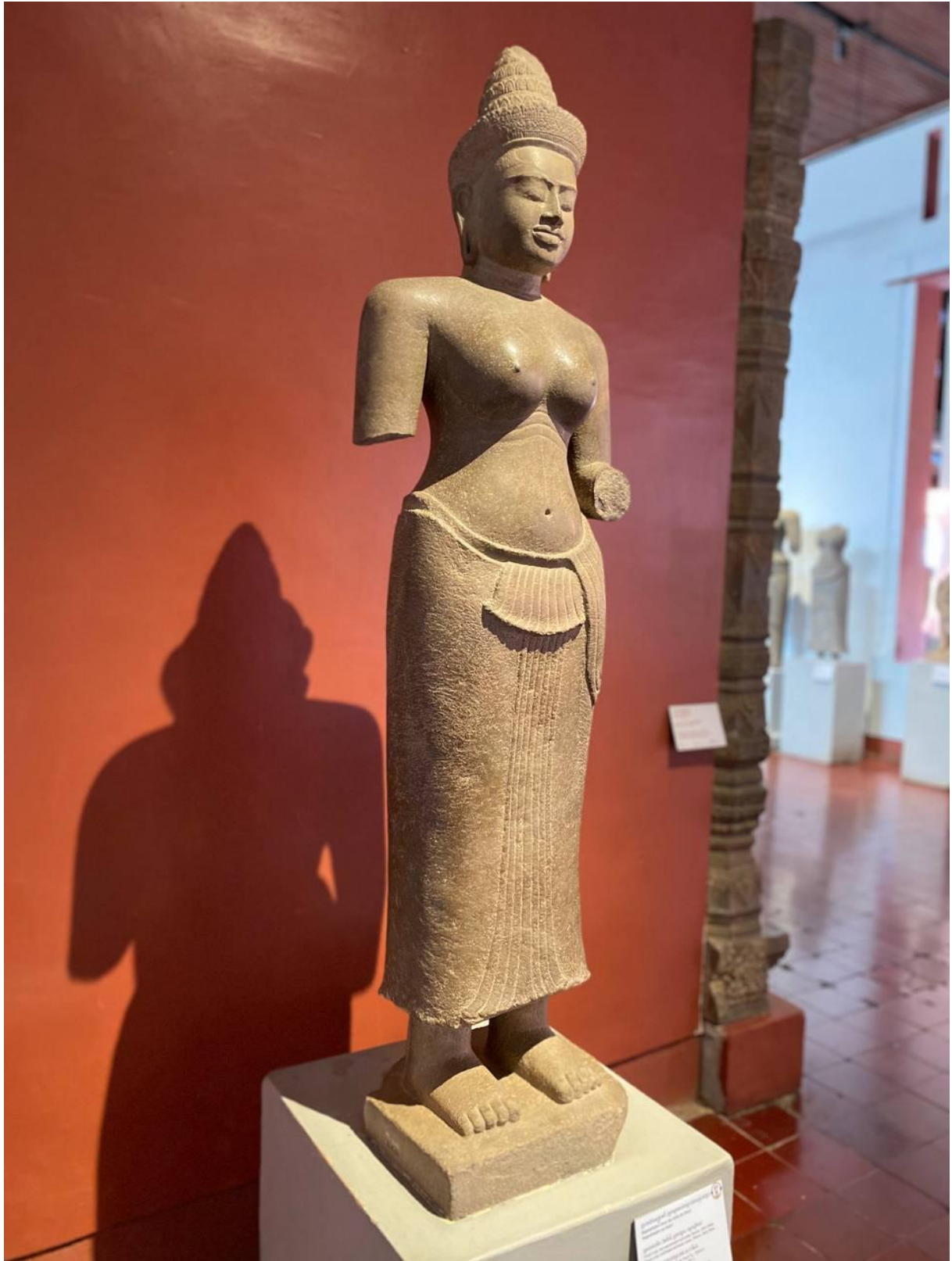
រូបលេខ៤៖ បដិមាព្រះនាងស្រីរាជេន្ទ្រទេវី (មើលពីចំហៀងខាងស្តាំ)