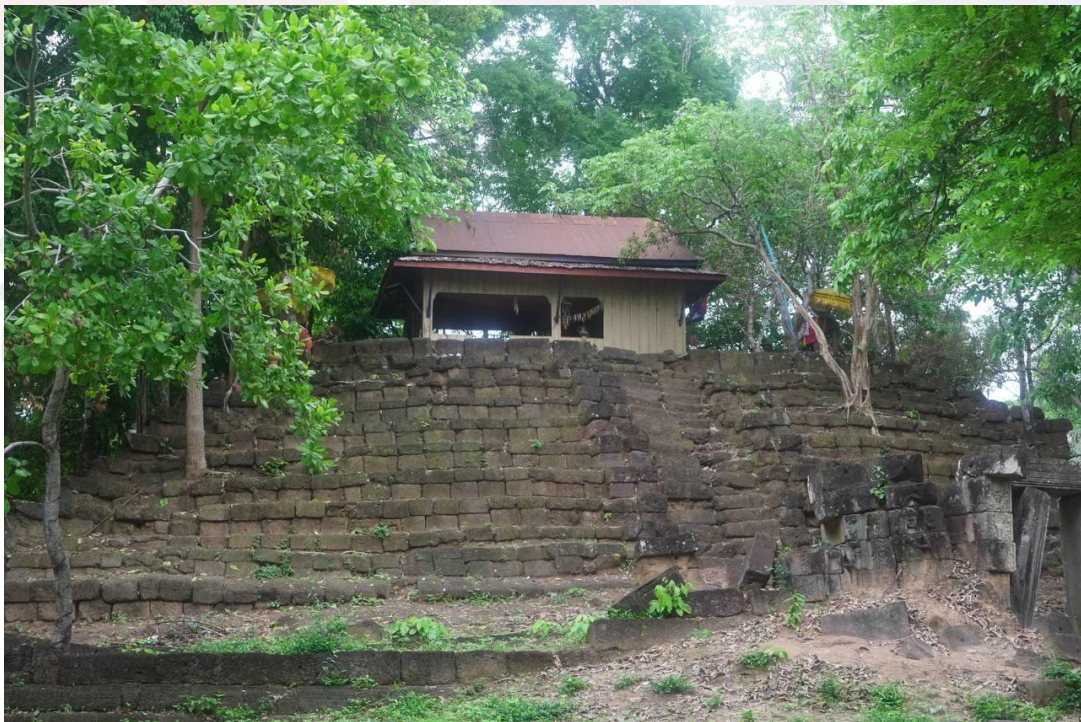
រូបលេខ២៖ ប្រាសាទព្រះដំរី ខេត្តព្រះវិហារ