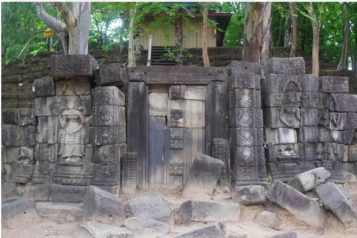
រូបលេខ៤៖ ក្បាច់លម្អនៅទ្វារបញ្ឆោតប្រាសាទព្រះដំរី ខេត្តព្រះវិហារ