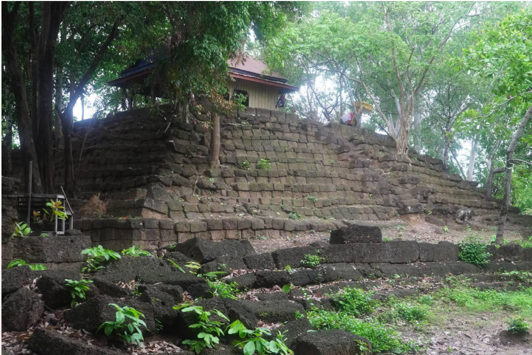
រូបលេខ១៖ ប្រាសាទព្រះដំរី ខេត្តព្រះវិហារ