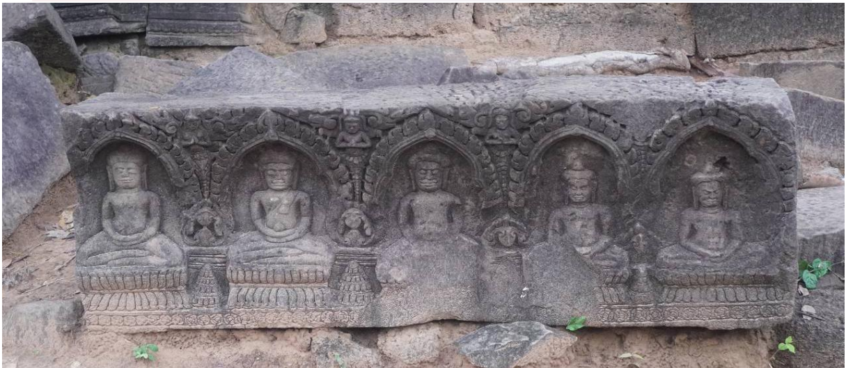
រូបលេខ៦៖ ផ្តែរទ្វារលម្អដោយរូបទាំង ៥ នៅប្រាសាទព្រះដំរី ខេត្តព្រះវិហារ