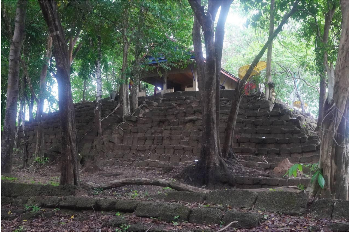
រូបលេខ៣៖ ប្រាសាទព្រះដំរី ខេត្តព្រះវិហារ