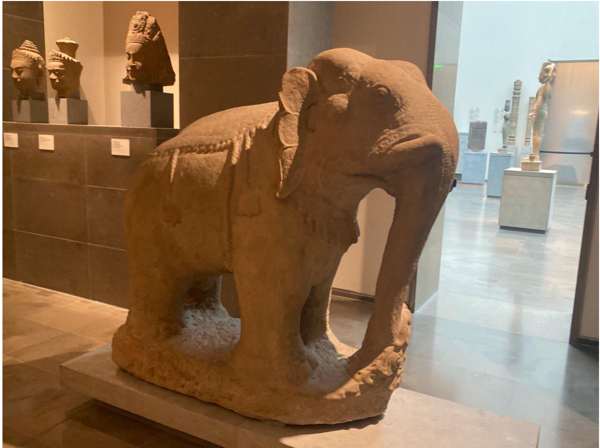
រូបលេខ៧៖ បដិមាដំរីនៅជាន់ខាងលើប្រាសាទព្រះដំរី (សព្វថ្ងៃនៅសារមន្ទីរហ្គីមេត ប្រទេសបារាំង)