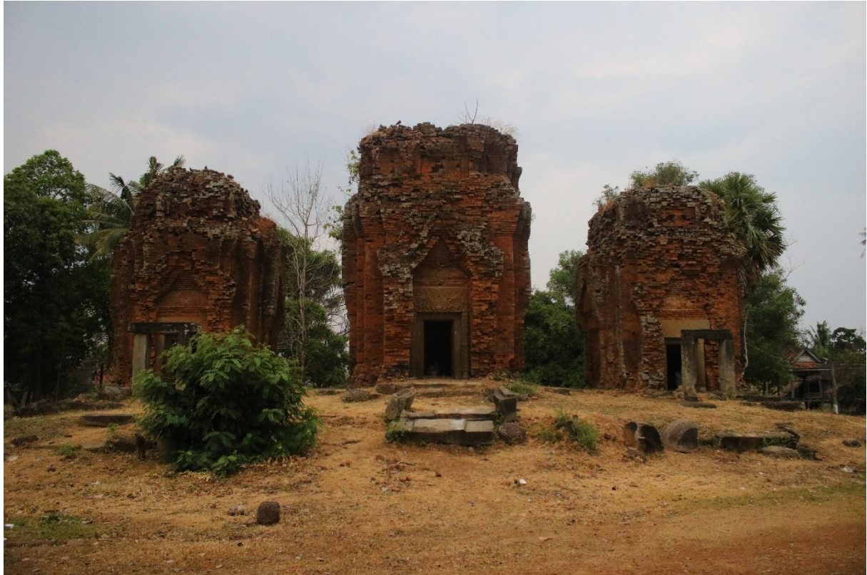
រូបលេខ១៖ ប្រាសាទស្ទឹងខាងកើត មើលពីទិសខាងកើត